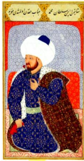
Foto-9: Nakkaş Osman, II. Mehmed Portresi, 1579, Kıyâfetü'l-insâniye fî Şemâ'ili'l-Osmâniye, (TSM. H.1563)

Portrede izlenen figürün poz değeri, yüz anatomisi, oturma biçimi, gül ve mendil motifleri ile sonraki süreçte II. Mehmed portrelerinin düzenine olduğu kadar diğer bazı padişahların portrelerinin düzenine de dolaylı etkilerinin olduğu söylenebilir. Bu etkilerin görüldüğü en erken tarihli örnek, Nakkaş Nigari'nin 1560-2 yıllarına tarihlendirilen, Şehzade Selim'i bir köşkün içinde sağ elinde şarap kadehi sol elinde mendil tutarken tasvir ettiği portredir, (Cenevre, prens Sadruddin Ağa Han Koleksiyonu, TM. S), (foto: 11 ). Diğer taraftan bazı yayınlarda da belirtildiği üzere Nakkaş Nigari'nin Barbaros Hayrettin Paşa'yı karanfil koklarken tasvir ettiği portresinde de bu portreden etkilendiği söylenebilir. Bu portreden etkilenilerek üretildiği düşünülen diğer örnekler ise Nakkaş Osman'ın 1583 tarihli Kıyâfetü'l-insâniye fî Şemâ'ili'l-Osmâniye, (TSM. H.1563) ve Zübdetü't-tevârîh, (TİEM. T. 1973) elyazmalarındaki portre dizilerinde karşımıza çıkmaktadır, (foto: 9). Nakkaş Osman'ın dizilerinden sonra oluşan gelenek doğrultusunda bu etki sürece yayılmış; en azından II. Mehmed portreleri bu portredeki biçime gönderme yapar şekilde tasarlanmıştır.