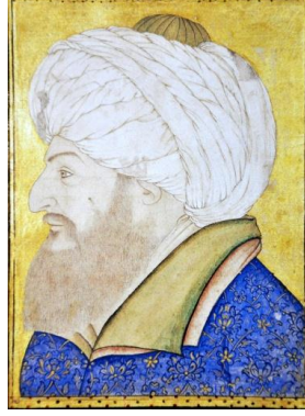
Foto-3: Anonim, II. Mehmed Portresi, 1570'ler (TSM. B. 408, 15b.)

Uygulamasının iki farklı sanatçı tarafından gerçekleştirildiği düşünülen portrede 8 sanatçının uyguladığı yüz anatomisi, birbirine benzerlik gösteren diğer iki örnekten farklı görünmektedir. Özellikle uzun sakal, göz, kaş, burun ve dolgun yüz hatları bu açıdan dikkat çekicidir.