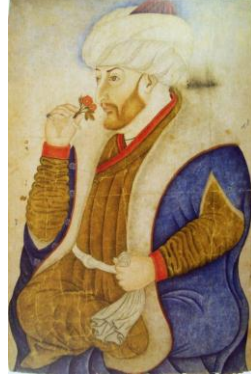
Foto-5: Sinan Bey veya Bursalı Şiblizade Ahmed, II. Mehmed Portresi, 1580'ler (TSM. H. 2153, 10a.)

Bu dönemde üretildiği düşünülen diğer örnek ise II. Mehmed'in oturur pozda gül koklarken tasvir edildiği portredir, (TSM. H. 2153, 10a.) Araştırmacıların yorumlarına bağlı olarak, Sinan Bey 9 veya Bursalı Şiblizade Ahmed'e atfedilen portre 1480'lere 10 tarihlendirilmiştir, (foto: 5).