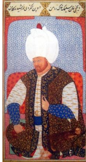
Foto-12: Nakkaş Osman, II. Selim Portresi, 1579, Kıyâfetü'l-insâniye fî Şemâ'ili'l-Osmâniye , (TSM. H.1563)

Portre, Nakkaş Osman dizilerindeki II. Selim portreleri ile karşılaştırıldığında, Nigari'nin eserlerinin Nakkaş Osman tarafından görüldüğü anlaşılmaktadır. 1583 tarihli Kıyâfetü'l-insâniye fî Şemâ'ili'l-Osmâniye , (TSM. H.1563) el yamasındaki II. Selim portresinde sarık, yüz anatomisi, kıyafet özellikleri değiştirilse de figürün oturuş biçimi ve el, kol hareketlerinde Nakkaş Nigari'nin tasarımı tekrarlanmıştır. Nakkaş Osman, bu portreden alarak yönünü değiştirdiği gövdenin üzerine, bir önceki portrenin başını küçük değişiklikler yaparak eklemiştir; böylece yeni bir II. Selim portresi sentezlemiş gibidir, (foto: 12). Nakkaş Osman'ın, Zübdetü't-tevârih , (TIEM. T. 1973) elyazmalarındaki II. Selim portresinde ise bu portredeki oturma biçimini olduğu gibi aldığı, figürün başını yine bir önceki portreden eklediği söylenebilir, (foto: 13).