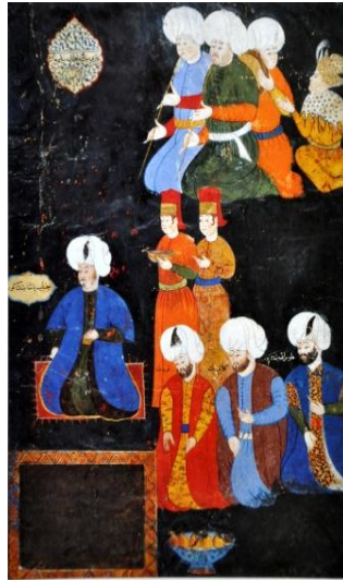
Foto-14: Nigari, İkinci Selim'in Sarayında Musiki Meclisi, 1561-2, (Los Angeles County Museum of art, m.85. 237. 20)

Nigari'nin bir diğer eseri ise 1561-62 yıllarına tarihlendirilen 22 II. Selim'i eğlence sırasında oturur pozda gösteren portredir, (Los Angeles County Museum of art, m.85. 237. 20). 23 Figür, dikey gelişen dikdörtgen bir form içinde, diğer figürler gibi tam boy portre olarak tasarlanmıştır. Bir iç mekanda görünen figürün başı dörtte üç profilden, gövdesi ise cepheden tasvir edilmiştir. Bir önceki portre ile karşılaştırıldığında bu minyatürde figürün sarığı dışındaki kıyafetleri ve yönü değişmiştir, (foto: 14). Kıyafetin kıvrımları verilmediği için oturma biçimine ilişkin ifade de farklılaşmıştır. Diğer örneklerdeki süslemeler bu örneğin kıyafetlerinde uygulanmamıştır. Ancak önceki iki minyatürdeki süsleyici unsurlar bu kez meclisteki diğer figürlerin üzerinde kullanılmıştır.