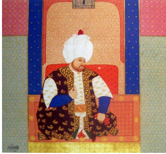
Foto-13: Nakkaş Osman, II. Selim Portresi, Zübdetü't-tevârih, 1583, (TİEM. T. 1973)

Nigari'nin bir diğer eseri ise 1561-62 yıllarına tarihlendirilen 22 II. Selim'i eğlence sırasında oturur pozda gösteren portredir, (Los Angeles County Museum of art, m.85. 237. 20). 23 Figür, dikey gelişen dikdörtgen bir form içinde, diğer figürler gibi tam boy portre olarak tasarlanmıştır. Bir iç mekanda görünen figürün başı dörtte üç profilden, gövdesi ise cepheden tasvir edilmiştir. Bir önceki portre ile karşılaştırıldığında bu minyatürde figürün sarığı dışındaki kıyafetleri ve yönü değişmiştir, (foto: 14). Kıyafetin kıvrımları verilmediği için oturma biçimine ilişkin ifade de farklılaşmıştır. Diğer örneklerdeki süslemeler bu örneğin kıyafetlerinde uygulanmamıştır. Ancak önceki iki minyatürdeki süsleyici unsurlar bu kez meclisteki diğer figürlerin üzerinde kullanılmıştır.