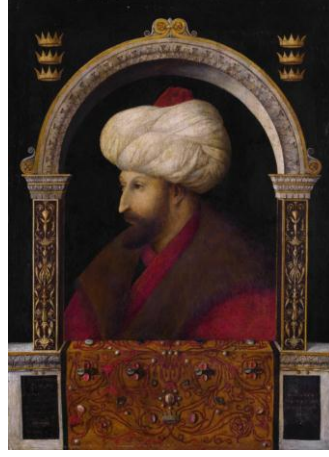
Foto-6: G. Bellini, II. Mehmet, 1480 (Londra National Gallery, 3099)