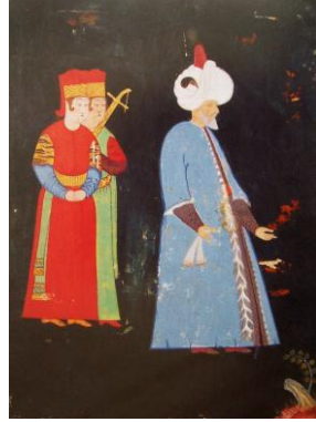
Foto-15: Nakkaş Nigari, Kanuni ve İki Hasodalısı, 1560-5, TSM. H. 2134, 8a)

Nakkaş Nigari'ye atfedilen portrelerden biri de 1560-1565 tarihli Kanuni Sultan Süleyman'ın yaşlılık dönemini tasvir eden bir minyatürde yer almaktadır. Bu minyatürde, (TSM. H. 2134, 8a), padişah, arkadaki silahların giysilerinden çok daha sade, görkemli olmaktan çok yaşlı bedenini ısıtan kürklü bir kaftan giymiş, düşünceler içinde bir bahçede dolaşmaktadır (foto:15). 24 Nakkaş portrede adeta Osmanlı padişahının ihtişamını ve resmiyetini hiçe sayarak, padişahı gündelik yaşamın bir kesitinde sunmuştur. Bu özgün yaklaşımıyla sanatçı öncülleri, çağdaşları ve ardılları arasında özel bir yere sahiptir. 25 Resim alanında, sağ alt köşesinde toprak birikintisi üzerindeki ağaç kökünden filiz vermiş yapraklı küçük bir dal ve birkaç çiçek dışında mekana ilişkin her hangi bir tanım yoktur. Figürler karanlık bir gece içinde tasvir edilmiş gibidir. Zemin rengi ve yüzeyin kullanılış özellikleriyle, Nakkaş Nigari'nin II. Selim portreleri ile benzeşen minyatür, renk, uygulama teknikleri ve işçilik detayları açısından da benzeşmektedir. 26