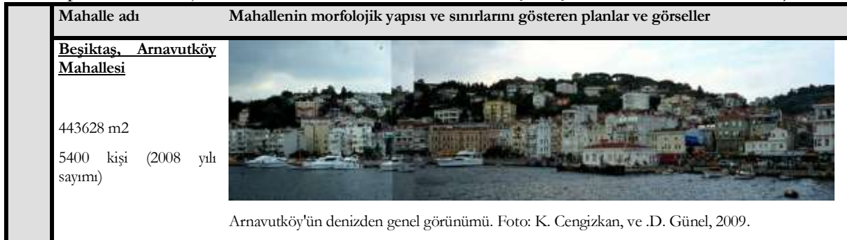
Tablo 2: Farklı karakterdeki mahalle dokularının mekânsal ve sosyal analizleri. (Mekânsal analiz; sokak-parcel morfolojisi ve alan sınırları üzerinden ele alınmıştır. Çizim: Özbek Eren, i. 2012).

Bu değerlendirmeler ışığında, kent morfolojisi ve yaşamı üzerinde etkili bir mekanizma olarak mahalle niteliği gösteren/gösteremeyen yerleşmelerin kentteki izlerini veya süreksizliklerini bu veriler doğrultusunda irdelemek hedeflenmiştir.