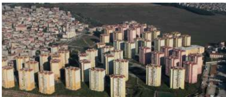
Ayazma Mahallesi'ndekilerin yerleştirildiği toplu konutlar, Bezirganbahçe.