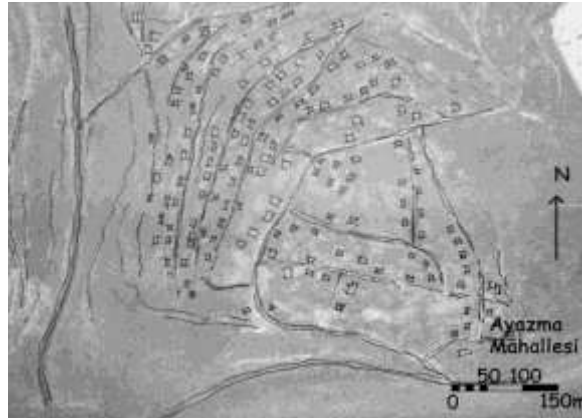
1/5000 ölçekli Ayazma Mahalle dokusunu anlatan plan(Belediye haritalarından ve fotoğraflardan üretilmiştir.)