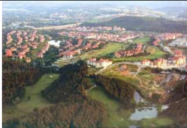
Kemercountry genel görünüm.

www.tuik.gov.tr . [Erişim tarihi: Ocak 2012]