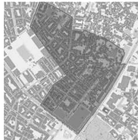
Zeyrek Mahalle sınırlarını gösteren plan. (Fatih Belediyesi Coğrafi Bilgi Sistemi'nden üretilmiştir.)