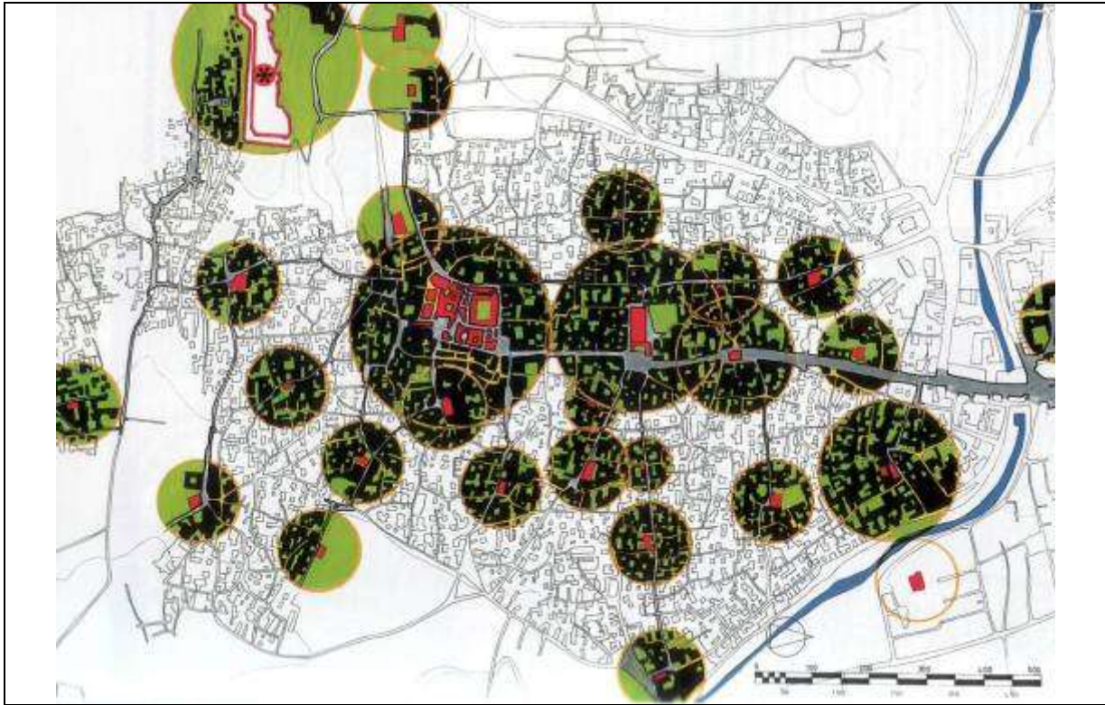
Şekil 1: Osmanlı kent dokusunun belirgin özelliği olan, merkezde imaret ve onu saran konut alanlarını anlatan şema. Urfa kent planı. Kaynak: Aru, K. A., (1998). Türk Kenti- Türk Kent Dokularının İncelenmesine Ve Bugünkü Koşullar İçinde Değerlendirilmesine Yönelik Bir Yöntem Araştırması, YEM Yayınları, İstanbul, s.203.