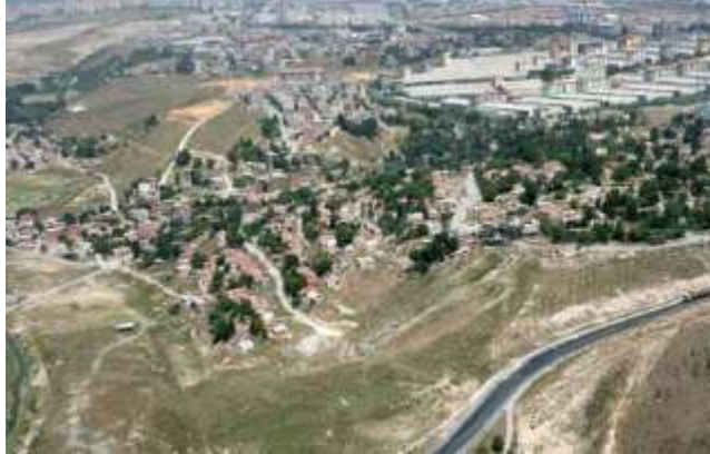
Yıkılmadan önce Ayazma Mahallesi'nin genel görünümü. Fotoğraf: www.ugurkentseldonusum.com . [Erişim tarihi: Ocak 2012]

http://ayazmamagdurlari.wordpress.com . [Erişim tarihi: Ocak 2012]