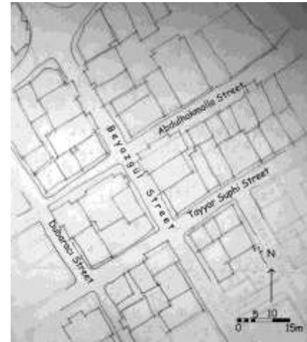
1/500 ölçekli parsel-bina-yol ilişkisini anlatan plan. (Belediye haritalarından üretilmiştir.)