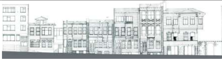
Zeyrek, Parmaklık Sokak Silueti. (Çizen: İ.Ö.Eren)

Nüfus bilgisi kaynak: http://www.wowturkey.com [Erişim tarihi: Ocak 2012]