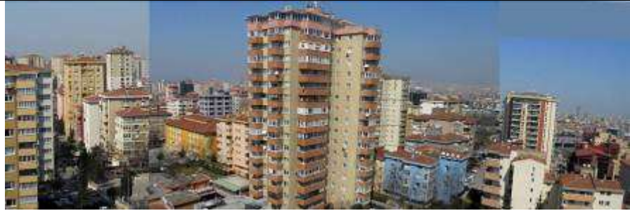
Mahallenin üst kotlardan genel görünümü. Foto: İ. Eren, 2011

Büyükük bilgisi kaynak: http://sehirrehberi.ibb.gov.tr/map.aspx . [Erişim tarihi: Ocak 2012]