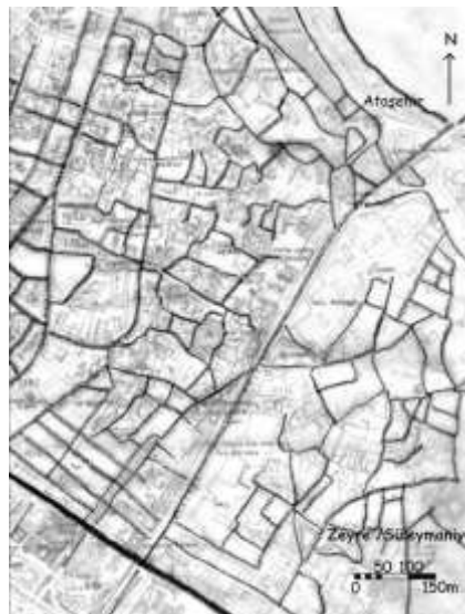
1/5000 ölçekli Zeyrek Mahalle dokusunu anlatan plan. (Güncel belediye haritalarından ve 1933 tarihli Pervitüch haritalarından üretilmiştir.)

www.tuik.gov.tr [Erişim tarihi: Ocak 2012]