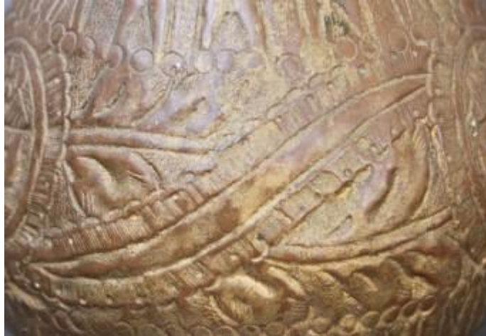
Resim 4: Gülabdan üzerine işlenen yaprak motiflerinin görünüşü