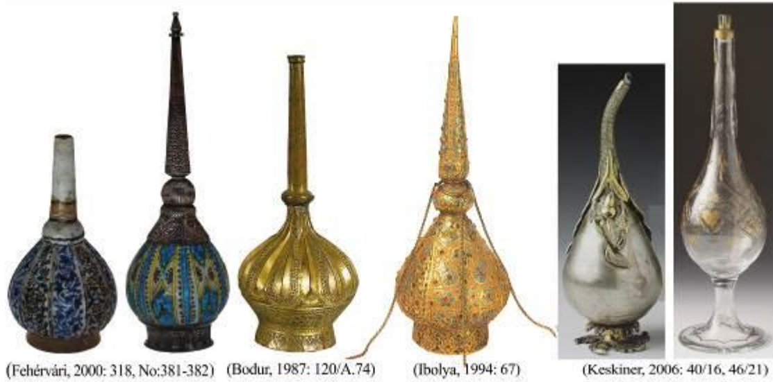
Resim 6: Çeşitli malzemelerden yapılan gülabdan örnekleri