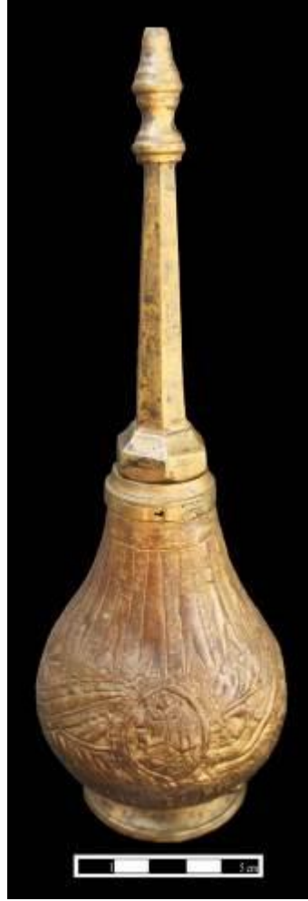
Resim 3: Muğla Müzesi'nde bulunan mimari tasvirli gülabdanın görünüşü