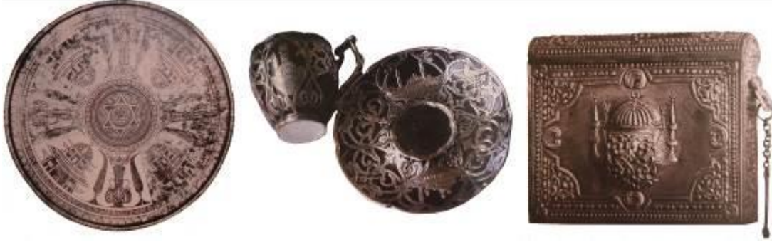
Resim 8: Mimari tasvirli süslemenin yer aldığı maden sanatına ait örnekler (Kuşoğlu, 2000: 122, 64, 106)