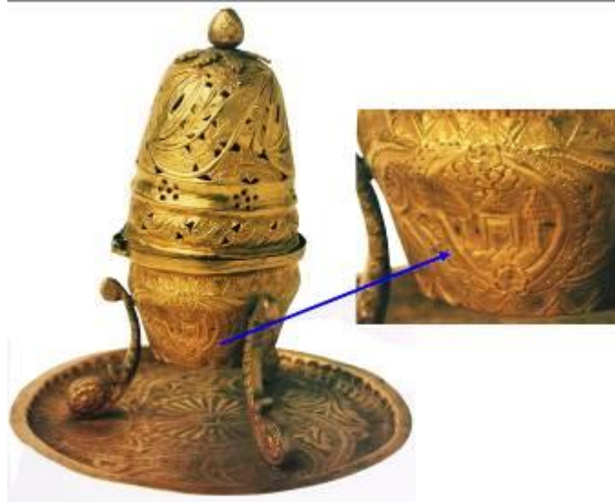
Resim 9: 19. yüzyılın ortalarına tarihlenen mimari tasvirli buhur dan ve buhur dandan detay (Eruz, 1993: 58-59)