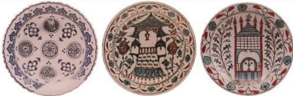
Resim 7: Mimari tasvirli seramiklerden örnekler (Bilgi, 2009: 344, 430-431)