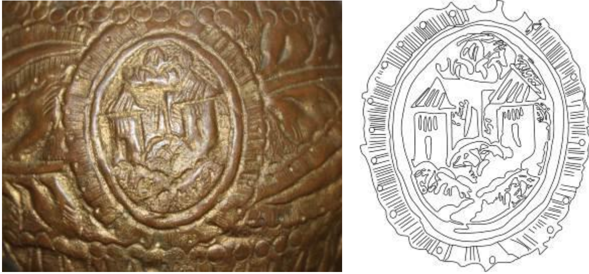
Resim 5/Çizim 1: Gülabdan üzerine işlenen mimari tasvirli madalyonlardan birinin görünüşü ve çizimi