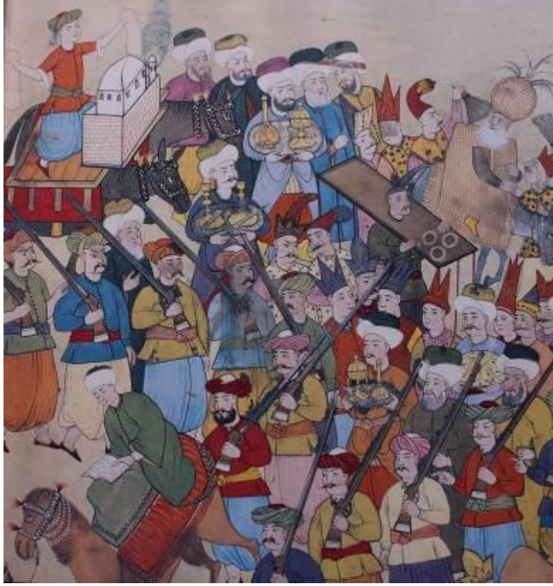
Resim 1: Sûrnâme-i Vehbi'deki 72a varağında gülabdan tasvirlerine yer verilen minyatür (Atıl,1999,99)