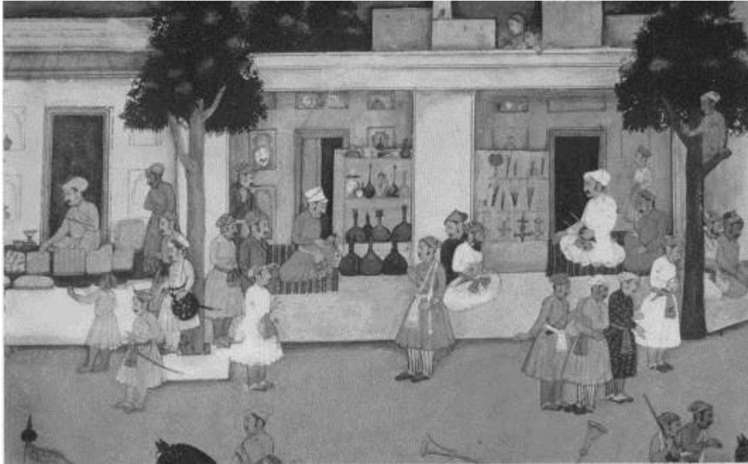
Resim 2: Howard Hodgkin Koleksiyonu'ndaki 1700'lere ait bir resimde, dükkânların vitrinlerinde sergilenen çeşitli el sanatları örnekleri arasında gülabdanların görünüşü (Digby 1973: 85, plate III)