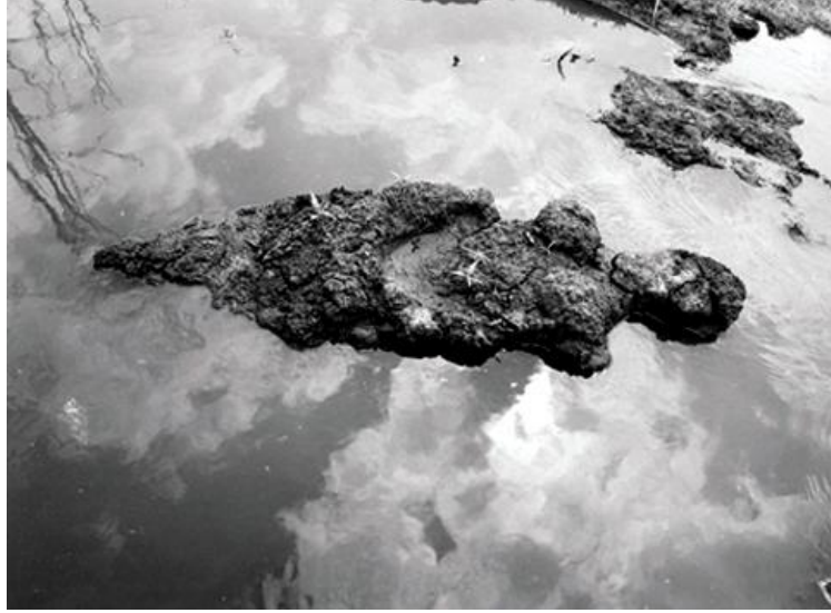
Resim 10: Ana Mendieta, Sikreta Seriesi

Beden sanatının o dönemde dışlanması kaçınılmaz olsa da günümüzde artık eleştirmenlerin kendi görüşlerinin bireysel olduğunu kabul etmeleri gerekmektedir.