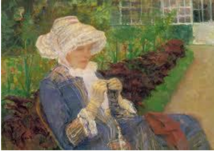
Resim 6: Mary Cassatt, "Bahçede Dikiş Diken Lydia", 1880, Metropolitan Müzesi NY

Oysa Cassatt'ın resimlerinde olduğu gibi kadın ressamlar resimlerine kadının kuşatılmışlık, sınırlandırılmışlık, hapsedilmişlik, çocuk bakış açısı gibi his ve düşünceleri yansıtmakta ya da doğal haliyle resmetmektedir ki bu da modernist bakış açısından bakıldığında kabul gören bir tarz değildir.