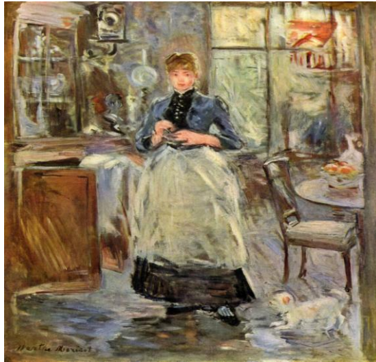
Resim 5: Berthe Morisot, "The Dining Room", 1886, National Gallery of Art Washington

Oysa 19. yuzyıl sonlarında yanlarında eřleri ya da bir bayan nezaret etmeden sokaęa ıkması hoř grlmemektedir. Bu nedenle Cassatt ya da Morisot gibi kadın ressamlar resimlerinde daha ok oturma odası, balkon, bahe, yatak odası ya da banyo gibi ev ii mekanları resmedebilmiřlerdir.