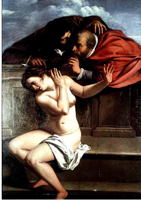
Resim 3: Artemisia Gentileschi, "Susanna İle İki İhtiyar", 1610, Schonborn Koleksiyonu

Kaynak: Hisse.net, Ünlü Sanat Eseri Resimler, http://www.hisse.net/forum/showthread.php?t=8432&page=485 , (30.6.2014).