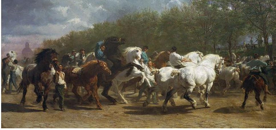
Resim 2: Rosa BonHeur, "At Panayırı", NY Metropolitan Müzesi,