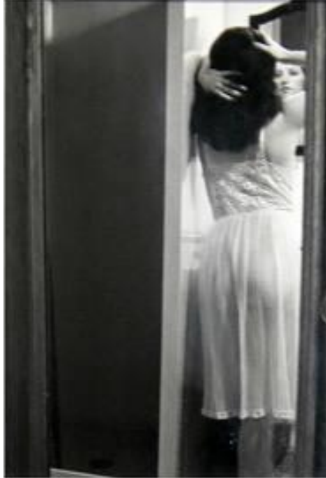
Resim 8: Cindy Sherman, Untitled Film Stills

Laura Mulvey makalesinde görsel olanın nesnesi ya da öznesi olmanın ne anlama geldiği üzerinde durur. Bu çalışmaların ortak noktası cinsiyet odaklı ayrımcı bakışları görünür kılmaktan öte sorgulayıcı bir eleştirel tavrı yöntem olarak benimsemektir.