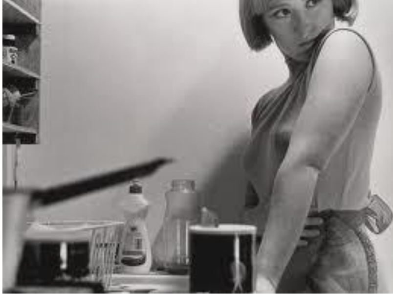
Resim 9: Cindy Sherman, Untitled Film Stills

buna göre inşa edilir. Bir kadının çekici olduğunu vurgulamanın çok ötesine giden sinema, kadına gösterinin içinde nasıl bakılacağını toplumsal olarak inşa eder.