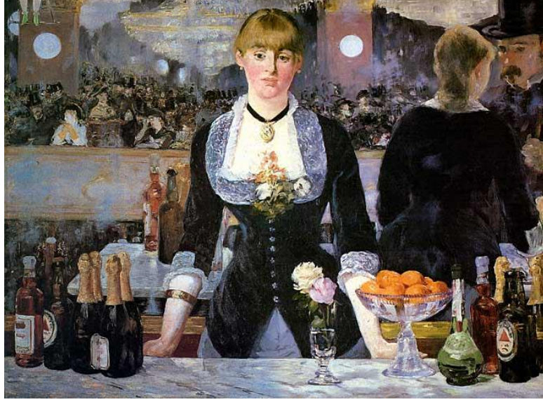
Resim 4: Eduard Manet, "Folies-Bergere de Paris", 1882, Courtauld Koleksiyonu

Oysa 19. yuzyıl sonlarında yanlarında eřleri ya da bir bayan nezaret etmeden sokaęa ıkması hoř grlmemektedir. Bu nedenle Cassatt ya da Morisot gibi kadın ressamlar resimlerinde daha ok oturma odası, balkon, bahe, yatak odası ya da banyo gibi ev ii mekanları resmedebilmiřlerdir.