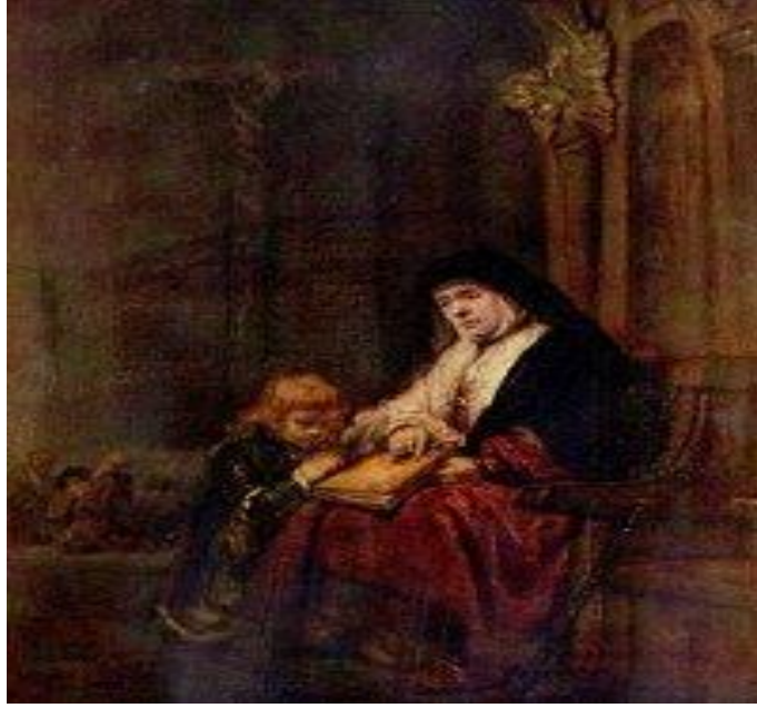
Rembrandt'ın çizdiği Lystralı Çocuk Timoteyus

( http://cursillos.ca/action/st-paul/paul21-iconium.htm )