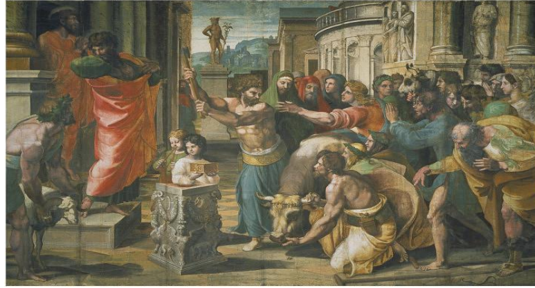
Raphael'in çizdiği Lystra'daki Kurban Töreni

insanız, aynı yaradılışa sahibiz. Size müjde getiriyoruz. Sizi bu boş şeylerden vazgeçmeye, göğü, yeri, denizi ve bunların içindekilerin hepsini yaratmış olan, yaşayan Tanrı'ya dönmeye çağırıyoruz. Geçmiş çağlarda Tanrı, tüm ulusların kendi yollarından gitmelerine izin verdi. Yine de kendini tanıksız bırakmış değildir. Size iyilik ediyor. Gökten yağmur yağdırıyor, çeşitli ürünleriyle mevsimleri düzenliyor, sizi yiyecekle doyurup yüreklerinizi sevinçle dolduruyor. Bu sözlerle bile halkın kendilerine kurban sunmasını güçlükle engelleyebildiler.” ( http://www.incil.com/doc/incil_html/frame1.html ).