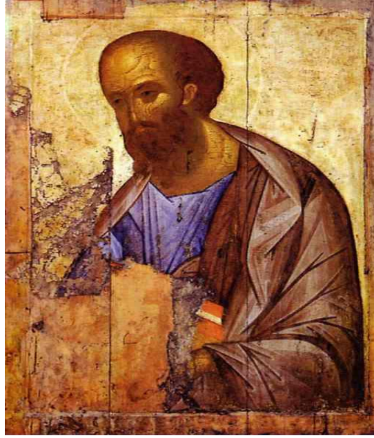
Anadolu Havarisi olarak tanınan Aziz Paul (MS 5-67)

Aziz Pierre ile birlikte erken dönem Hıristiyan misyonerlerinin en ünlüsü ve hatta en etkilisi olarak kabul edilen Aziz Paul'un doğum yeri olan ve aynı zamanda yaptığı tüm yolculuklarda uğradığı, ilk Hıristiyanlık topluluklarını oluşturduğu yerleşimlerin büyük bölümü Türkiye sınırları içerisinde bulunmaktadır. Hıristiyanlığın Kudüs'ten Anadolu'ya buradan da Avrupa'nın içlerine yayılmasında en büyük pay kuşkusuz Aziz Paul'undur. Günümüzde en modern ulaşım araçlarıyla bile uzun zaman alan yolları, karşılaştığı birçok zorluğa rağmen takip etmekten vazgeçmemiş, Hz. İsa'nın öğretilerini gece gündüz demeden korkusuzca yaymış, Roma'nın aşırı tepkisine ve sonunda ölüme gidecek kaderini bilmesine rağmen yolunu terk etmemiştir. Suriye, Kıbrıs ve Yunanistan'da da yolculuklar yapmışsa de kuşkusuz en çok vakit geçirdiği ve öğretilerini yaydığı, en güney ucundan en batısına kadar neredeyse tamamını dolaştığı yer Türkiye'dir( http://www.ispartakulturturizm ).