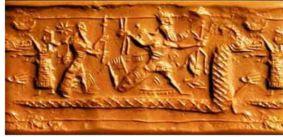
Resim 2: Taimat ile Marduk'un mücadelesi

Krallığın evrensel gücünü, yani sadece tanrılar katında değil tüm evrendeki yetkiyi kendi elinde toplayan Marduk, Taimat'ı ve beraberindekileri mağlup etmiş, yeryüzünü ve en sonunda insanı yaratmıştır. “Krallığın evrensel gücü” tanımlaması ile Sami kökenli Mezopotamya krallarının kullandığı “dört yönün kralı, dört mevsimin kralı” unvanı oldukça benzemektedir. Burada dört yön ve mevsim ile ifade edilmek istenen zamana ve mekâna hükmetmektir. Zaman ebedi, mekân ise evrendir. Marduk tanrılar katında kral olarak başa geçmiş, diğer tanrılara da bir takım görevler bahşederek dini bürokrasiyi oluşturmuştur. Yeryüzünde ise bunu tanrıların temsilcisi olan krallar yapmışlardır.