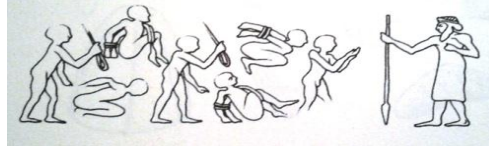
Resim 1: En sağda sakallı görüntüsü ile diğerlerinden ayrılan bey ya da rahip

Diğer taraftan Mezopotamya'da, Sümerliler döneminde gücün merkezinin tapınak olması bize yönetimin din ile yakınlığı hakkında fikir verse de, yani tapınak merkezli yönetim teokrasiyi çağırırsa da ilksel faktörün ne olduğu hala tartışmalıdır. Bu sebeple Sümer idari sistemini tamamen dini gerekçelere bağlamak eksik veya yanlış olacaktır. Bilindiği üzere bu mekânlarda yalnızca dini işler ile ilgilenilmeyip, kentin siyasi ve ekonomik durumu da buradan kontrol altında tutulmaktaydı. Nitekim Sümer kentlerinde en yüksek devlet memuru olan ve “En” unvanını taşıyan kralın asli görevi, tapınağı ve ekonomiyi tanrı adına yönetmekti. Dolayısıyla buradaki yöneticinin “rahip kral” olarak tanımlanması hiç de yanlış değildir. Bu rahip kralın, toplum içerisindeki konumu sanat eserlerindeki betimlemelere bile yansımıştır. Nitekim Uruk kentinde yapılan kazılarda çıkarılan mühürlerde, kral mühür üzerinde betimlenen diğer kişilerden fiziki görüntüsü ile farklı bir şekilde resmedilmektedir, böylece onun “egemen güç” olduğu vurgulanmaktadır 4 .