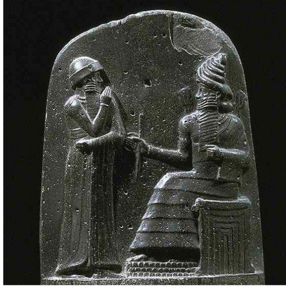
Resim 5 Şamaş ile göz kontağı kuran Hammurabi