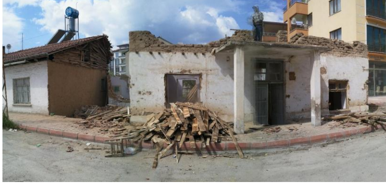
Foto-2: Yıkılmakta Olan Eski Bir Malatya Evi (Kerpiç ve Ahşaptan İnşa Edilmiş)

Kayseri, Konya, Nevşehir, Malatya, Gaziantep, Diyarbakır gibi kentler bağ evleri ile tanınan iller arasında gelmektedir (Ankara the BEST, 2008:141-142). Malatya'nın yerel dokusunun mimari açıdan simgeleri olarak niteleyebileceğimiz geleneksel Malatya evlerinin gün geçtikçe modern yapılara yenik düştüğü görülmektedir. Çoğu bakımsız olan bu geleneksel evler (Bakınız: Foto-2) yıkılarak yerine günümüz kent yaşamına özgü yeni binalar yapılmaktadır.