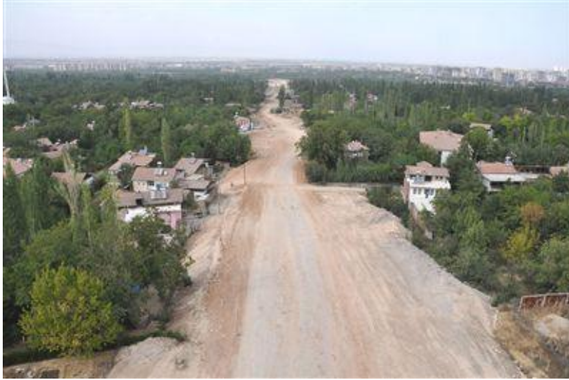
Foto-4: Tecde-MAŞTİ arasında yapılacak bulvar inşaatı için istimlak edilen alan

Tecde Mahallesi ile Malatya Şehirlerarası Terminal İşletmesi (MAŞTİ) arasında inşa edilecek 50 metre genişliğindeki ve 1500 metre uzunluğundaki bulvar için Malatya Belediyesi tarafından 18'i ev olmak üzere toplam 50 parselde istimlak çalışması yapılmıştır (Bakınız: Foto-4). Malatya Belediyesi yaptığı açıklamada, alt merkez olma çerçevesinde Fahri Kayahan-Çilesiz bölgesindeki yapılaşmanın yoğun bir şekilde sürdürüldüğünü belirtmektedir (haberler.com, 2013).