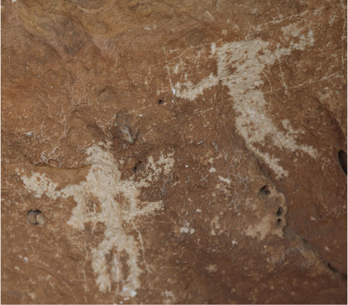
Resim 11: Berha Çemika (Dereler Mağarası)'nda yer alan ve okla vurulan bir savaşçı figürü. Oku atan savaşçının kollarının gergin olduğu ve oku yeni fırlattığı görülüyor. Yüzü öne doğru eğilen savaşçının simasında ekspresif bir ifade var. Resmin renkli boyalardan sonraki dönemde çizildiği anlaşılmaktadır.