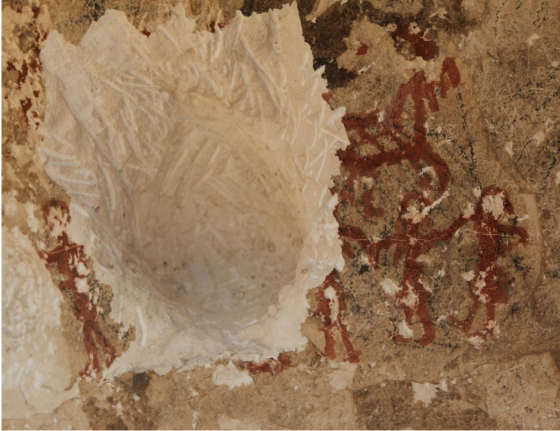
Resim 9: Berha Nivisandi (Yazılı Mağara)'daki tahrip edilmiş bu resimde şenlik sahnesi açık olarak görülebiliyor. Erkek ve kız dansçılar bugünkü halaya benzeyen bir dans yapıyorlar. İnsan figürleri elbiseleriyle birlikte tasvir edilmiş ve elbiselerinin kıvrımları vücut hatlarını ortaya koyuyor. Bu tasvirlerdeki şenliklerde evcil hayvanlar da yer alıyor. Üstte bir at tasviri yer alıyor.