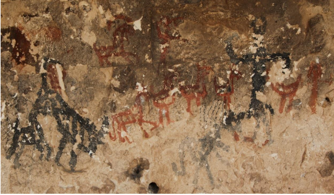
R.7: Berha Nivisandi (Yazılı Mağara)'da evcil ve yırtıcı hayvanların birlikte tasvir edildiği bir sahne. Çeşitli kuşlar, atlar, yaban dağ keçisi (bezuvar) ve iki hayvanın döğüşü. Siyah boyayla çizilen resimler daha önceki bir döneme ait. Kırmızı boyayla çizilen resimler daha sonraki bir dönemde eklenmiş olabilir. Hayvan mücadelesinde hayvanlardan birinin sırtına bir kuş resmi çizilmiş olarak görülmektedir.