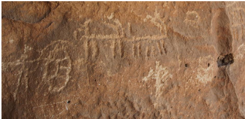
Resim 13: Berha Çemika (Dereler Mağarası)'ndaki kayalara çizilmiş çeşitli insan ve hayvan figürleri.