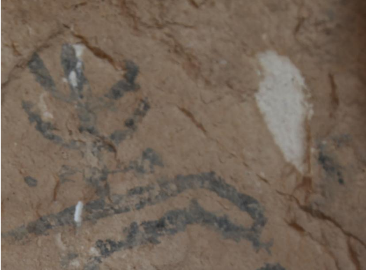
Resim 4: Berha Nivisandi (Yazılı Mağara)'daki Ağaç figürü. Resimde mekân fikri vardır. Deraser kaya resimlerinde mekân fikrinin yansıtıldığı tek resim.