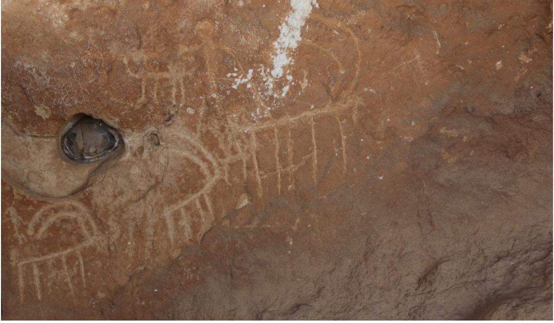
Resim 12: Berha Çemika (Dereler Mağarası)'ndaki çeşitli insan ve hayvan figürleri.