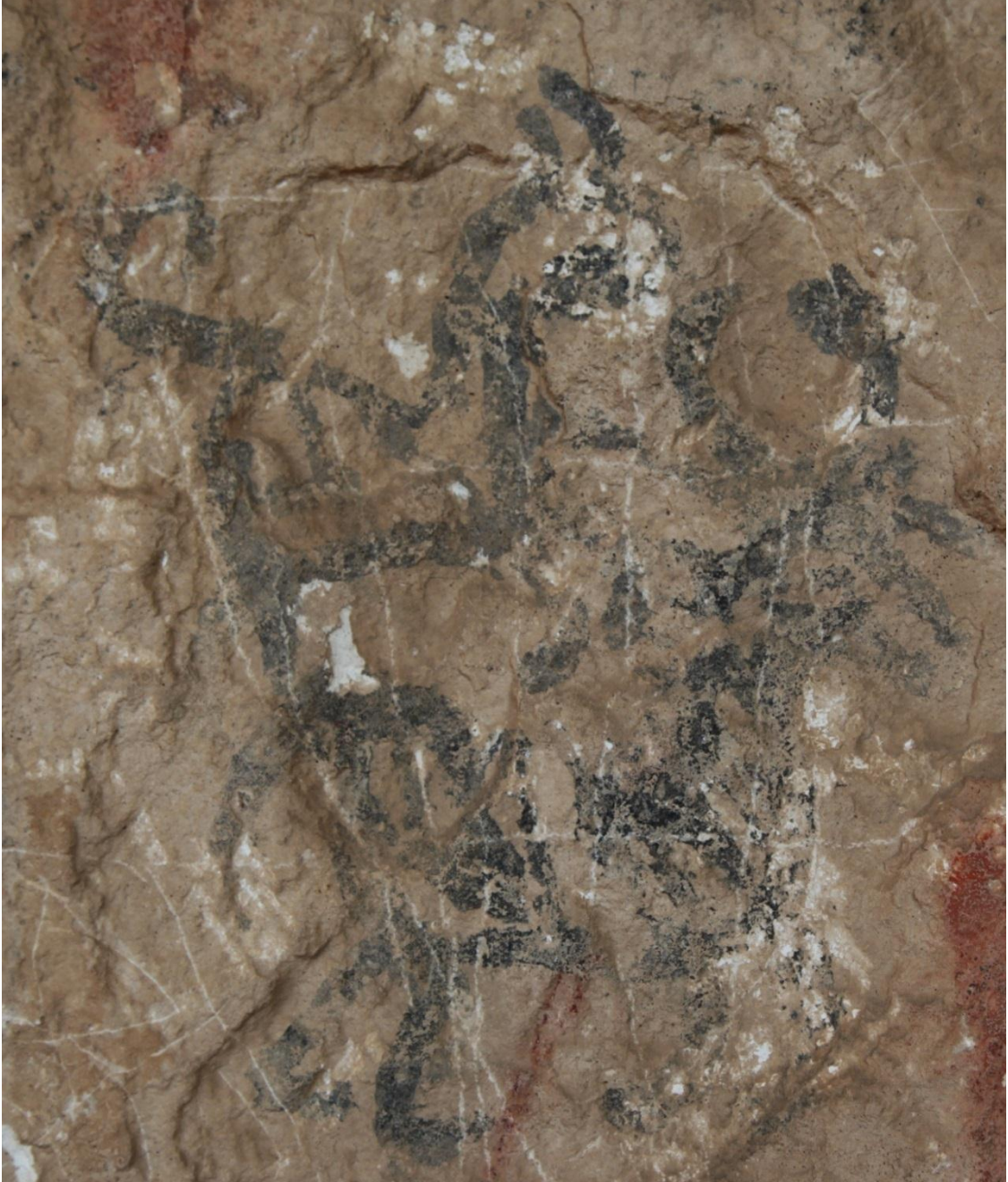
Resim 6: Berha Nivisandi (Yazılı Mağara)'daki boynuzlu hayvan figürleri.