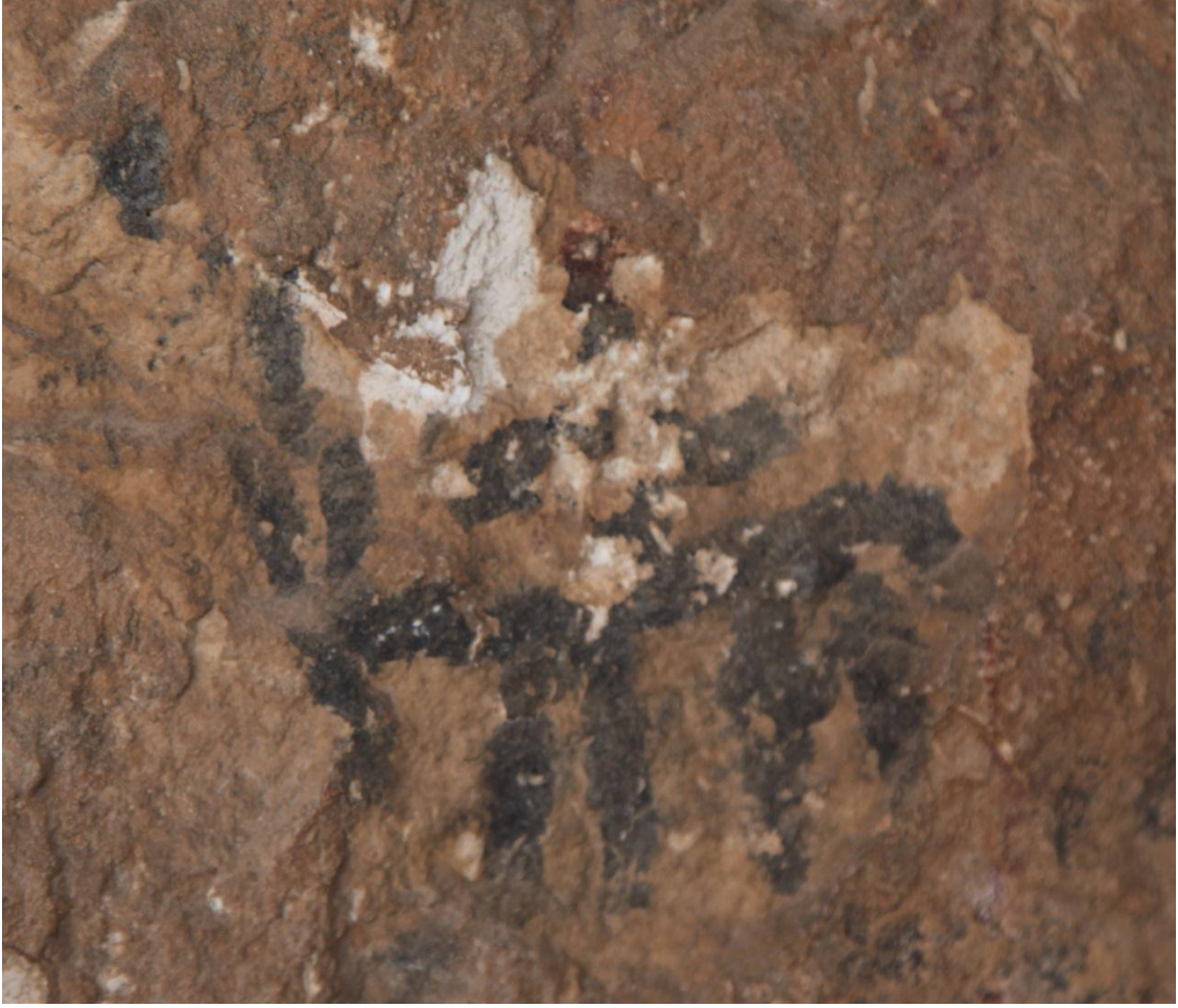
Resim 8: Berha Nivisandi (Yazılı Mağara)'da ata binmiş bir savaşçı figürü.