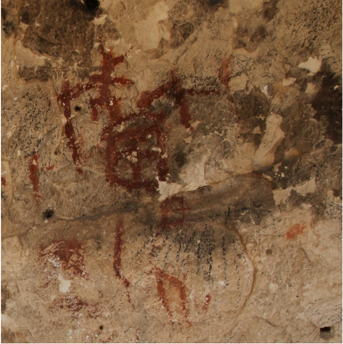
R.10: Resimde çeşitli insan ve nesne figürleri bulunmaktadır. İnsan figürlerinin bir hareket içinde oldukları açıkça görülebilmektedir.