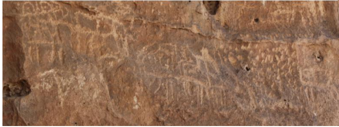
Resim 15: Berha Çemika (Dereler Mağarası)'ndaki savaşan askerler (sağ üstte), çeşitli yabani ve evcil hayvan figürleri.