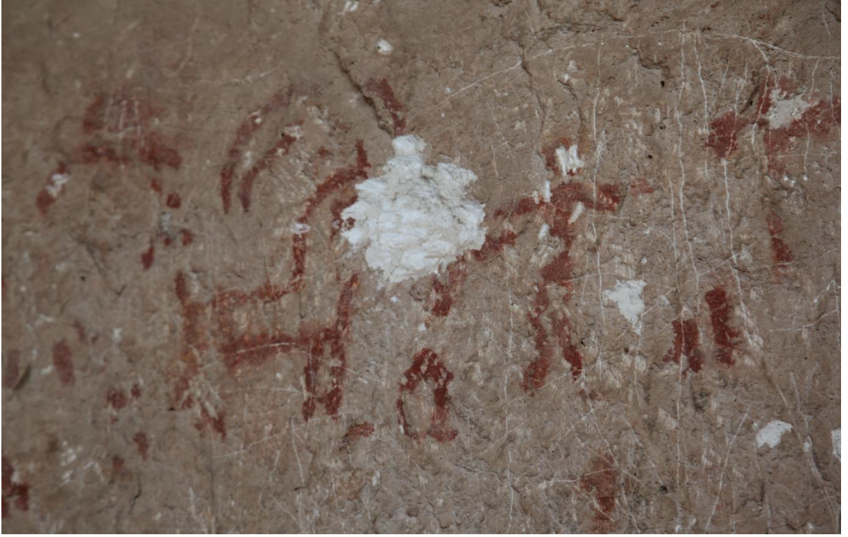
Resim 5: Berha Nivisandi (Yazılı Mağara)'daki bir av sahnesi tasviri. Şekilde yaban dağ keçisi (bezuvar) görülmektedir.