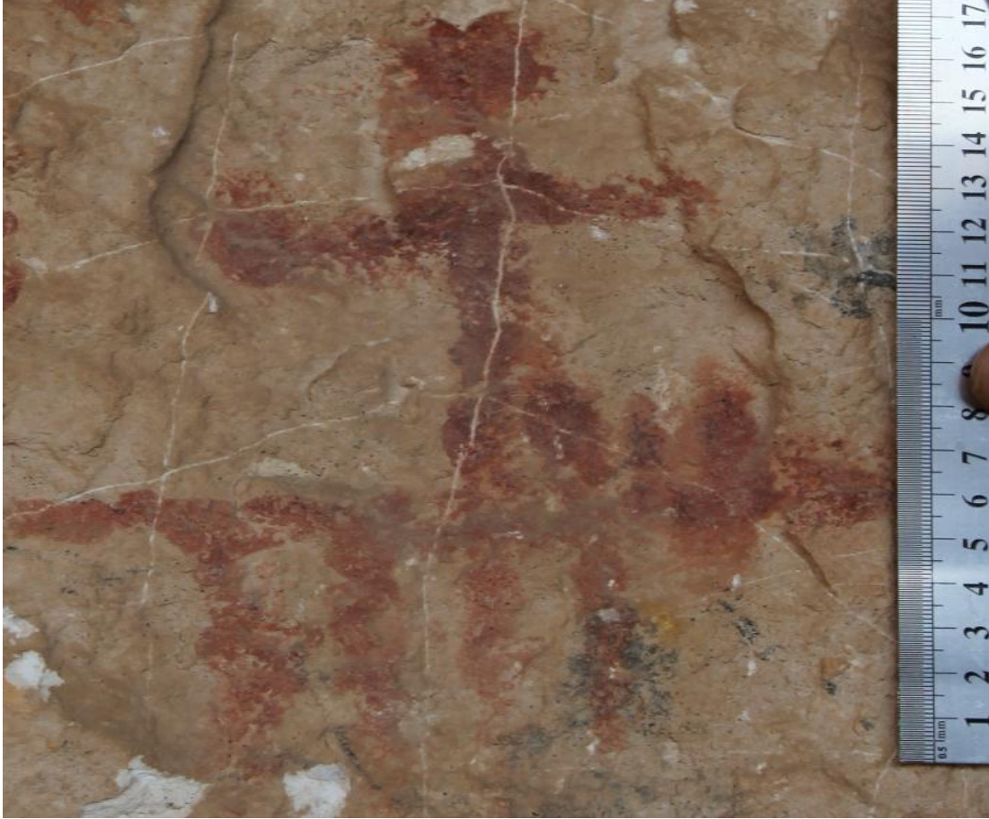
Resim 1: Berha Nivisandi (Yazılı Mağara)'daki At üstündeki bir savaşçı figürü. Savaşçının kollarından biri gergin duruyor