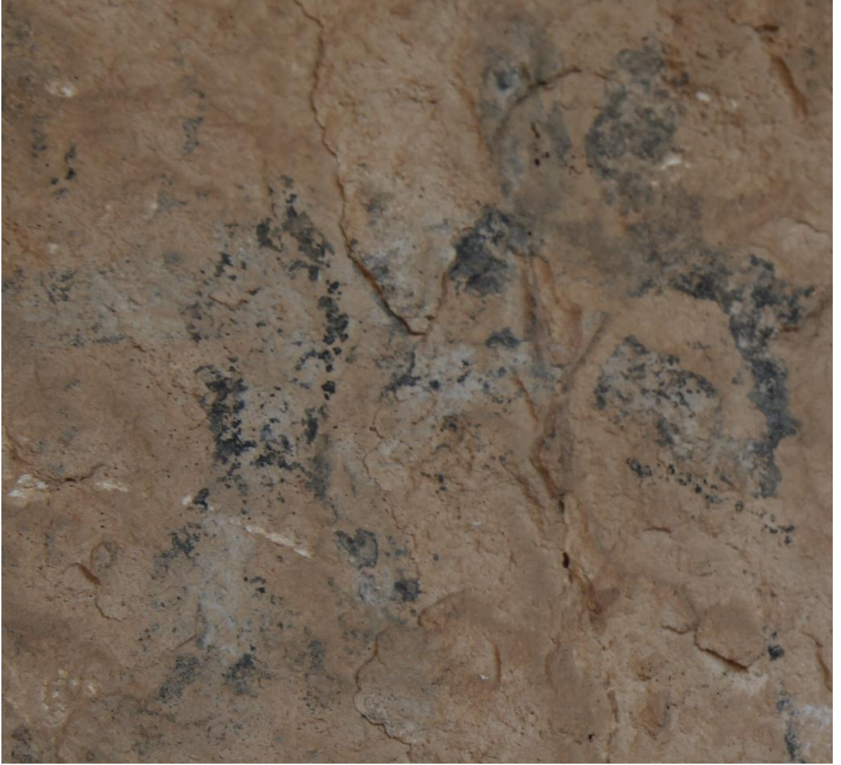
Resim 2: Yer yer silinmesine rağmen Berha Nivisandi (Yazılı Mağara)'daki bu resimde iki hayvanın mücadelesi görülüyor.