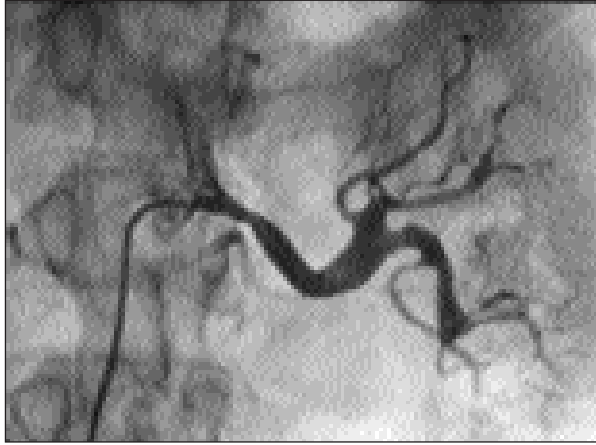
Resim 1. Sol renal artere stent konulmadan önce.