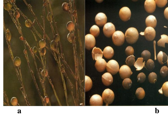
Şekil 2. a) Crambe tohumlarının küme şeklindeki görünümü, b) meyve kabuğu ve tohumun genel görünüşü (Schuster, 1992).