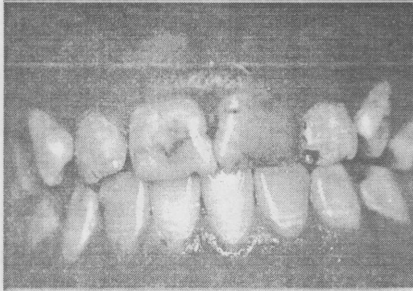
Resim 1: 02 nolu dişlerdeki tetrasiklin renklenmesi.

3 ay, 6 ay, 1 yıllık kontrollerde yapılan değerlendirmelerde tutuculuk, yumuşak doku uyumu ve periodontal sağlığın uyumlu olduğu gözlemlendi.