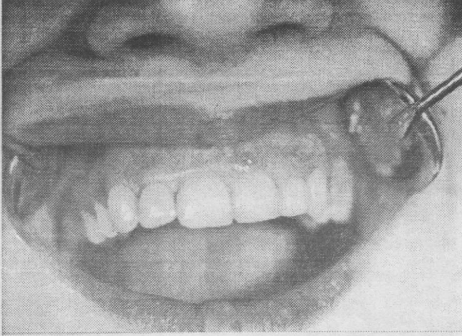
Resim 3: Laminate veneerlerin ağız içinde görünümü.