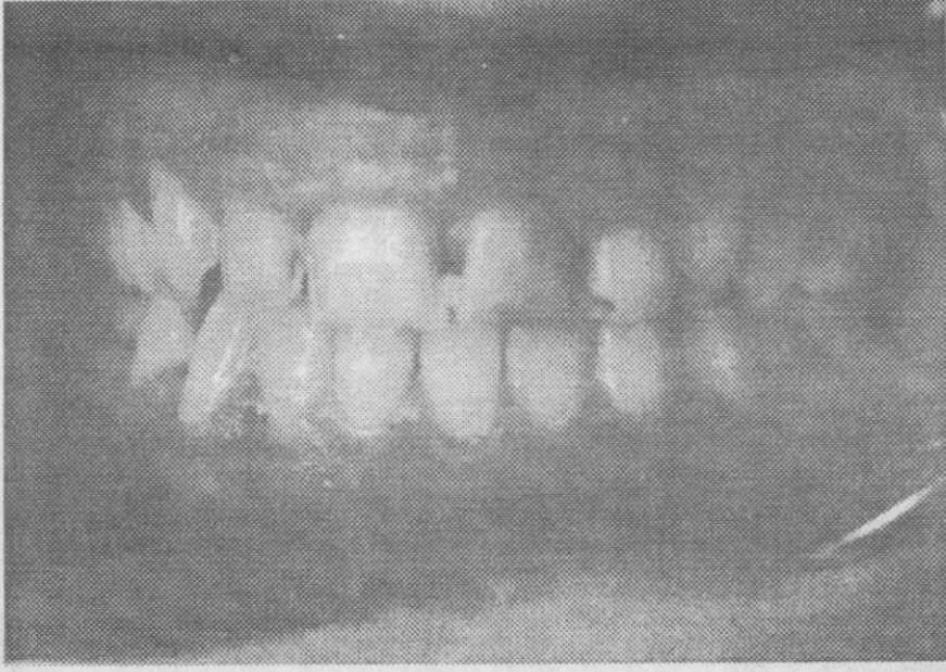
Resim 2: Ön dişlerdeki laminate veneer preparasyonları.