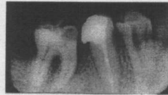
Resim 1. Alt 5 nolu dişte taşkın dolgu yüzünden oluşmuş alveolar kemik kaybı