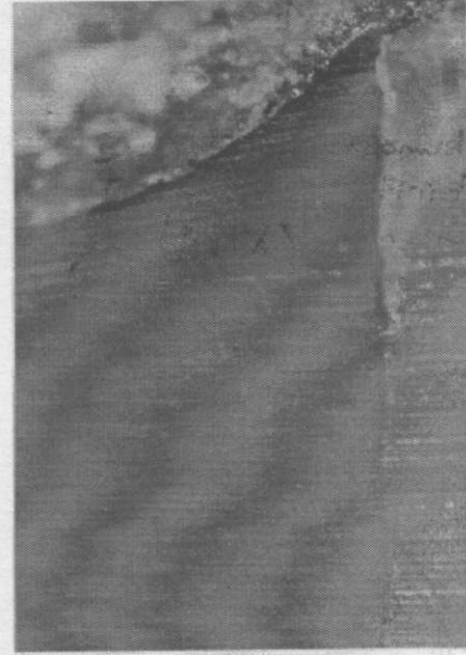
Resim 5. Vitremer grubundan bir örnek Sızıntı yok. (x40)