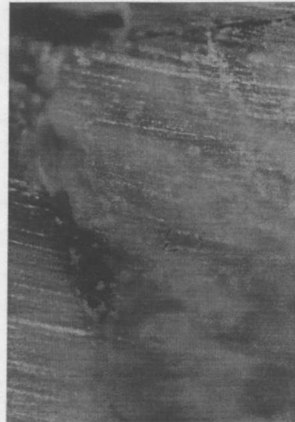
Resim 1: Argion grubundan bir örnek ikinci derece sızıntı (x 40)