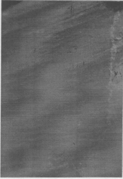
Resim 6: Dyract grubundan bir örnek (Sızıntı yok) (x40)