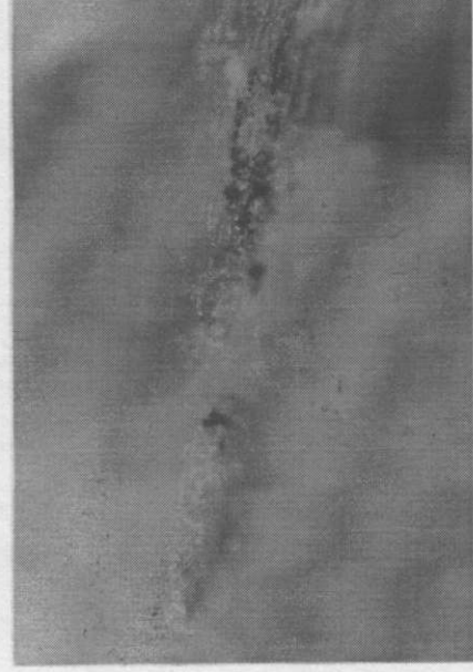
Resim 4. Vitremer grubundan bir örnek Birinci derece sızıntı (x40)