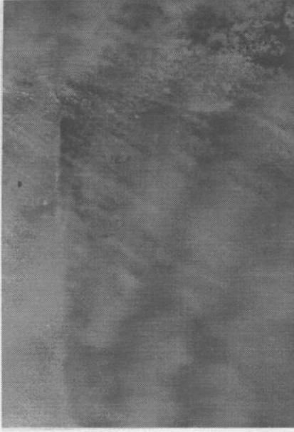
Resim 2. Clearfil AP-X grubundan bir örnek Sızıntı yok. (x40)