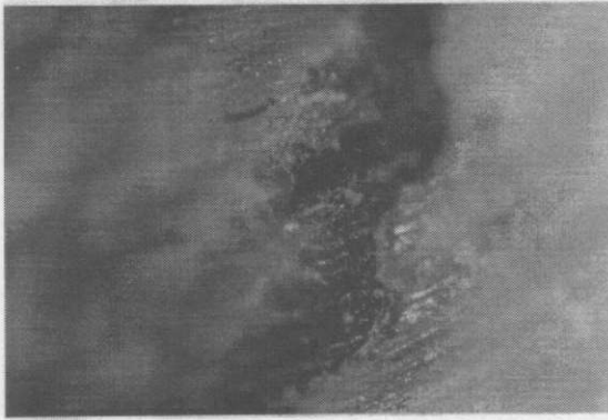
Resim 3. Clearfil AP-X grubundan bir örnek Üçüncü derece sızıntı (x40)