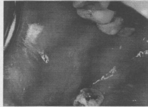
Resim 3. Olgumuzun ağız içi görünümü.

Hasta dabili yönden de muayene edildi ve AKŞ, hemoglobin, hematokrit, eritrosit, formül lökosit, SGPT, SGOT, alkalifosfataz, serum ve tükürük IgA tetkikleri yapıldı. Bütün tetkiklerin normal sınırlar içinde olduğu, tükürük IgA seviyesinin ise alt sınırdan bulunduğu saptandı.