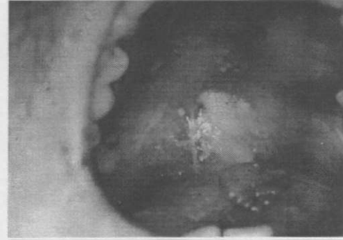
Resim 2. Olgumuzun ağız içi görünümü.