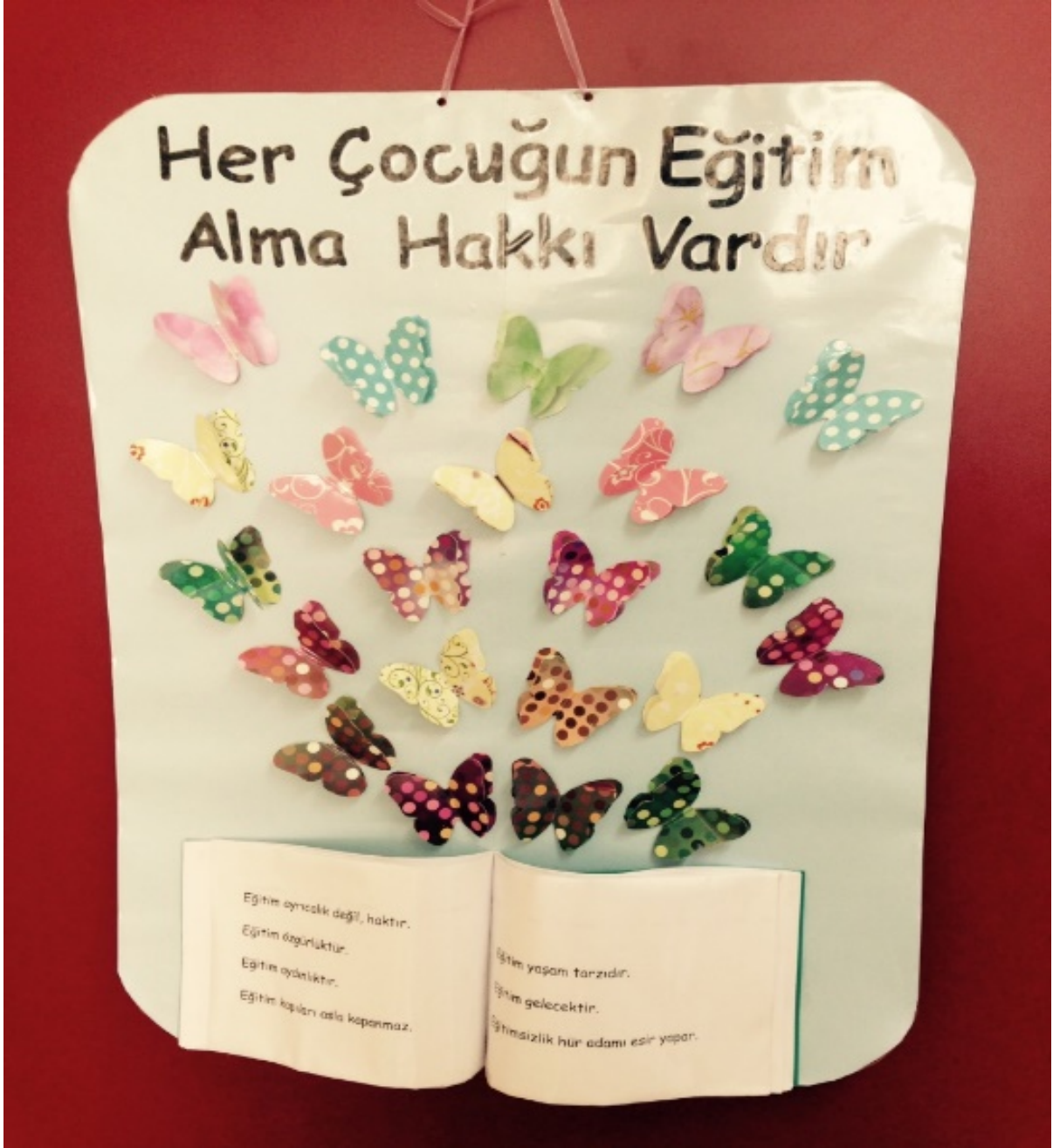
Fotoğraf 8: Çocuk Haklarına Dair Birleşmiş Milletler Sözleşmesi'nin 28.Maddesi ile İlgili Bir Pano Tasarımı

Panoda Madde 2 ele alınmıştır. Bu maddeye göre “Çocuk Hakları, bütün çocuklar içindir. Doğum yerleri, konuştukları dil ne olursa olsun fark etmez. Büyüklerinin inançları ya da görüşleri nedeniyle hiçbir çocuğa ayırım yapılamaz”. Bu tasarımda farklı milletlerden çocuk figürleri kullanılmış ve bu çocuklar özellikle yer değiştirebilecek biçimde hazırlanmıştır. Maddenin ana fikrinden hareketle milletlerin bir öneminin olmadığı çocuklar arasında bir farkın olmadığı betimlenmeye çalışılmıştır. Pano, mukavvayla dayanıklılığı artırılan dünya haritası yapışkanlı asetatla kaplanmıştır. Hazır olarak çıkartılan farklı milletlerden çocuk figürleri ise yuvarlak bir eva kâğıdının üzerine yapıştırılarak asetatlanmıştır. Aynı boyutlarda keçe kesilerek, evayla keçe birbirine dikilmiştir. Çocuk figürlerinin takılıp çıkarılabilmesi için cırt cırt kullanılmıştır. Cırt cırtın bir yüzünü panoya yapıştırılmış diğer yüzü ise keçeye dikilmiştir.