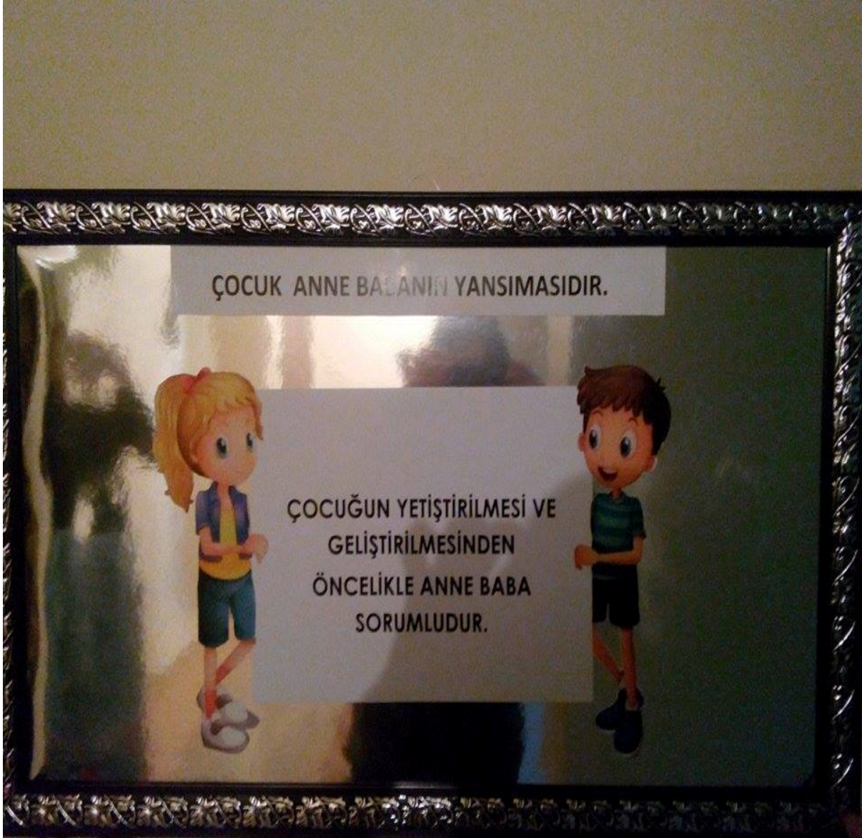
Fotoğraf 4: Çocuk Haklarına Dair Birleşmiş Milletler Sözleşmesi'nin 18.Maddesi İle İlgili Bir Pano Tasarımı

Bu panoda “Çocuğun her tür ortamda (ev, okul vb.) şiddet, istismar ve ihmale karşı korunması” olarak özetlenebilecek Madde 19 ele alınmıştır. Panoda zaman zaman eğitim kurumlarında karşılaşılabilen şiddet istismarı konu edilmiştir. Pano, mukavva, karton ve renkli evalar ile tasarlanmıştır.