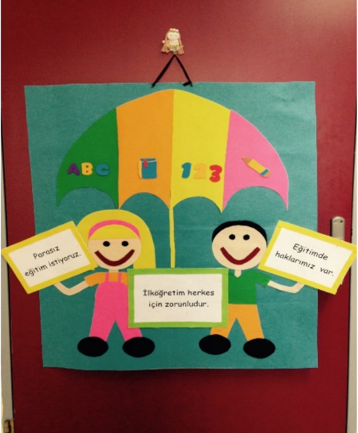
Fotoğraf 9: Çocuk Haklarına Dair Birleşmiş Milletler Sözleşmesi'nin 28.Maddesi İle İlgili Bir Pano Tasarımı

Bu panoda çocuğun eğitim hakkını detaylı bir biçimde anlatan Madde 28 ele alınmıştır. Renkli mukavva kartondan hazırlanan alt zemin üzerine defter sayfasından çıkan bilgi kelekleri yerleştirilmiştir. Kelebekler üç boyutlu tasarlanmış olup çocukları temsil etmektedir.