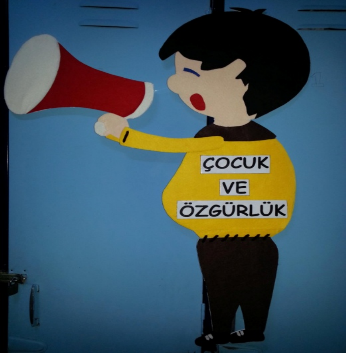
Fotođraf 2: Çocuk Haklarına Dair Birleşmiş Milletler Sözleşmesi'nin 13.Maddesi İle İlgili Bir Pano Tasarımı

"Her çocuk düşüncelerini özgürce söyleme hakkına sahiptir" ifadesinin belirtildiđi Madde 13'ü konu eden bu kapı panosu çalışmasında çocuklara düşüncelerini açıklama fırsatı verilmesine dikkat çekmek amacıyla elinde megafon olan çocuk figürüyle çalışılmıştır. Foto bloktan çıkartılan kalıp üzeri keçe ile kaplanmıştır. Pano çocuđun bel kısmından katlanabilir biçimde dizayn edilmiştir.