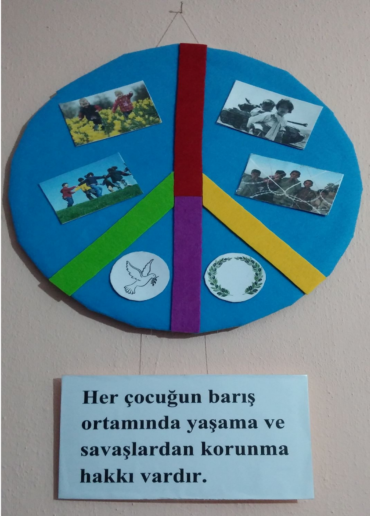
Fotođraf 6: Çocuk Haklarına Dair Birleřmiř Milletler Sözleřmesi'nin 38.Maddesi İle İlgili Bir Pano Tasarımı