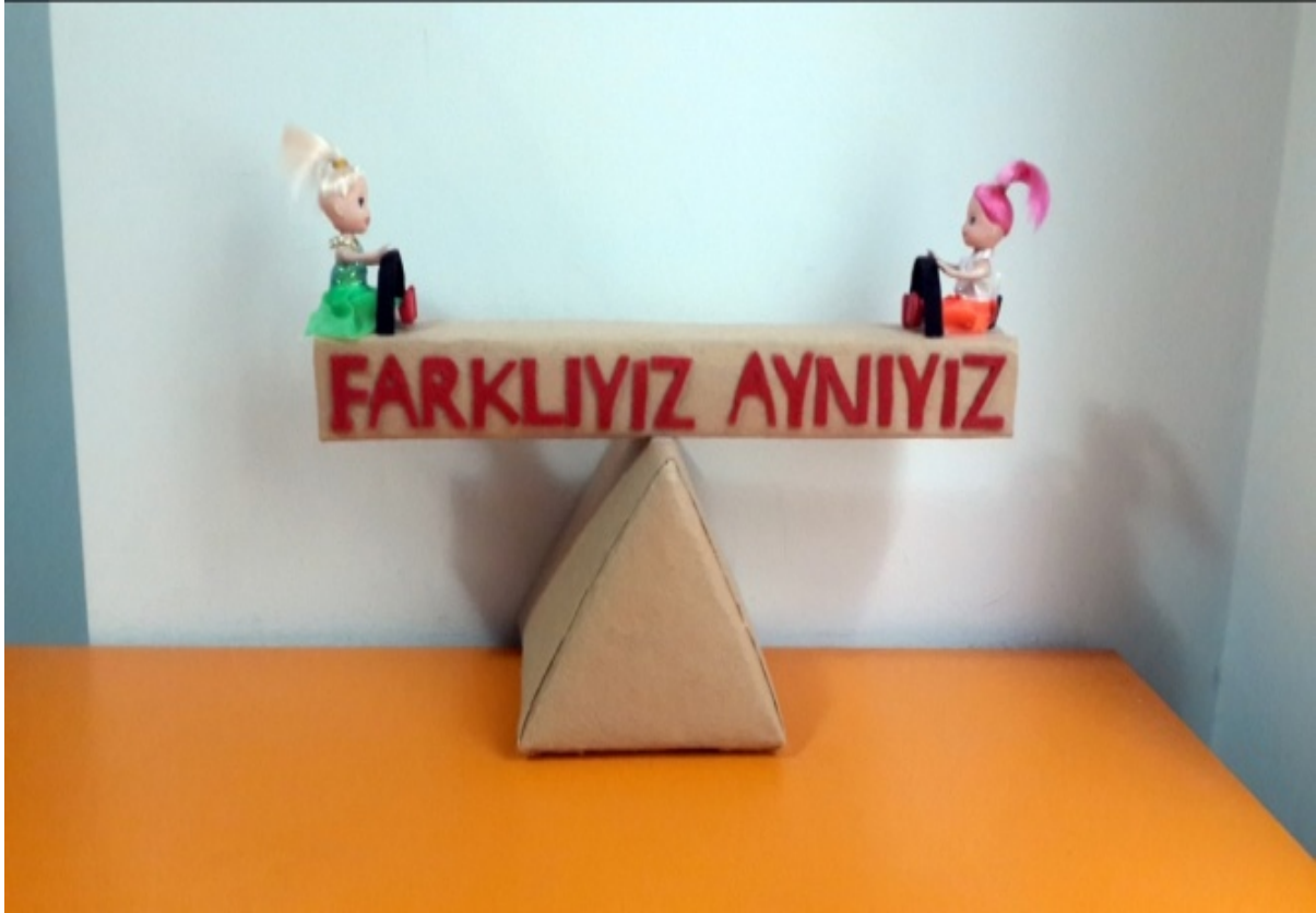
Fotoğraf 1: Çocuk Haklarına Dair Birleşmiş Milletler Sözleşmesi'nin 2.Maddesi İle İlgili Bir Pano Tasarımı

Araştırmanın amacı kapsamında, okul öncesi öğretmen adayları tarafından çocuk hakları teması kapsamında geliştirilmiş olan veli bilgilendirme panolarından seçilmiş örnekler araştırmanın bu bölümünde görselleri ile birlikte sunulmaktadır.