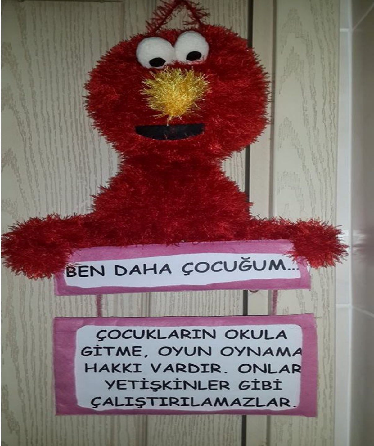
Fotoğraf 5: Çocuk Haklarına Dair Birleşmiş Milletler Sözleşmesi'nin 32.Maddesi İle İlgili Bir Pano Tasarımı

Bu panoda "Çocukların okula gitme, oyun oynama hakkı ile onların çalıştırılmalarını" ele alan Madde 32 üzerinde çalışılmıştır. Kapı panosu olarak hazırlanan bu tasarım için örgüden bir karakter yapılmıştır. Karakter tamamen hayali olup dikkat çekiciliği artırmak amacıyla kırmızı tüylü yün kullanılmıştır. Karakterin içi elyafla doldurulmuştur. Gözler beyaz polar üzerine siyah keçe dikilerek yapılmıştır. Burun sarı tüylü ipten örülmüştür. Panoda mesajın verildiği kısım için çerçeve hazırlanmış böylece pano başlığı ile mesajların değiştirilebilir olması sağlanmıştır. Mesaj mukavvaya yapıştırılmış ve dayanıklılığın artırılabilmesi için yapışkanlı asetatla kaplanmıştır.