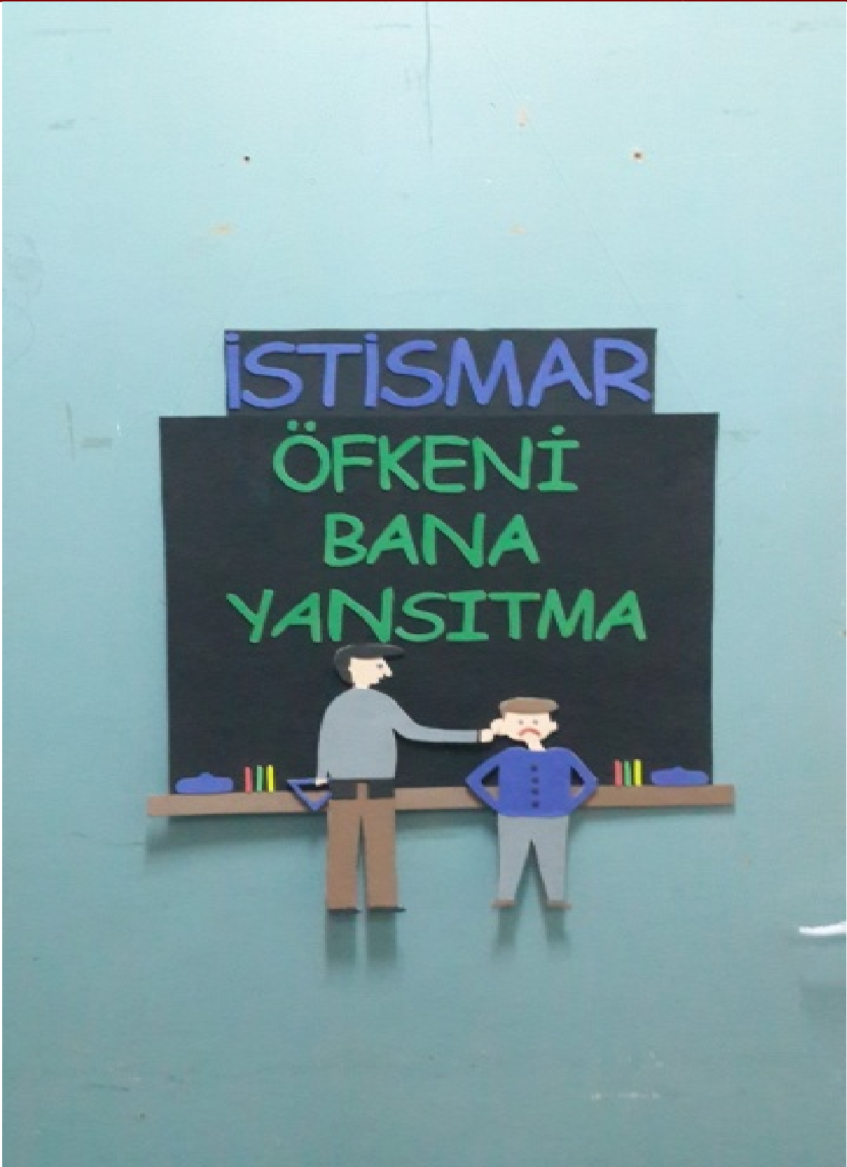
Fotođraf 3: Çocuk Haklarına Dair Birleşmiş Milletler Sözleşmesi'nin 19.Maddesi İle İlgili Bir Pano Tasarımı