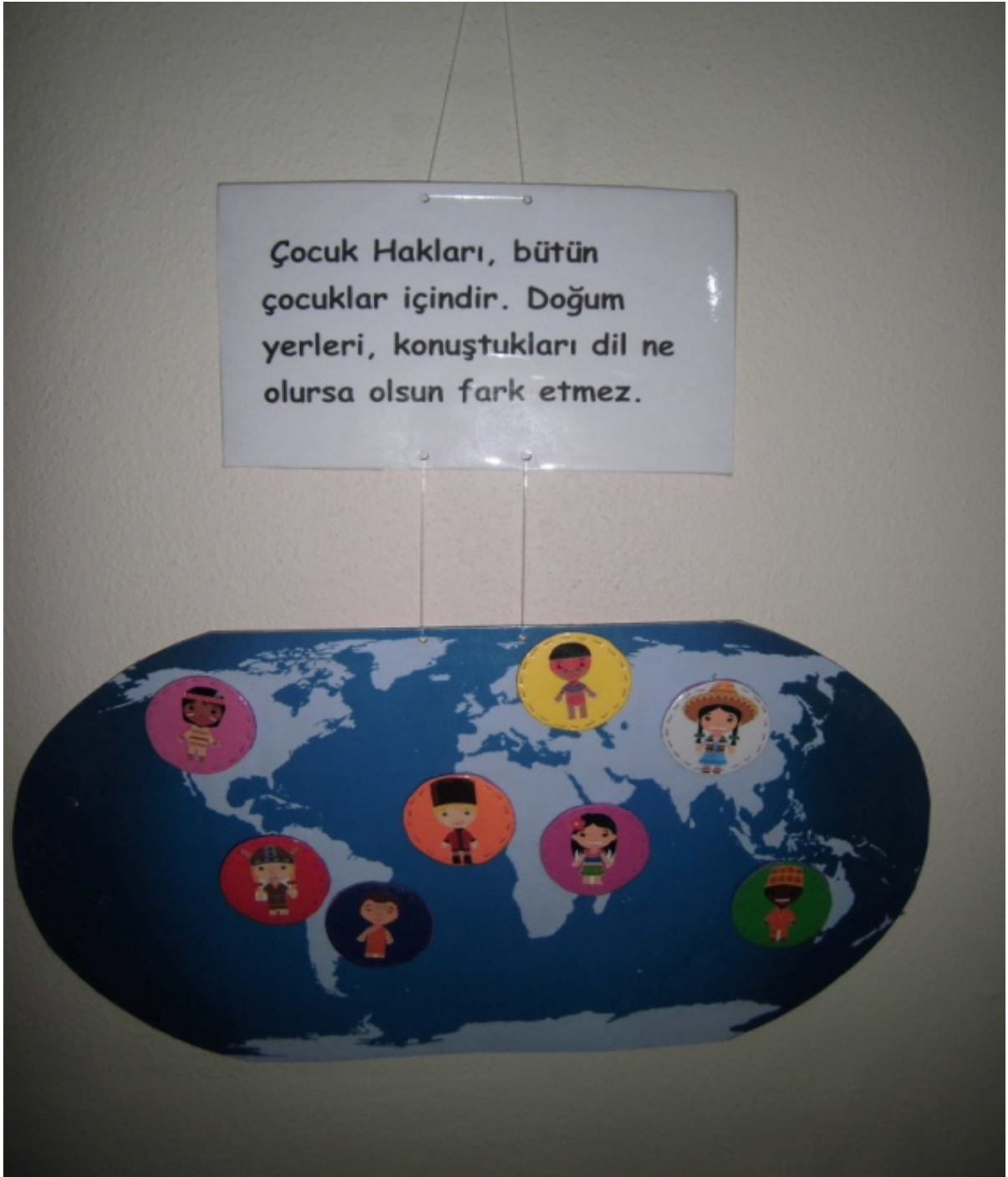
Fotoğraf 7: Çocuk Haklarına Dair Birleşmiş Milletler Sözleşmesi'nin 2.Maddesi İle İlgili Bir Pano Tasarımı

Barış işareti sembolünün kullanıldığı bu pano çalışması “Her çocuğun barış ortamında yaşama ve savaşlardan korunma hakkı vardır. Çocukların askere alınmaması gerekir. Devlet, çocukları silahlı çatışmalardan ve sonuçlarından korumakla sorumludur” ilkesini ele alan Madde 38’i konu edinmektedir. Panoda kullanılan çocuk ve savaş ortamındaki çocuk temalı fotoğraflarla velilerin çocuk ve savaşın ne kadar uzak kavramlar olduğunu görmeleri sağlanmaya çalışılmıştır. Panoda yuvarlak formda kesilen mukavva karton üzeri keçe ile kaplanmış barış işaretinin şeritleri ise farklı renklerdeki keçelerden kesilerek panoya yerleştirilmiştir.