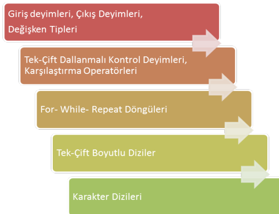
Şekil 1. Ders İçerikleri

Araştırmada nicel araştırma yaklaşımının, yarı-deneysel araştırma modeli kullanılmıştır. Bu çerçevede Öntest sontest kontrol gruplu desenden yararlanılmıştır. Grupların akademik başarılarındaki değişim; sontest puanları ve öntest-sontest fark puanları karşılaştırılarak değerlendirilirken, deney değişkeninin öğrenmenin kalıcılığındaki etkisi; kalıcılık test puanları karşılaştırılarak değerlendirilmiştir. Araştırmanın öncesinde, AK çerçevesinde öğretim stratejileri oluşturularak dersin işlenmesinde öğretim elemanına yardımcı olacak bir öğretim yazılımı hazırlanmıştır. Öğretim yazılımının içeriği beş haftalık uygulamayı kapsayacak şekilde AK 'nın ilkelerine göre tasarlanmıştır. Ders içeriği özelliklerine göre sınıflandırılarak dört bölüme ayrılmıştır. Bu dört bölüm 5 hafta boyunca işlenmiştir. Şekil 1 'de hem deney hem de kontrol grubunda işlenen 5 haftalık ders içeriği gösterilmiştir.