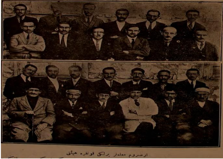
“Erzurum Muallimler Birliđi Kongre Heyeti”, Muallimler Birliđi , Teşrînisâni 1341, S.5, s. 219.