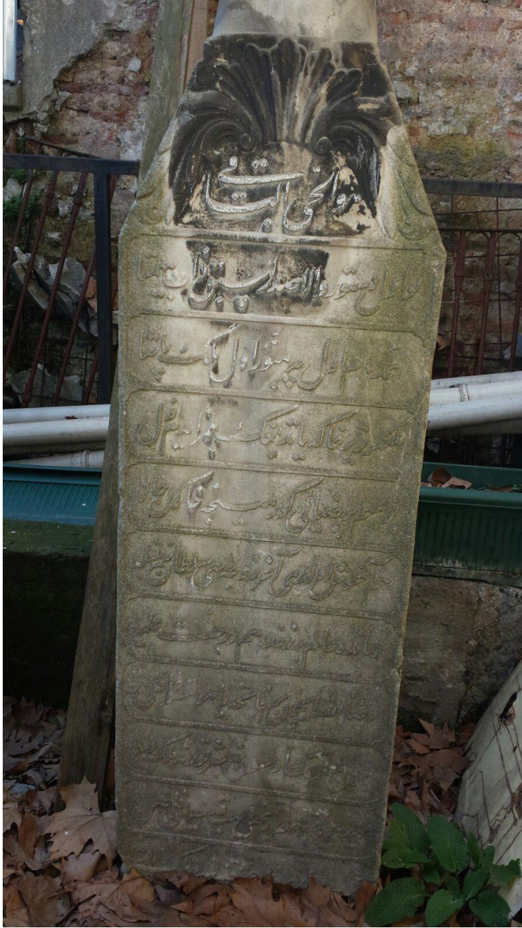
Resim 1: Melek Mehmed Paşa'nın Mezar Kitab