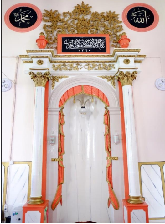
Resim 11- Irlamaz Köyü Camii. Mihrap.