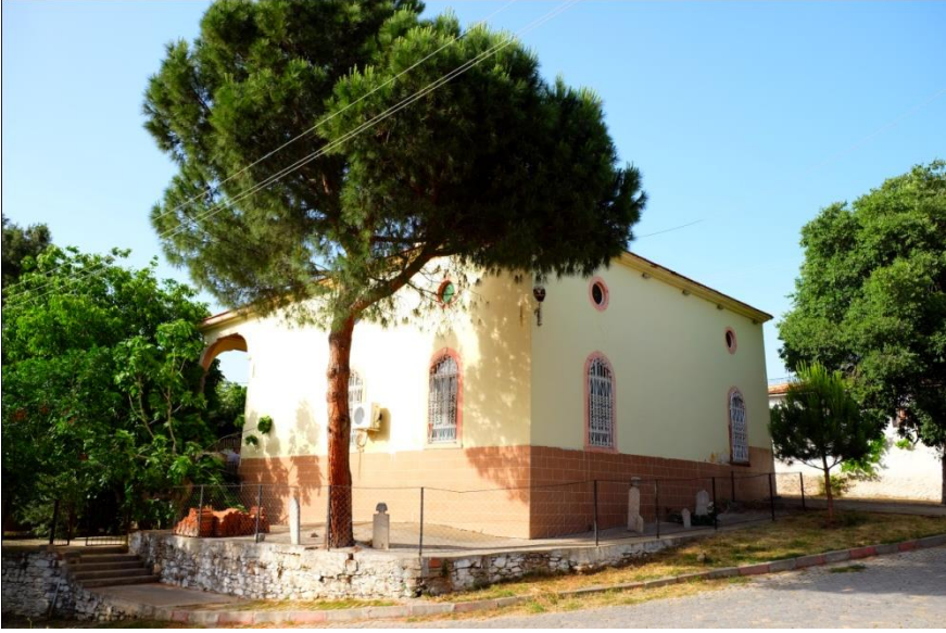
Resim 3- Irlamaz Köyü Camii. Güneybatıdan genel görünüm.