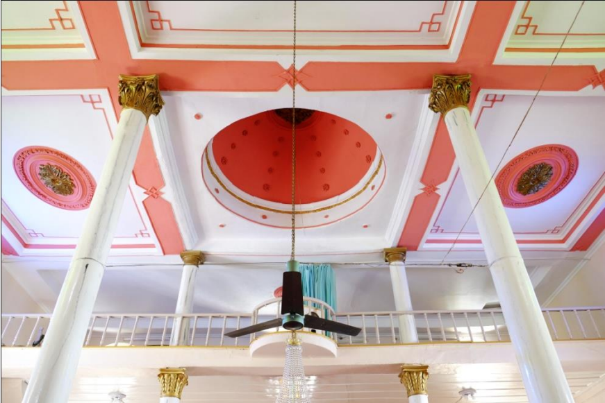
Resim 8- Irlamaz Köyü Camii. Harim tavanı.