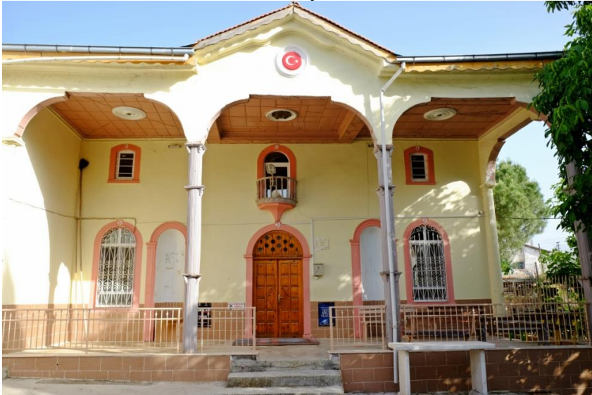
Resim 6- Irlamaz Köyü Camii. Kuzey cephesi.