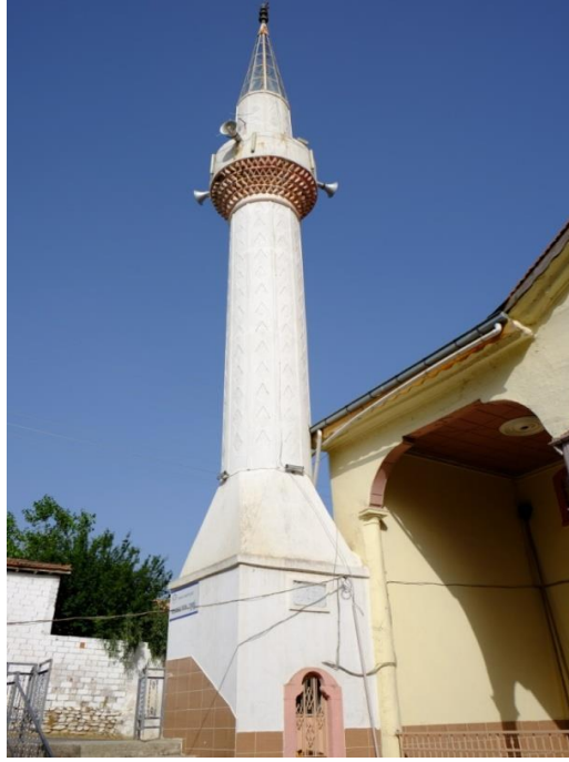
Resim 5- Irlamaz Köyü Camii. Minare.