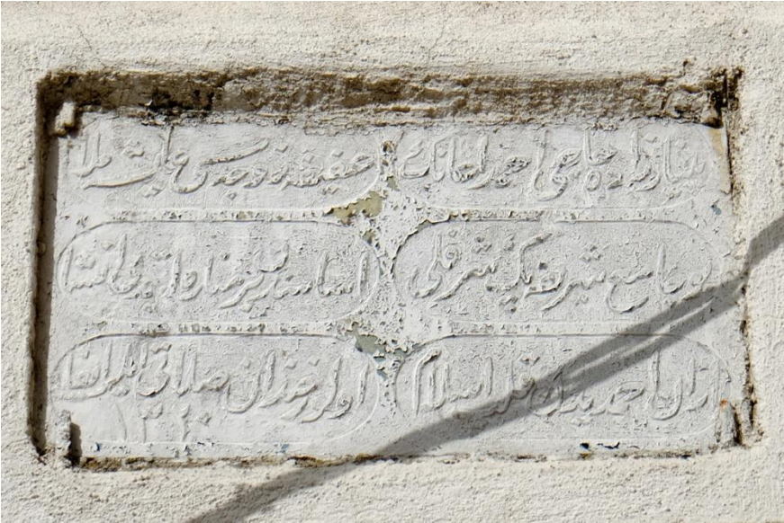
Resim 4- Irlamaz Köyü Camii. Minare inşa kitabesi.