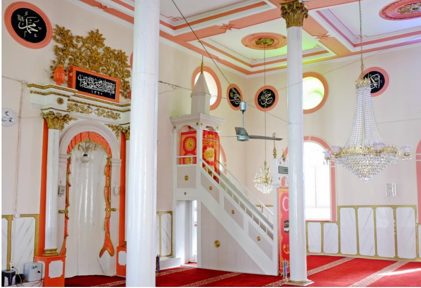
Resim 12- Irlamaz Köyü Camii. Mihrap ve minber.