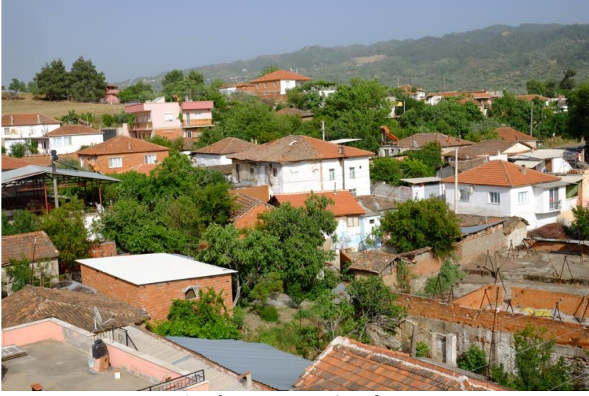
Resim 1- Irlamaz Köyü. Genel görünüm.