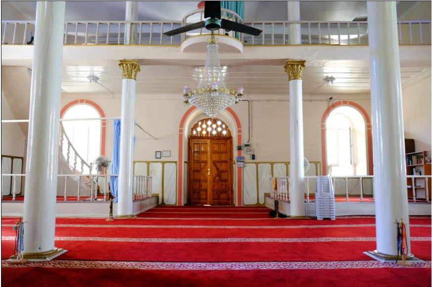
Resim 10- Irlamaz Köyü Camii. Harim kuzey duvarı.