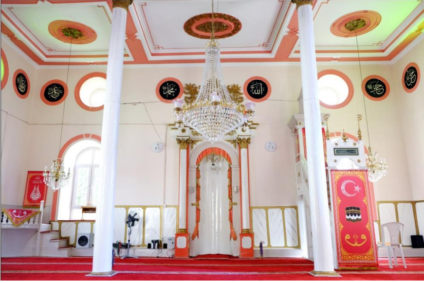
Resim 7- Irlamaz Köyü Camii. Harim güney duvarı.