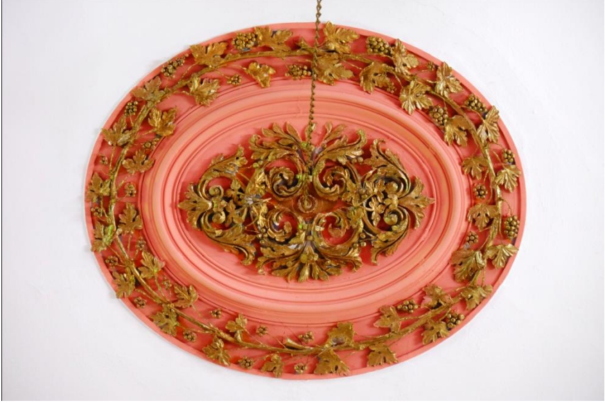
Resim 9- Irlamaz Köyü Camii. Harim tavanındaki alçı süslemeli göbek örneği.