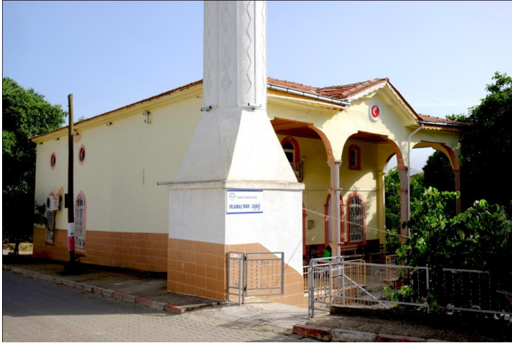
Resim 2- Irlamaz Köyü Camii. Kuzeydoğudan genel görünüm.