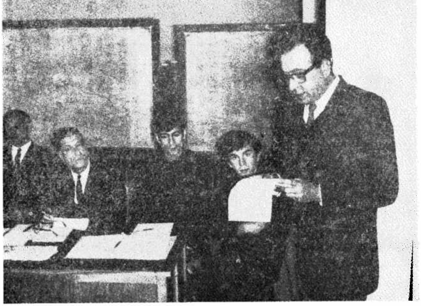
Türkiye Ziraatçiler Cemiyeti Adapazarı temsilcisi beklenen Sakarya Ziraî Öğretim Müessesesi için izahat veriyor

dunlarında hüsnüniyeti mevcu ise de hüsnü hareketini, eskimiş kanunlar engellemektedir. Merkezin bu hususta serzeniş ve şikâyetlerine Üniversite idarecileri bizlerden ziyade hak vermektedirler. O kadar ki bazen bizim yüzümüzden üzülmemeleri için onları teselli mecburiyeti bile hasıl oluyor!!