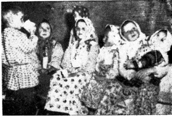
Amerika'ya göç eden Türkiye Kazaklarının çocukları New York Hava Alanında