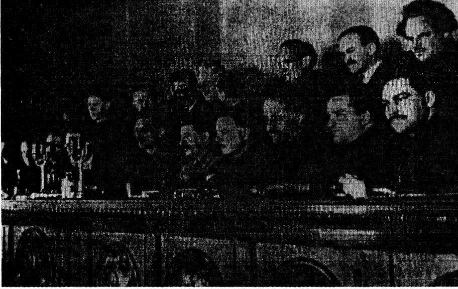
Politbüro üyeleri, BKP (b) XVII. Kongresi Prezidyumu'nda. (1934)