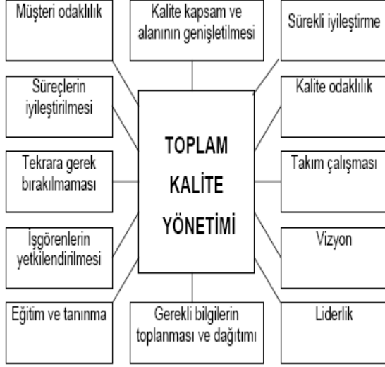
Şekil 2: Toplam Kalite yönetiminin Ana Unsurları ve Dayandığı Temel İlkeler

söylenbilir. Bu ortak unsurları aşağıdaki şekildeki gibi sıralayabilmektedir(Gencel, 2001:11).