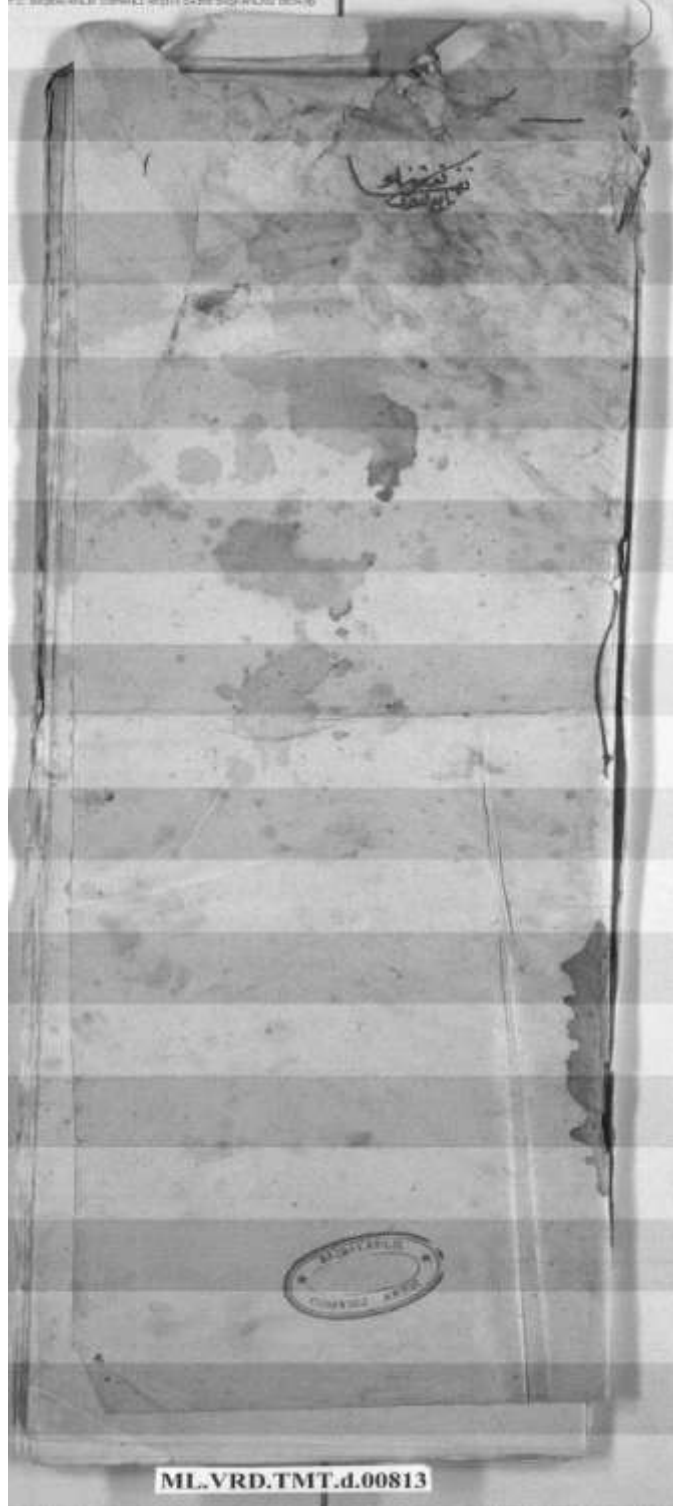
Belge 2. 1260 Tarihli Kurşunlu temettüat defterinin ikinci ve üçüncü sayfaları