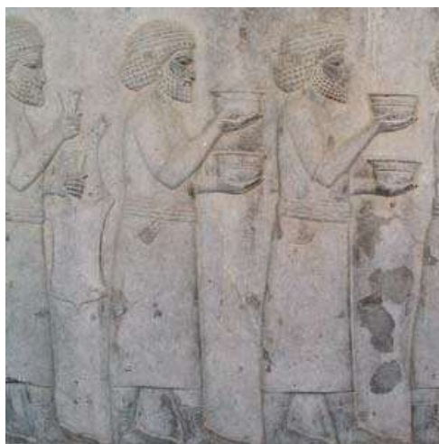
Abb. 6- Persepolis Apadana Schalenträger

Die in den Schriftquellen erwähnten original achämenidischen Schalen, dargestellt auf den Bankettreliefs des Schatzhauses und des Saals mit den hundert Säulen in Persepolis sind kostbare Metallarbeiten. Zu den prominentesten Beispielen dieser in Gold und Silber gefertigten Schalen in Kleinasien gehören die Stücke aus dem als „Harun Schatz“ bekannten Schatzfundes, der bei Raubgrabungen im Raum Provinz Uşak zutage gekommen war (Özgen&Oztürk, 1996). In Kleinasien wurden „Tonschalen des achämenidischen Typs“ als formale Nachahmungen dieser Metallschalen hergestellt, die als echte Reflexion achämenidischen Kunstschaffens zu werten sind (Abb.6).