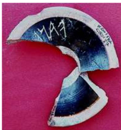
Abb.7- Attischer Kylix mit phrygischem Inschrift: Vana(x) von Daskyleion

Der Nachweis dieser Amtstradition durch eine Kennzeichnung auf einer Kylix im westkleinasiatischen Satrapensitz Daskyleion zeigt, daß diese „imitatio des Großkönigs“ in einem geographisch sehr großen Gebiet verbreitet war (Abb. 7).