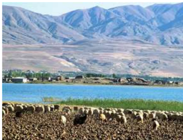
Abb.3- Ansicht zum Hügel Karagündüz

Wenn man diese Aussage mit archäologischen Quellen aus diesem Gebiet überprüft, stellt sich die Frage nach der Bedeutung der großen Anzahl an Schalen des achämenidischen Typs aus Schicht III des Siedlungshügels Karagündüz im Hinblick auf ihre Zugehörigkeit zur achämenidischen Epoche oder Kultur (Abb.3).