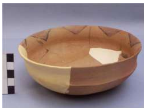
Abb.8- Bemalte achaemenidische Schale von Karagündüz

Ein zu Sardis vergleichbarer Befund in Ostanatolien auf dem Siedlungshügel Karagündüz wurden in der späten Eisenzeit, am Ende des 5. Jhs. v. Chr., in sehr guter Qualität hergestellt. Diese sind dünnwandig und gut gebrannt, haben einen cremefarbenen Untergrund, eine gute Politur; und einen ein- oder mehrfarbigen Dekor an der Randinnenseite (Abb.8).