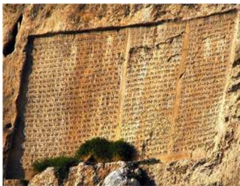
Abb.2- Inschrift von Xerxes

Sie besagt: Ein großer Gott ist Aburamazda, welcher der größte der Götter ist, der diese Erde schuf der jenen Himmel schuf, der den Menschen schuf, der die Segensfülle schuf für den Menschen, der den Xerxes zum Könige machte, den einen zum König von vielen, den einen zum Gebiet er von vielen. Ich bin Xerxes, der große König, König der Könige, König der Länder vieler Stämme, König dieser großen Erde auch fernhin, des Königs Darius Sohn, der Achämenide. Es spricht der König Xerxes: Der König Darius, der mein Vater war, dieser hat nach dem Willen Aburamazdas viel Schönes gebaut. Auch hatte er befohlen, diesen Felsen zu behauen, indessen eine Inschrift zu schreiben. Mich soll Aburamazda schützen nebst den Göttern und meine Herrschaft, und was von mir gebaut worden ist.