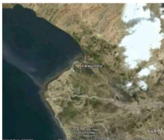
Abb.1 –Karagündüz Hügel und Erçek See

Der Siedlungshügel Karagündüz befindet sich in der ostanatolischen Provinz Van 35 km von der gleichnamigen Provinzhauptstadt entfernt am Nordostufer des Erçek Sees (Abb.1).