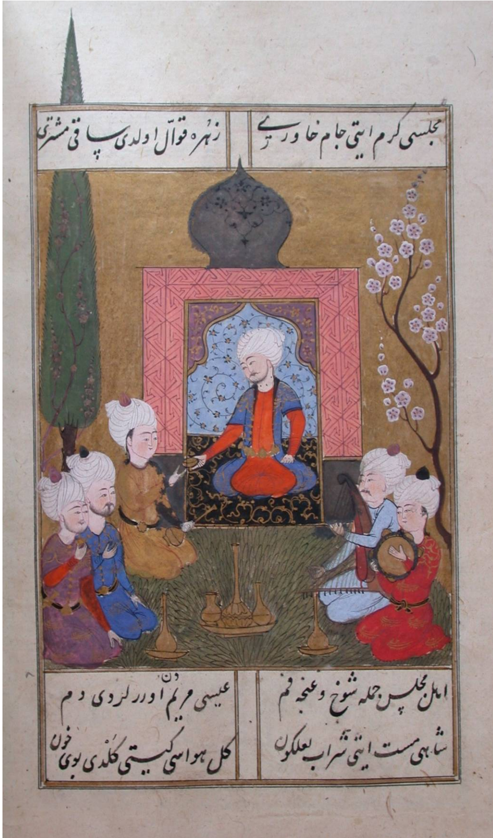
Resim 1: Sultan I. Selim'in meclisi, Selimname 64b, TSK H.1597-98