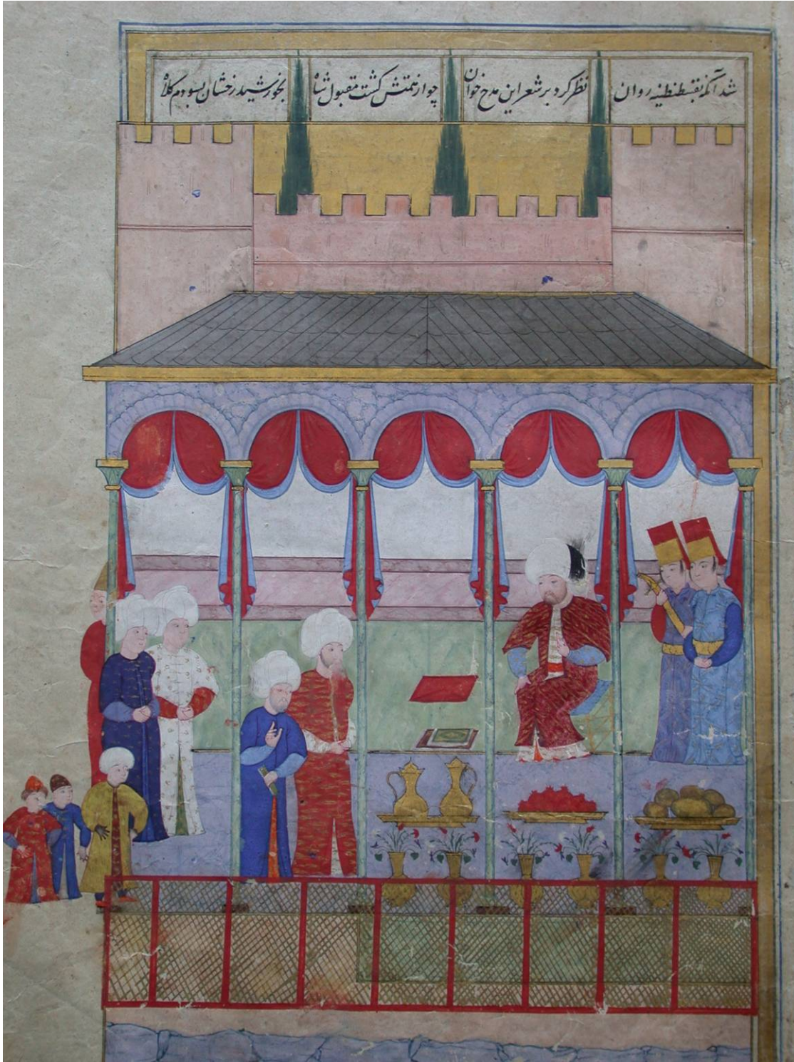
Resim 3: Sultan II. Selim'in meclisi, Şehname-i Selim Han, 13a, TSK A.3595