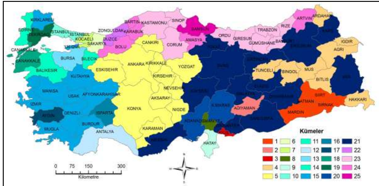
Şekil 3. İki Birimlik Mesafede İllerin Benzerlik Kümeleri

Dendrogramda iki birimlik mesafede genelde birbirine komşu il grupları birleşerek küme sayısı 25'e düşmektedir (Şekil 3). Özellikle Karadeniz, Orta Anadolu, Doğu Anadolu ve Batı Anadolu'da il gruplarının birleştikleri görülmektedir.