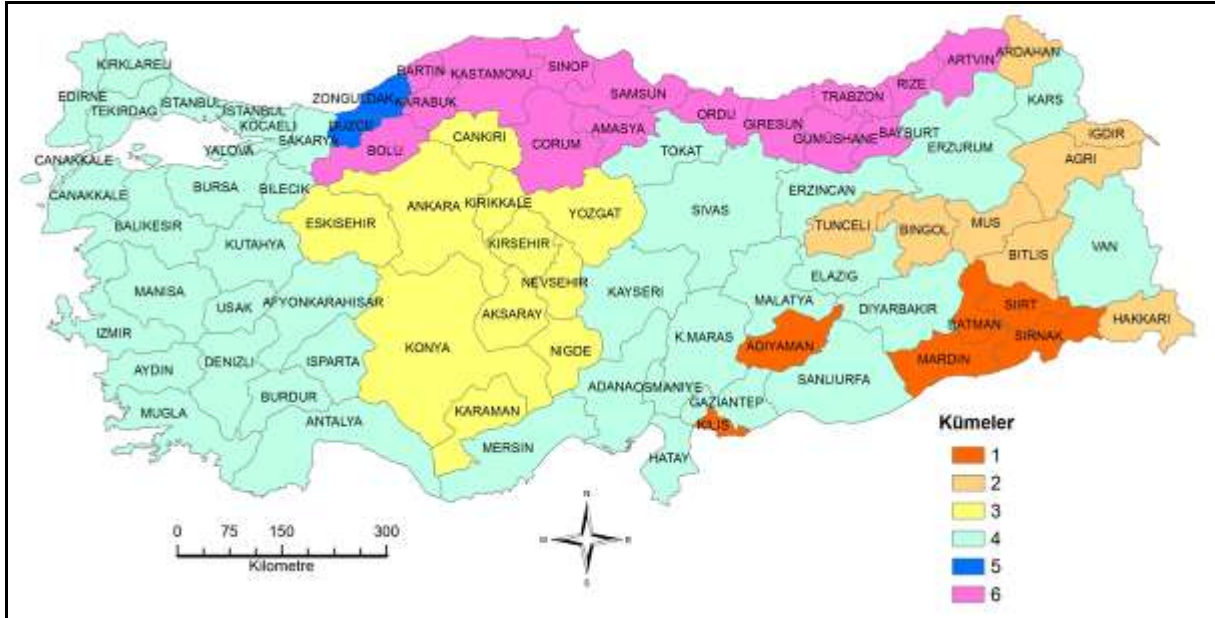
Şekil 7. Altı Birimlik Mesafede İllerin Benzerlik Kümeleri

Altı birimlik mesafede Sakarya, Kocaeli ve Osmaniye'den oluşan grup Batı Anadolu grubu ile birleşerek küme sayısı 6'ya düşmektedir (Şekil 7).