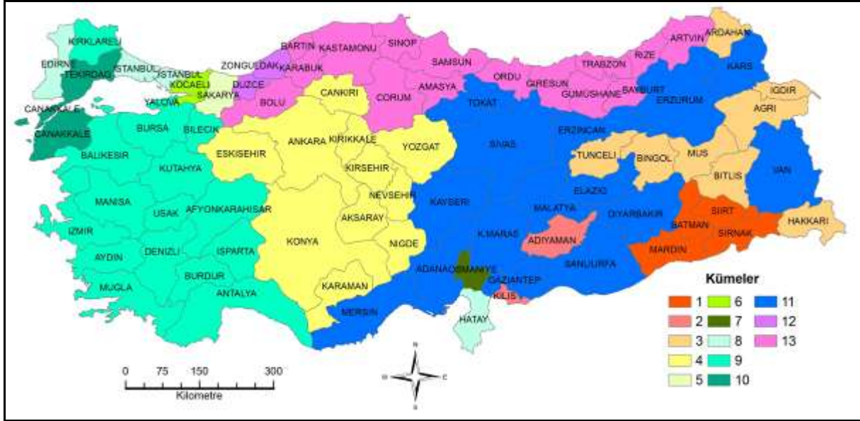
Şekil 4. Üç Birimlik Mesafede İllerin Benzerlik Kümeleri

Anadolu ve Marmara bölgelerinde parçalı bir kümelenme olmaktadır. Bu mesafede Hatay Marmara grubuna benzerken, Sakarya, Kocaeli ve Osmaniye hala tek başına bir küme olarak kalmaktadır.