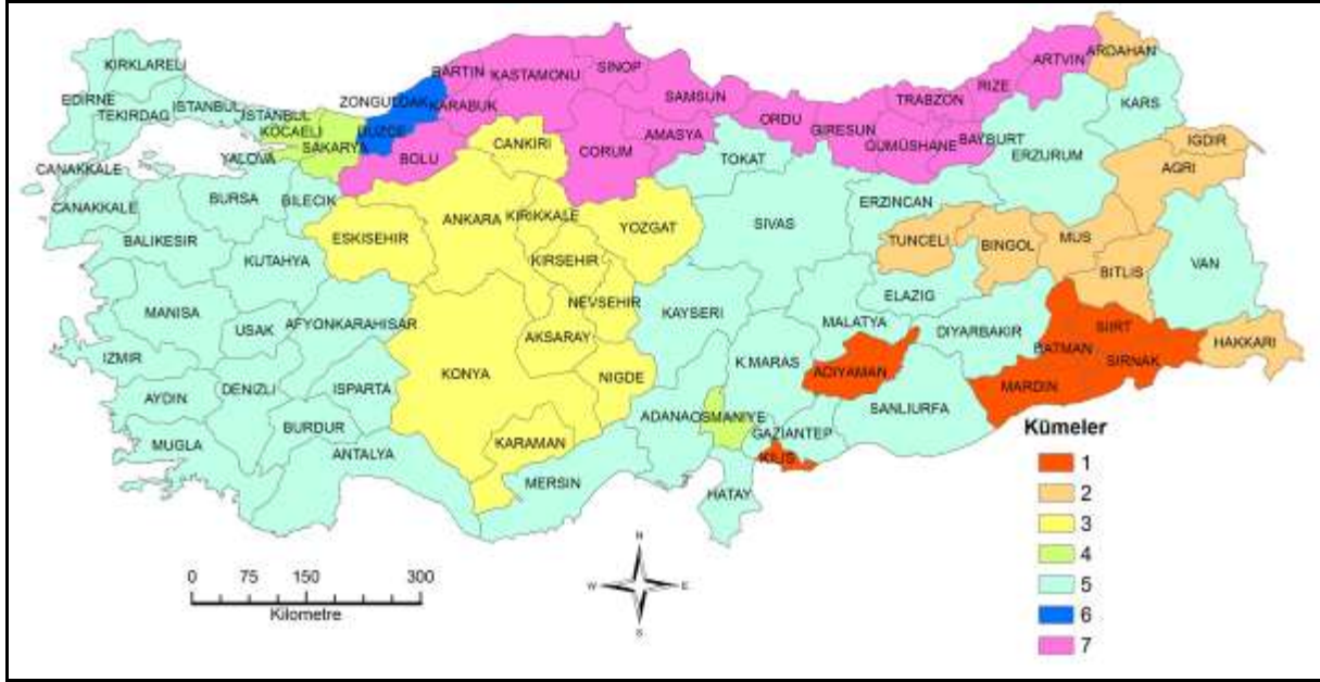
Şekil 6. Beş Birimlik Mesafede İllerin Benzerlik Kümeleri

Beş birimlik mesafede Batı Anadolu ile Doğu Anadolu grubu birleşerek küme sayısı 7'ye düşmektedir (Şekil 6).