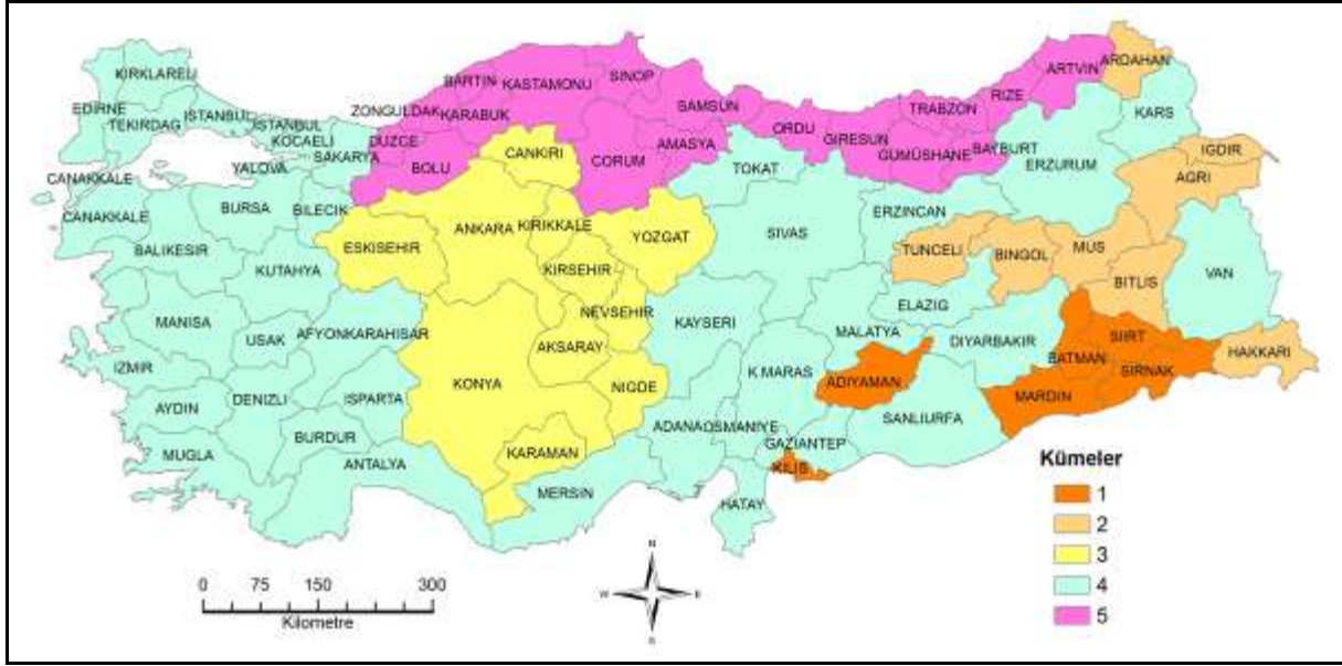
Şekil 8. Yedi Birimlik Mesafede İllerin Benzerlik Kümeleri

Yedi birimlik mesafede Düzce ve Zonguldak illeri Karadeniz grubu ile birleşerek küme sayısı 5'e düşmektedir (Şekil 8).