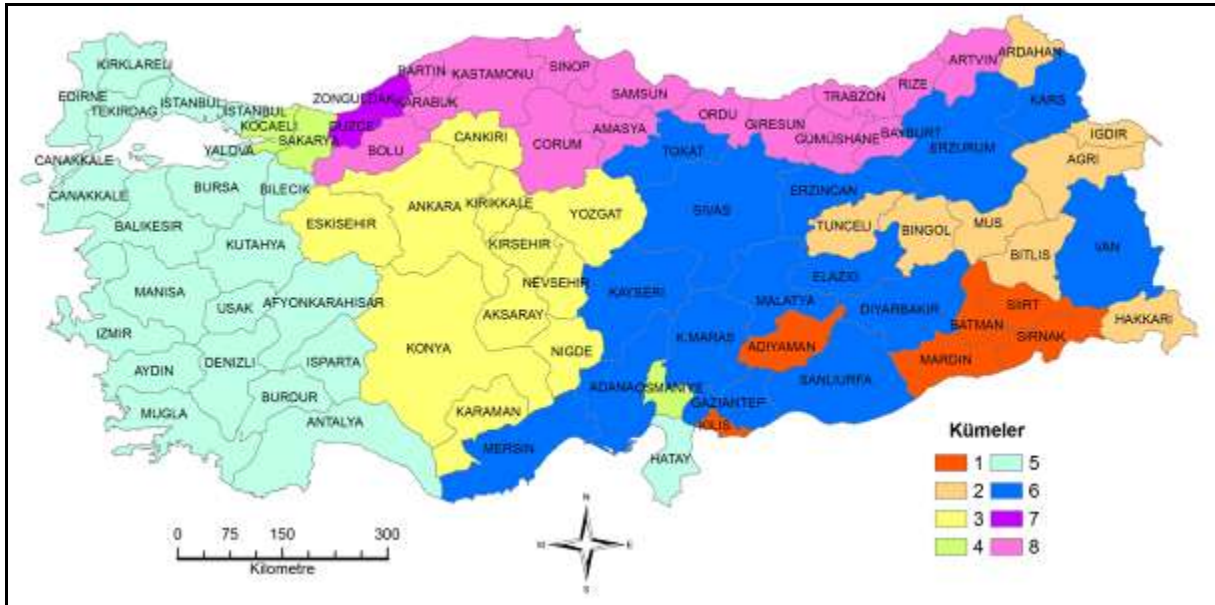
Şekil 5. Dört Birimlik Mesafede İllerin Benzerlik Kümeleri

Dört birimlik mesafede Marmara bölgesindeki grup Batı Anadolu ile, Adıyaman ve Kilis güneydoğu Anadolu grubu ile, Sakarya, Kocaeli ve Osmaniye illeri ise kendi aralarında birleşerek küme sayısı 8'e düşmektedir (Şekil 5).