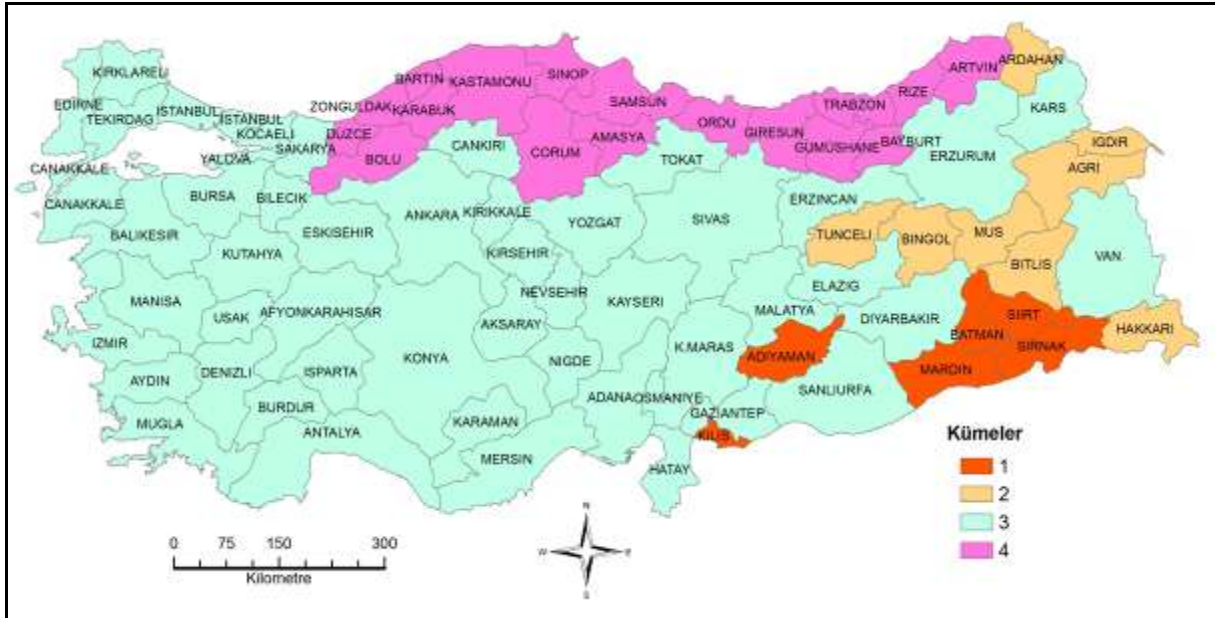
Şekil 9. Dokuz Birimlik Mesafede İllerin Benzerlik Kümeleri

Dokuz birimlik mesafede Batı Anadolu ile Doğu Anadolu grubu birleşerek 50 ilden oluşan büyük bir grup meydana getirmekte ve küme sayısı 4'e düşmektedir (Şekil 9).