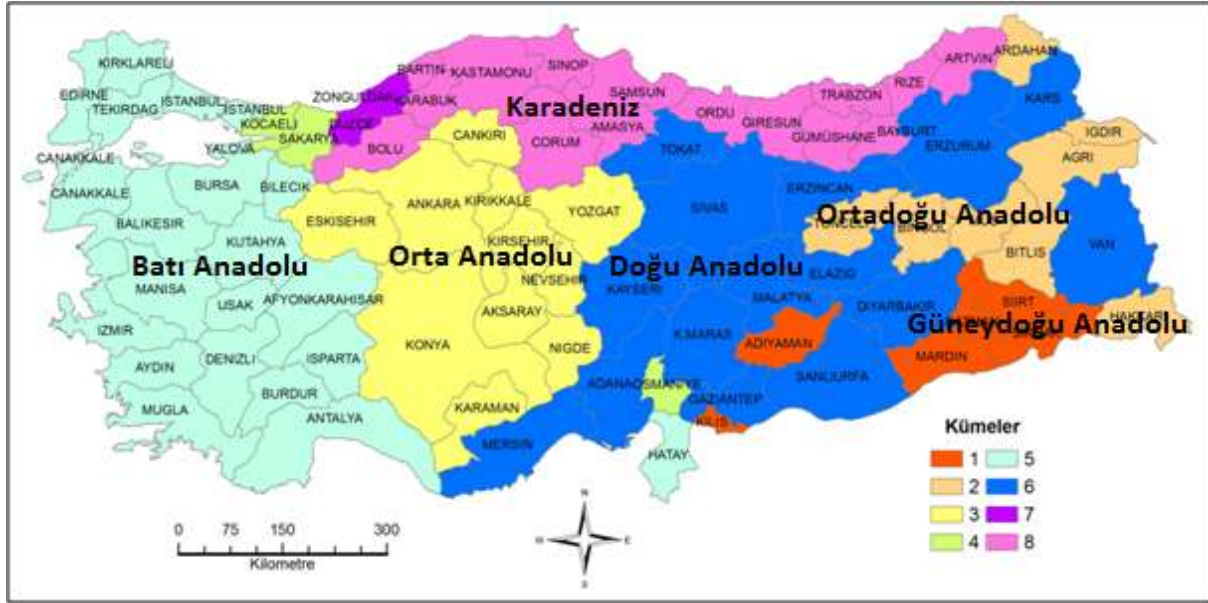
Şekil 11. Türk Halk Müziği Eserlerinde Geçen Coğrafi Kelimelere Göre Türk Halk Müziği Bölgeleri