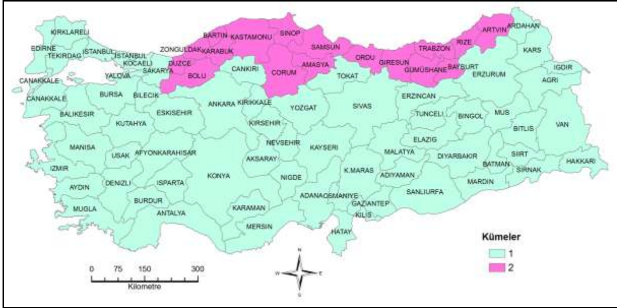
Şekil 10. On Yedi Birimlik Mesafede İllerin Benzerlik Kümeleri

On yedi birimlik mesafede ise genel olarak Karadeniz Bölgesi illeri kendi aralarında, diğer iller ise kendi aralarında grup oluşturmakta ve küme sayısı 2'ye düşmektedir (Şekil 10). Karadeniz Bölgesi'nin coğrafi ve müzik kültürünün ayrı özellikler taşıdığı anlaşılmaktadır.