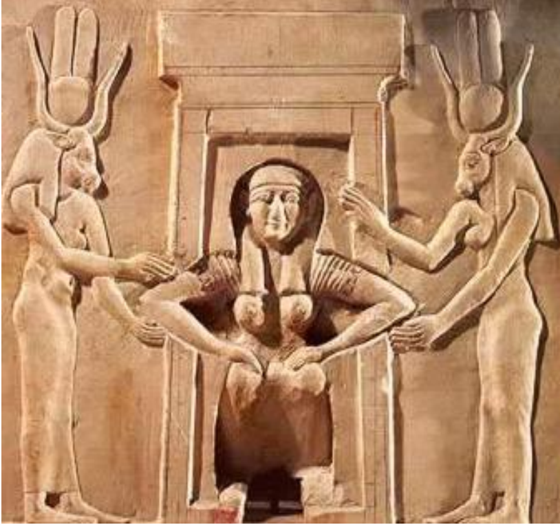
Doğum yapan Mısırlı kadın-Çömelme Pozisyonu

http://db.bbc.co.uk/history/ancient/egyptians/health_01.shtml (23.01.2012-16:16)