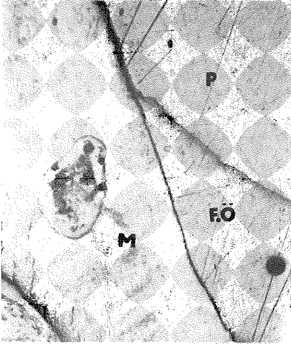
Resim 3. Helio Seal uygulanmış bir süt azısı (x60 büyütme)

I. ve II. grup birbirleri ile karşılaştırıldığında kenar sızıntısı açısından fark bulunmamıştır. Kurallarına uygun olarak uygulanan iki tip fissür örtücünün de kenar sızıntısı oluşturmadığı belirlenmiştir.