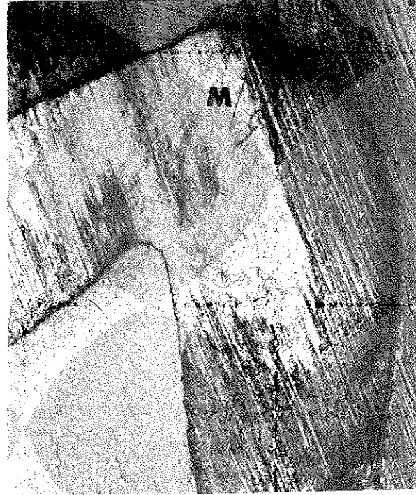
Resim 2. Delton uygulanmış bir süt azısı. (x60 büyütme)