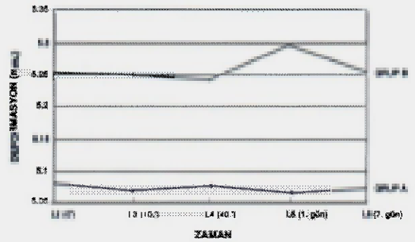
Grafik 1. A ve B grubundaki ardışık geçişler