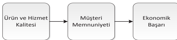
Şekil 1: İşletme Başarı Zinciri (Bruhna ve Grunda, 2000)

sıfır hata ve sürekli iyileşme çalışmalarıdır. TKY uygulamalarının başarısı, yönetimin katılımı ve alınan kararların icra edilebilirliğiyle doğrudan ilişkilidir. TKY çalışmaları firma genelinde yeni bir çalışma ve yaşama kültürü meydana getireceğinden dolayı bu süreç uzun süreli ve maliyetli gözükabilir. Ancak bu uygulamalar sonucunda firmadaki kalitesizliğin ve kalitesiz ürün oranlarının düşeceği, israfın azalacağı, çalışan performans ve tatmininin artacağı, müşteri memnuniyetinin, firma imajının, satışların ve dolayısıyla karlılığın artacağı düşünüldüğünde bu maliyetlerin kalitesizlik maliyetine oranla katlanılabilir olacağı gözükcektir. (Gençyılmaz ve Zaim, 1999), (Deming, 1986)