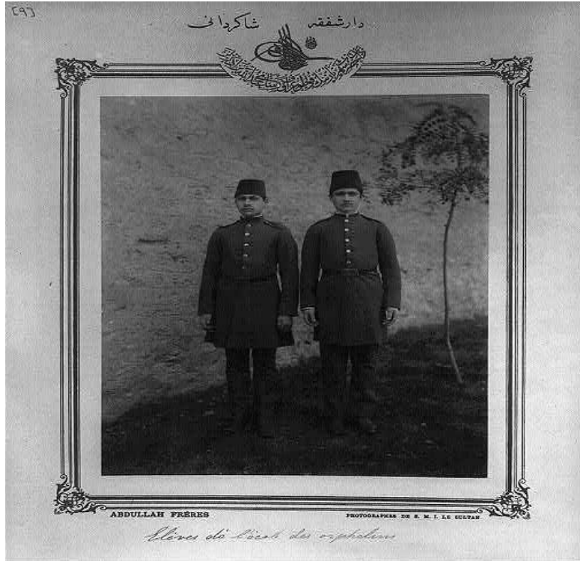
Resim 1: Darüşşafaka Öğrencileri