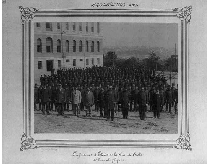
Resim 2: Darüştıfaka Öğretmen ve Öğrencileri