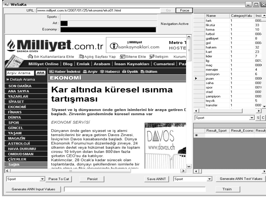
Şekil 3. Uygulama Arayüzü

Eğitim ve test kümelerini oluşturmak amacıyla gezilecek olan web sayfalarının adresleri URL satırına yazılarak o sayfadaki kelimeler ayrıştırılmış ve üç karakterden uzun olan kelimeler "Parse to Cat" tuşu ile tutulmuştur. Aynı kategoriden birçok sayfa gezilerek bu kategoride en çok rastlanan kelimeler ekran çıktısında görülen "S" tuşuyla sıralatılarak ait olduğu kategori için tekrarlamaya sayısıyla birlikte kaydedilmiştir. Belirlenen üç kategori için farklı sayfalar gezilerek elde edilen özellik matrislerinden eğitim kümesi oluşturulması için "Save ANNT" ile kaydedilmiştir. Kelime haritasında belirlenen 60 kelimenin x_i değerlerini, 30 farklı sayfa örneği için içeren bu küme YSA'nın eğitilmesinde giriş olarak kullanılmıştır. Çıkış olarak ise ait olduğu kategoriye göre [1 0 0], [0 1 0] veya [0 0 1] kullanılmıştır. Daha önceden tanımlanmış olan YSA yapısına elde edilen giriş ve çıkışlar verilerek "Train" tuşu ile