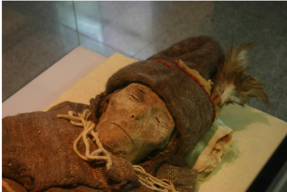
Resim 3: 3800 yil burun yaşığan Kiroran melikisi (Zhongguo, Xuar Muzéyi)