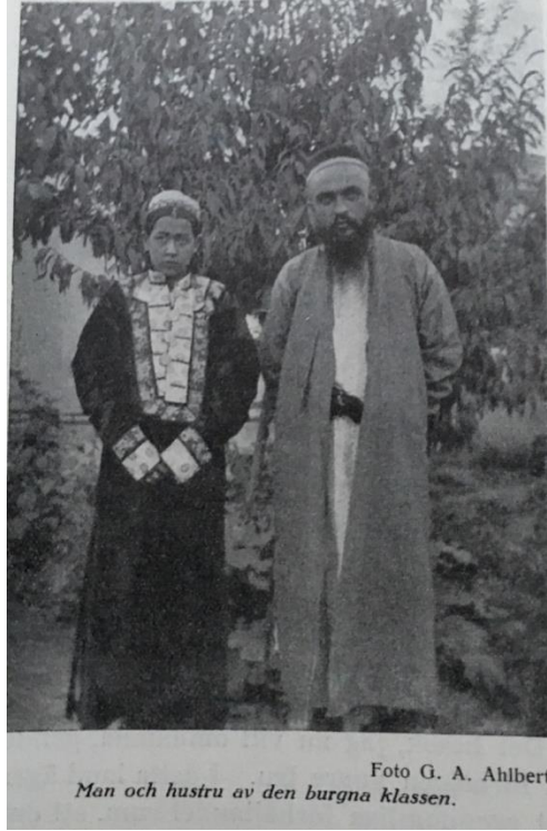
Resim 4: Baylar tebiqisidiki bir jüp er-xotun