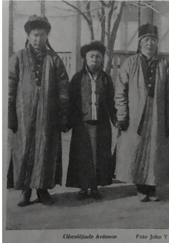
Resim 5: Yüzi oçuk Uyğur ayalliri (Missionir John Törnqvist teripidin tartilğan, “Egri Toqay Yollardiki İzlar-Şerqi Tūrkestandiki 25 Yil”)