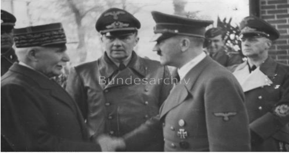
Bundesarchiv, Bild 183-H25217 Foto: Hoffmann, Heinrich | 24. Oktober 1940

Özetle Damat Ferit’in Vahdettin ile birlikte “Allah’a ve İngilizlere güvenmek” üzerine ikame ettiği hıyanet-i vataniye siyaseti 23 , Sevr ile zirveye çıkmakla beraber, bunun yanı sıra Kuvâ-yı Milliye karşıtı eylemleri, Millî Mücadele’ye katılanlar için çıkarttığı idam fermanları, Anadolu’da Kuvâ-yı Milliye karşıtı her türlü ayaklanmayı desteklemesi ve fetvalar alması kurtuluşu İngilizlere 24 teslimiyette gördüğünün açık bir göstergesidir.