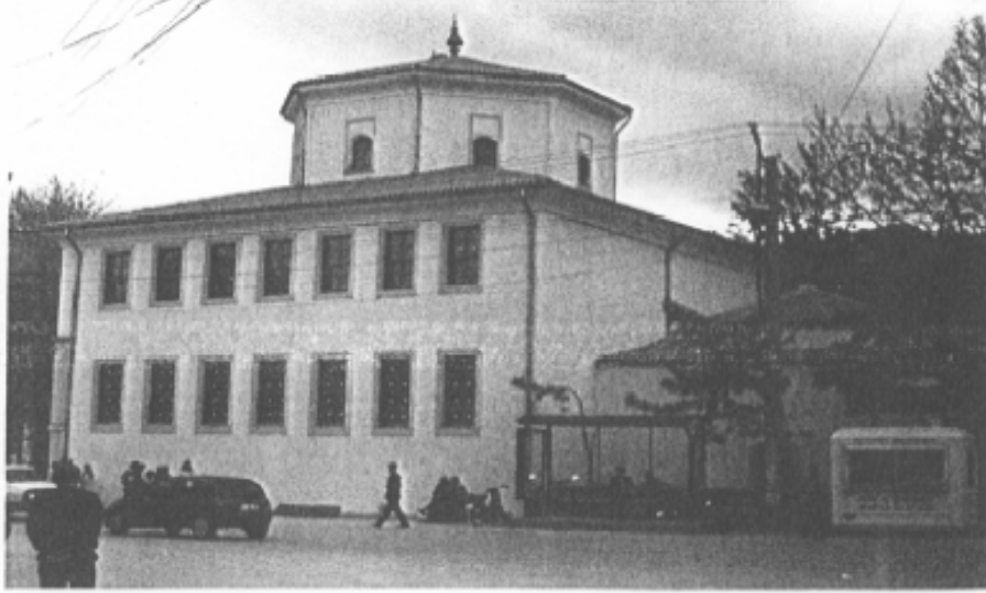
Kütahya Mevlevihânesi'nin (Dönenler Camii) Şimdiki Durumu.