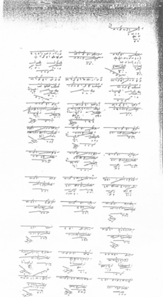
Ergun Çelebi Zâviyesi'nin 1530 tarihindeki Vakıfları (BOA, TD, 438, s. 111)