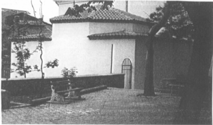
Hezar Dinarî Mescidi'nin Genel Görünümü.