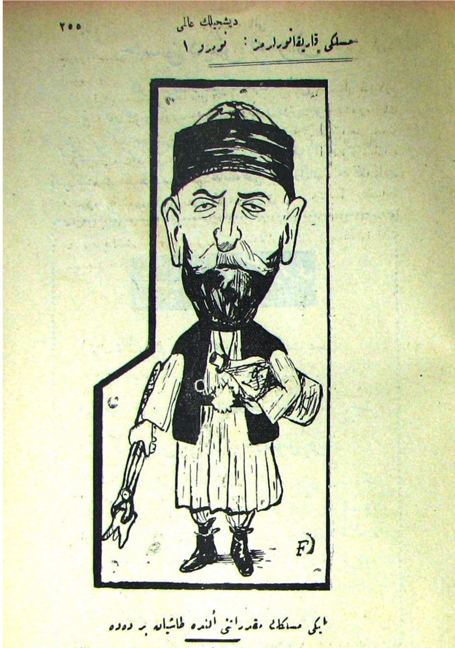
(İki Mesleğin Mukarreratını Elinde Taşıyan Bir Dede)

Mesleki Karikatürlerimiz (DA, 1 Şubat 1925, Sayı: 8, s. 255)