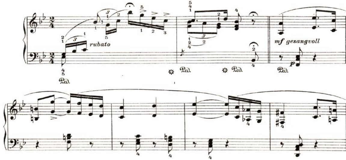
Şekil 4. Schumann, R. Op.124 Romans, düzenleme: Hochstetter, C.

Tek el eserlerden oluşan piyano repertuarı, kol ve el uzuvlarında fiziksel rahatsızlık yaşayan öğrencilerin, başarılı olabilmek için düzenli bir katılımı gerektiren piyano dersinden uzaklaşmayı derse devamını sağladığından oldukça önemlidir. Ayrıca bu repertuar sayesinde öğretmen ve piyanistler meslek yaşantılarına devam edebilmekte, öğrenciler ise öğrenim hayatlarını tamamlayıp meslek edinebilmektedirler.