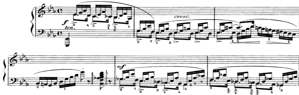
Şekil 3. Pauer, E. Op.72 Sol el için suit, Prelüd

Sol el piyano eserleri literatüründe baş parmağın sürekli melodiye çalan parmak olarak düşünülmesi yanlış olacaktır. Mendelssohn' un Op.67 No.1 üçüncü ölçüde görüldüğü gibi melodinin yürüyüşünde ikinci parmak da yer almaktadır. Melodiye çalan parmaklar eserden esere farklılık göstermekte olup dört ve beşinci parmakların da ezgiye yürüttüğü örneklerle de sıkça rastlanmaktadır. Pauer' in Op.72 sol el için suisinde üç, dört ve beşinci parmakların melodiye çaldığı Prelüd bölümü bu durum için iyi bir örnektir.