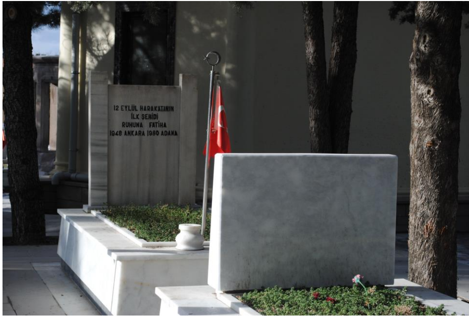
Fotoğraf 12: Bir mezar taşı arkası: Taşın arkasındaki yazı: "12 Eylül Harekâtının İlk Şehidi Ruhuna Fatıha 1948 Ankara 1980 Adana".