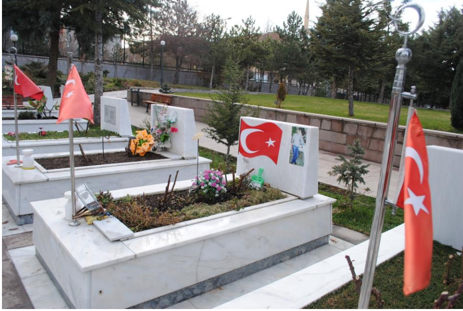
Fotoğraf 9: Yakınların mezarlıklara katkılarından bir görünümün (Ocak 2013).

söylemsel bir rekabete dönüşür. Askerî olanla sivil olan arasındaki salınımlar, Şehitlik'te bu türden söylemsel bir rekabetin mekânsallaşmasının çarpıcı bir örneğini sunmaktadır.