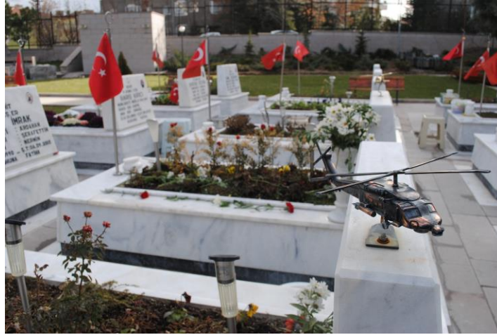
Fotoğraf 8: Mezar taşı üzerine yapılan helikopter maketi (Ocak 2013).

Mezar taşlarındaki temsiliyetlerin zamana bağlı olarak değişimi yalnızca sözler aracılığıyla gerçekleşmemektedir. Özellikle 2000’li yıllardan sonra mezar taşlarına hayatını kaybedenlerin yakınları tarafından yerleştirilen eklentiler yalnızca sözle kurulan hikâyelere ilişkin bazı detaylar sunmaktadır. Örneğin 2000’den sonra yapılan üç farklı mezarlıkta metal helikopter maketleri bulunmaktadır (bkz. fotoğraf 8). Beraber yürürken, görevli helikopter maketli mezarlıklardan birini göstererek hayatını kaybeden bu askerin helikopter içinde kurşunlandığını, ailesinin dava açtığını ve davanın hâlen devam ettiğini belirtmiştir. Görevlinin verdiği detaylar, mezarlıklarda sembolik ya da söylemsel olarak ifadesini bul(a)mayan, mezar taşlarının ziyaretçilerden gizlediği ya da örtük bir biçimde temsil ettiği şehitlik hikâyelerinin de olabildiğine işaret etmektedir. 17