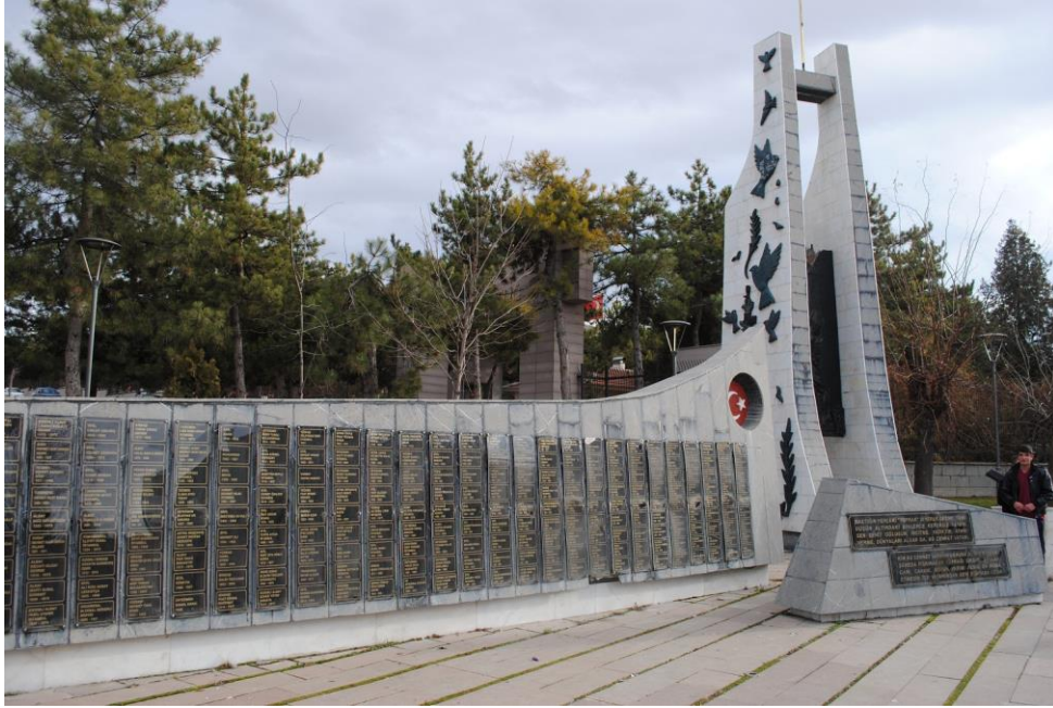
Fotoğraf 3: Atatürk ve güvencini zeytin dalı ve silah tasviri bulunan tak (Ocak 2013).

Bahsedilen iki bloğun ortasında, onlardan daha uzun iki kalın sütundan yapılmış bir tak bulunmaktadır. Takın sütunları yukarıya doğru daralmakta ve iki sütunu bir beton kalıp birleştirmektedir. Birleştiren beton kalıbın hemen altında metal bir blokta, Atatürk'ün Kocatepe'de sigara içerken tasvir edilen görüntüsü kullanılmıştır. Takın sütunları, barış sembolleri olarak bilinen güvercin ve zeytin dallarıyla süslenmiş, ancak takın üstünde aynı zamanda bir silah tasviri de yerleştirilmiştir (bkz. fotoğraf 3). Bu tasvirlerin, ziyaretçilere ölümü ve “vatan için kendilerini feda etmiş” bu bedenlerin aslında barış için, geride kalanların barışı ve huzurlu yaşamaları için öldüklerini hatırlattığı söylenebilir. Ancak barış her zaman fazla “barışçıl” değildir, savaşı bertaraf etmez, etmek istemez. Güvenliğin tesisi için ölmenin ve öldürmenin birbirinden ayıramayacak kutsal eylemler olduğu mesajını, barış sembollerinin yanında bulunan silahın gönderdiği söylenebilir. Beş parçalı anıtın tam ortasında bulunan ve diğer yapılardan daha büyük olan bu tak ve takın ortasındaki Atatürk tasviri tüm anıtın merkezinde bulunmaktadır.