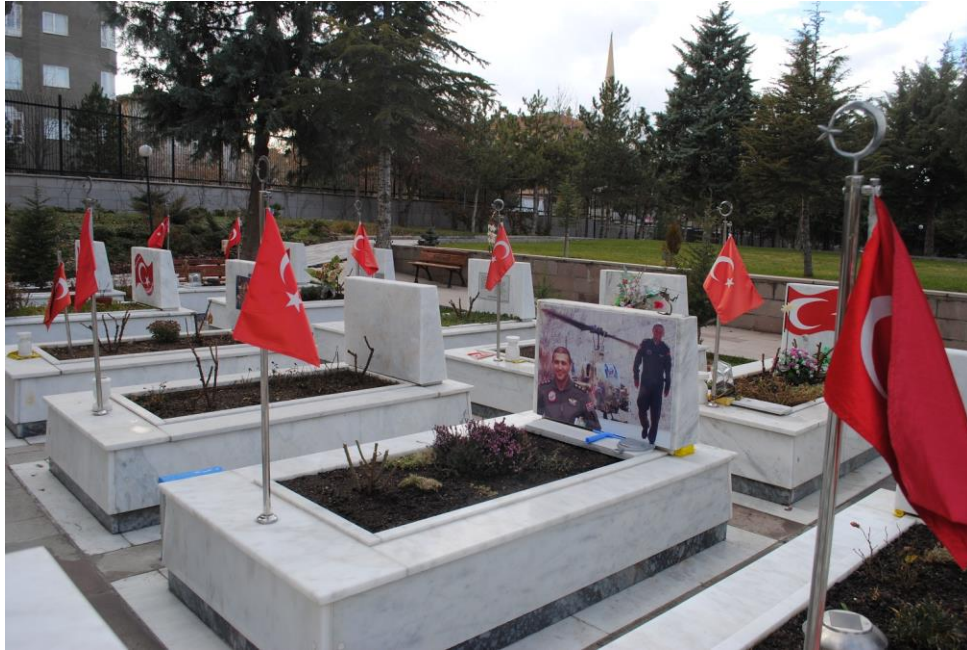
Fotoğraf 10: Yakınların mezarlıklara katkılarından bir görünümün (Ocak 2013).