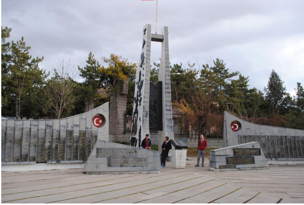
Fotoğraf 1: Atatürk ve Şehitler Anıtı'ndan genel bir görünüm (Ocak 2013).