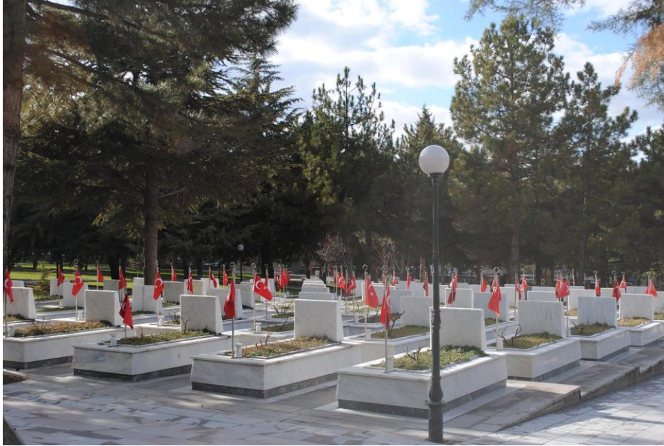
Fotoğraf 4: Mezar taşlarına yerleştirilen Türk bayrakları (Ocak 2013).

Mezar taşlarının anlattığı hikâyeyi daha yakından anlamak için mezarlıkların içlerine doğru girildiğinde, sivil mezarlıklarda karşılaşılmayan bir düzen dikkat çeker. Arazi içindeki parseller düzenli bir biçimde bölünmüş ve tüm mezarlıklar aynı hizada yer almaktadır. Askerî bir geçidi andırırçasına, her mezarlık nizami olarak bir sonrakini takip etmektedir. Ayrıca, her mezarlığın mezar taşı olmayan diğer ucuna bir Türk bayrağı yerleştirilmiştir (bkz. fotoğraf 4). Yönergede belirtilen kurallara paralel biçimde mezar taşlarının üzerinde aktarılan içerikler de, benzer bir düzen doğrultusunda sıralanmıştır: Askerî rütbelere, isimler, doğum ve ölüm yılları, memleketler vb. aynı sırayla aktarılmıştır. Bonatz (aktaran Mosse, 1979, s. 9-10) askeri mezarlıklardaki düzen ve uyumun sembolik düzlemde bireyin topluma tabiiyetini işaret ettiğini ve böylece mezarlıkları anıta dönüştürdüğünü belirtmektedir. Hatta, ona göre, askerî mezarlıklar, mezarlık oldukları kadar birer ulusal ibadethane olarak görülmesi nedeniyle, tıpkı ibadet mekanlarında olduğu gibi, her detayın belli bir biçimde tanımlandığı bir düzenlemeye sahiptir.