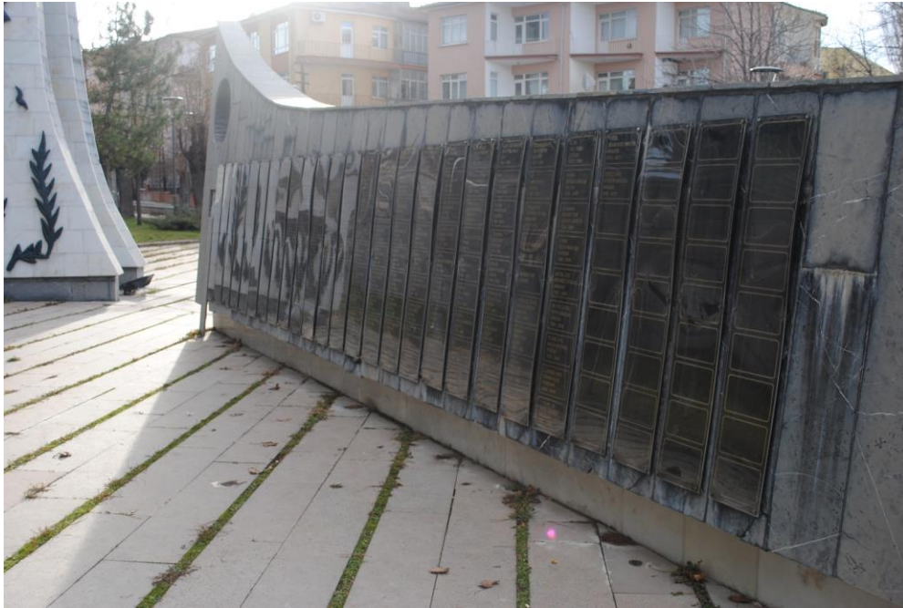
Fotoğraf 2: Atatürk ve Şehitler Anıtındaki boş isimlikler (Ocak 2013).