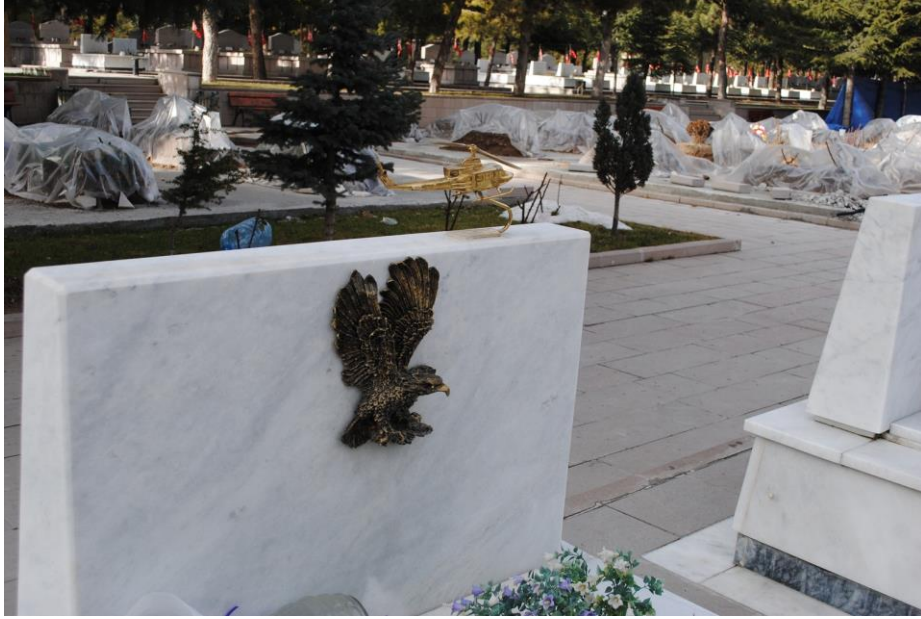
Fotoğraf 11: Yakınların mezarlıklara katkılarından bir görünümün (Ocak 2013).