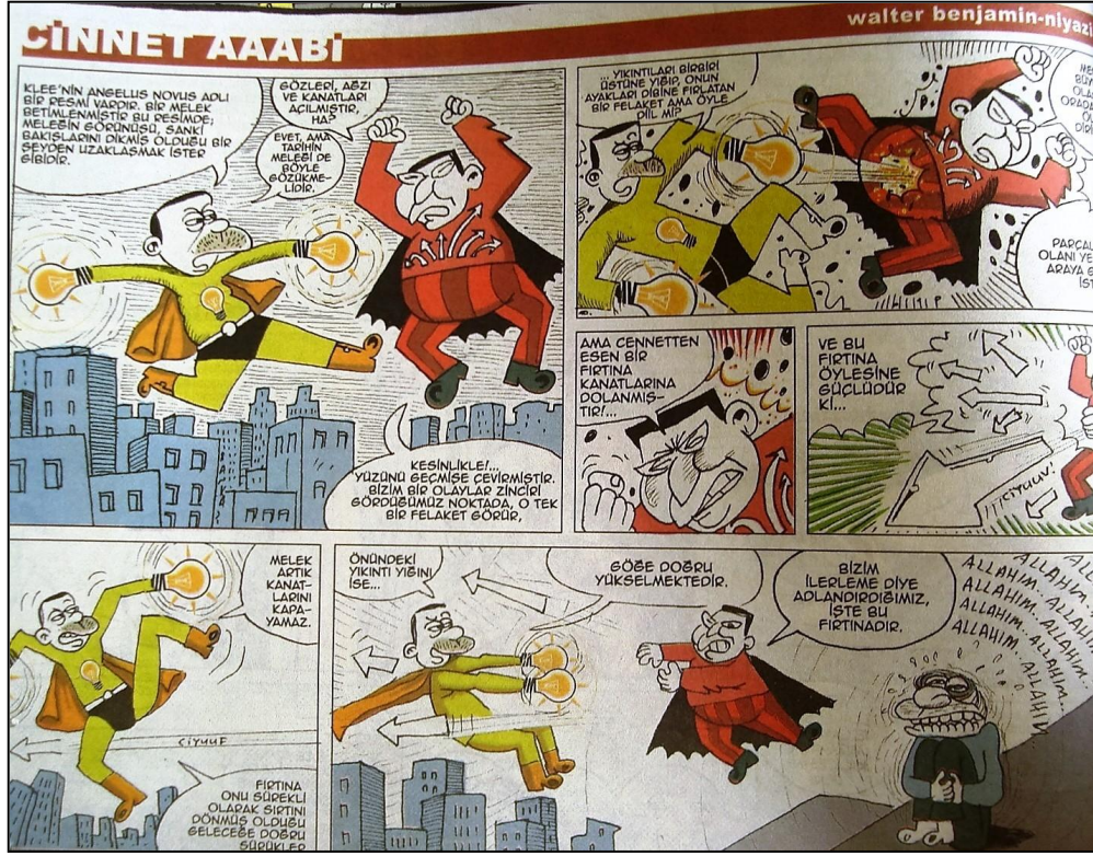
Şekil 7 – Cinnet Aabî, Walter Benjamin, Niyazî Çol, Cafcaf, Sayı 25, s. 22.

Derginin çizerlerinin dergilerini ve İslam-mizah ilişkisini nasıl tanımladıkları da bu konuda bir veri olarak ele alınabilir. Yapılan röportajlardan birinde karikatürist Ahmet Altay kendi görüşünü şöyle dile getiriyor: