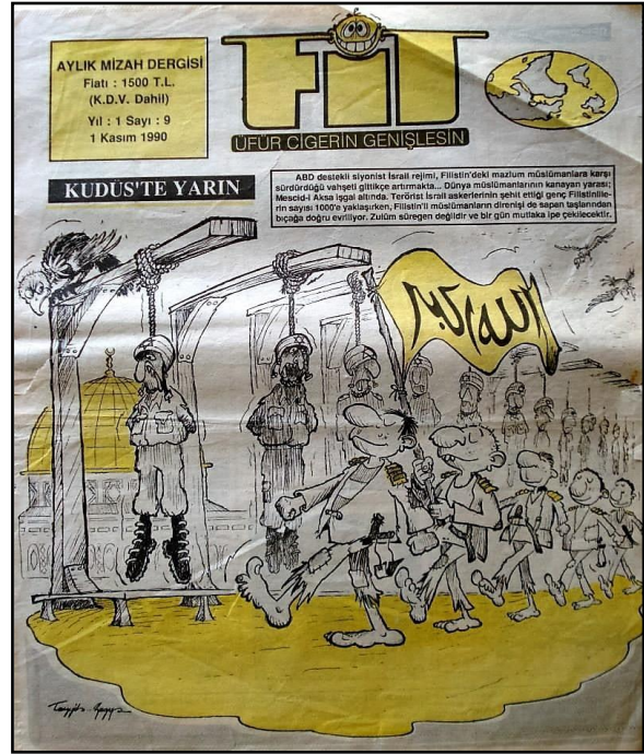
Şekil 1 - Fit, Sayı 9.

1990 yılında İzmir merkezli çıkmaya başlayan ve 11 sayı yayınlanabilen Fit dergisi (Şekil 1), “Şahısların ve kurumların putlaştırılmalarına karşıyız. Tüm bunları ‘yeni putlar koymadan’ yıkmaya çalışacağız.” şiarıyla yola çıkmış bir dergidir. Derginin bütün İslami dergilerde ortak olarak sayabileceğimiz Amerika ve İsrail düşmanlığı üzerine çizilmiş birçok karikatürün yanı sıra siyasi karikatürlerin genel ağırlığını türban sorunu, Kemalist algı, Filistin sorunu gibi konular oluşturmaktadır. 12 Eylül ve darbe karşıtlığı üzerine çizilen karikatürlere de yer verilmesi dikkat çekicidir.