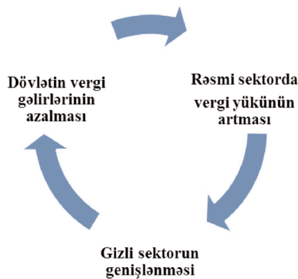
Sxem 1: Gizli iqtisadiyyat və vergiqoymada “çıxılmaz hal”

Həqiqətən də gizli iqtisadiyyatın ən neqativ təsiri dövlət gəlirləri üzərindədir. Sxem 1-də də ifadə edildiyi kimi gizli sektorun inkişafı ilə dövlətin vergi gəlirləri arasında bir “çıxılmaz hal” ortaya çıxır. Belə ki, gizli sektordan irəli gələrək gəlirləri azalan dövlət, məcburiyyət qarşısında qalaraq rəsmi sektorda vergi yükünü artırma yolunu seçir ki, bu da rəsmi sektorda fəaliyyət göstərənlərin gizli sektora yönəlməsini bir qədər də stimullaşdırır və nəticədə daha geniş bir gizli sektor formalaşdırır.