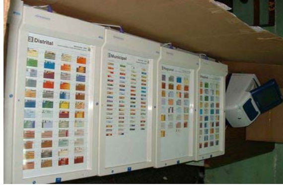
Şekil 3. Venezüella'da kullanılan oy verme aygıtı