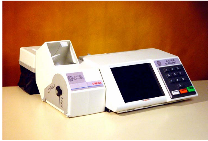
Şekil 2. Brezilya’da kullanılan oy verme aygıtı

2002 yılında yapılan seçimlerde yaklaşık 360,000 aygıt kullanılmıştır. Seçimler sırasında yazıcılarda görülen, genellikle seçim kurullarının hatalarından kaynaklanan aksaklıklar sonucu uzun kuyruklar oluşması eleştirilere neden olmuştur. Buna rağmen 1989 seçimlerinde sonuçların alınması dokuz gün sürerken 2002 seçimlerinde bu süre 12 saate düşmüştür (Anon, 2006). Bu seçimlerde bazı adayların yaptıkları itirazı değerlendiren bir yerel seçim kurulu kağıt pusulaların sayılmasına elektronik seçimlerin tümü üzerinde kuşku uyandıracığı gerekçesiyle izin vermemiştir (Rezende, 2004).