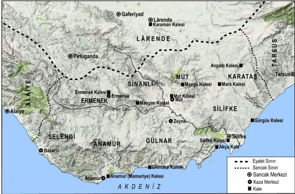
Harita: 16. Yüzyılda İçel Sancağının Genel İdarî Görünümü ve Kalelerin Konumu