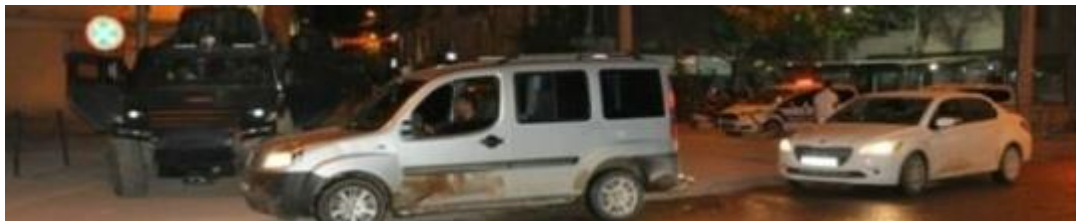
Görüntü 8: Ceylanpınar Akşam Trafiği

Ceylanpınar’daki bu görüntülerin eğitim açısından yetiştirilen bireylerdeki yarattığı algının sorgulanması gereklidir.