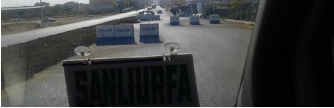
Görüntü 1: Ceylanpınar'a Giriş

Ceylanpınar İlçesi'ne giriş, yoğun güvenlik önlemleri eşliğinde gerçekleştirilmektedir. Bu yoğun güvenlik önleminin, ilçenin içinde bulunduğu karışıklık ve olağanüstü hal sebebiyle gerekli bir durum olduğu öne sürülse de, Ceylanpınar toplumunun bu görüntülerle yaşamak zorunda olması bir siyasi bir çekince yaratmaktadır.