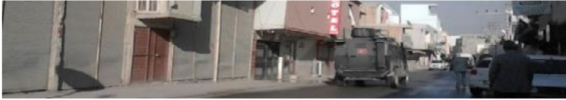
Görüntü 2: Ceylanpınar Mahali

Ceylanpınar mahalinde, sokak aralarında bile askeri tankları görmek mümkündür. Tanklar şehir içinde sürekli hareket halindedir. Merkez mahaline yakın birçok sokak arasında park edilebildiğine yönelik görüntüler de mevcuttur. Dahası insanların özellikle savaşlardan tanıdığı bu tanklar, toplumla neredeyse iç içe yaşamaktadır.