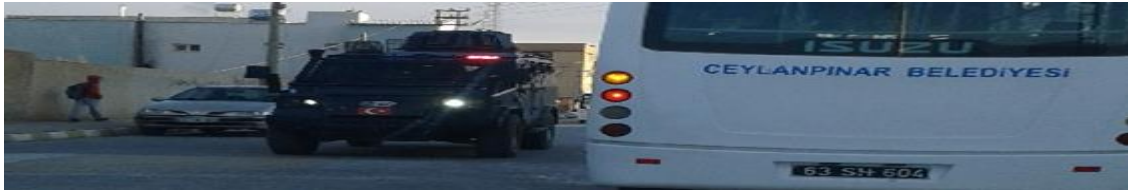
Görüntü 7: Ceylanpınar-Okul Güzergahı

Resmedilen bu görüntü, yol boyunca okulların bulunduğu bir mahalden çekilmiştir. Öğrencilerin yoğun olarak kullandığı bu yolda tanklar sürekli hareket halindedir. Dolayısıyla öğrenciler bu tanklara karşı zamanla tepkisizleşirken, bir taraftan da algısal teoriler geliştirmeye başlamışlardır. Araştırmacı tarafından edinilen gözlem ve öğrencilerle gerçekleştirilen söyleşilere göre ‘yakında savaş başlayacak, kaçımız hayatta kalacak belli değil, onun için okula çok sarılmaya gerek yok’ (Mayıs 2017) gibi... ( Afrin harekatı 20 Ocak 2018...! )