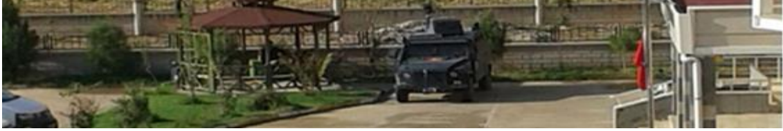
Görüntü 5: Ceylanpınar-Kamu Faaliyet Binası

Ceylanpınar’da eğitim ve benzeri kamusal etkinliklerin gerçekleştirildiği bu konferans salonunun alanında, askeri araçlar sıklıkla görülebilir. Başka bir deyişle gerçekleştirilen etkinliklere çoğu zaman güvenlik gerekçesiyle askeri araçlar eşlik etmektedir. Bu bağlamda eğitimsel ve kültürel anlamda oluşan etkinliklere toplumların geleceğini şekillendirecek gençlerin bireysel bağımsızlıklarının katkısı sorgulanabilir bir nitelik göstermektedir!