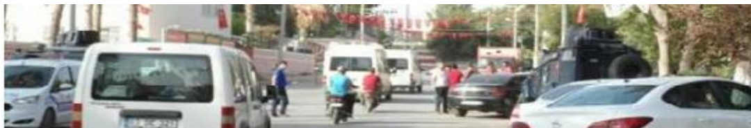
Görüntü 4: Ceylanpınar Trafığı

Ceylanpınar merkezinde bir banka önünde resmedilen bu görüntünün en düşündürücü yanı; insanların bu görüntülere duyarsızlaşabilecek derecede normal bakmalarıdır. İnsanların duyarsız yaklaşımında ise, siyasi psikolojiye yönelik oluşan korkunun etkili olduğunu söylemek mümkündür.