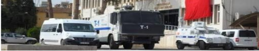
Görüntü 6: Ceylanpınar Kamu Alanı

Ceylanpınar’da tank adı verilen askeri araçların dışında, toplumsal olaylara müdahale etmek amacıyla kullanılan Toma adı verilen araçlara da rastlanılabilir... Ceylanpınar’ın kamusal hizmetlerini temsil eden bu görüntü, insanların siyasi psikolojisine dair olumsuz bir algı uyandırmaktadır.