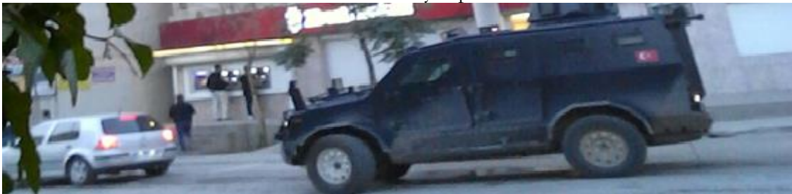
Görüntü 3: Ceylanpınar Merkez

Ceylanpınar merkezinde bir banka önünde resmedilen bu görüntünün en düşündürücü yanı; insanların bu görüntülere duyarsızlaşabilecek derecede normal bakmalarıdır. İnsanların duyarsız yaklaşımında ise, siyasi psikolojiye yönelik oluşan korkunun etkili olduğunu söylemek mümkündür.