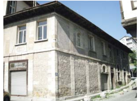
Resim 32. Mağazalarda kesme taş ve moloz taşın beraber kullanımı.