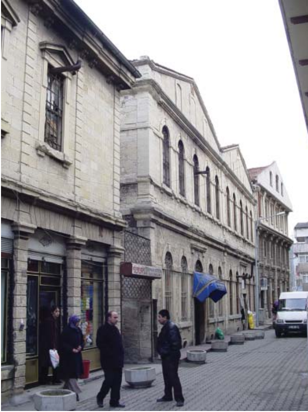
Resim 19. Dükkan 9, kuzey cephesi görünüşü.