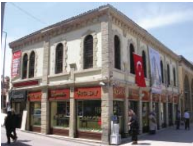
Resim 16. Dükkan 6, 2005 yılı restorasyonu öncesindeki durumu.

Banka Yolu üzerinde yer alan kârgir yapı, özgün halinde iki katlı olup, sonradan üzerine bir kat eklenmiştir. Yapının Cumhuriyet öncesinde bir dönem Osmanlı Bankası şubesi olarak kullanıldığı bilinmektedir. Günümüzde alt katta tekstil satışı yapan bir dükkan vardır, üst katlar ofis olarak kullanılmaktadır. Yapıya, cephe aksında yer alan geniş, kemerli bir kapıdan geçilerek girilmektedir. Pilastırlar cepheyi üç bölüme ayırmakta, giriş kapısının iki yanındaki bölümlerde kemerli ikişer pencere yer almaktadır. Alt kattaki pencere düzeni üst katta da devam etmekte, ana kapının üzerindeki bölümde aynı pencere düzeni tekrarlanmaktadır. Kapının iki yanında yer alan ve üst katta da devam eden dairesel sütunların yalın başlıkları vardır. Subasman seviyesinde ve iki kat arasında yer alan kat kornişlerinde ve pencere denizliklerinde yalın profiller görülürken, özgün çatı seviyesi altında yer alan kornişte çok daha yüksek dekorasyon uygulandığı görülmektedir.