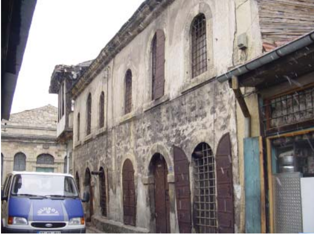
Resim 40. Mağaza 4, Kömürpazarı Sokak'tan görünüş.