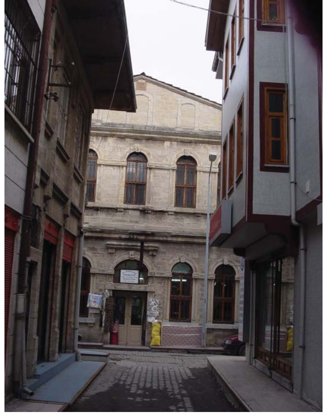
Resim 20. Dükkan 9, kuzey cephesinden detay.