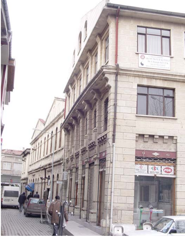
Resim 22. Bir başka köşe yapısı olan Dükkan 11, zemin üzeri üç katlıdır.