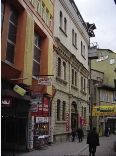
Resim 15. Dükkan 5, bir dönem Osmanlı Bankası şubesi olarak kullanılmıştır.

Önceki üç örneğe nazaran daha küçük bir yapı olmakla birlikte, onlarla benzer özelliklere sahiptir. İki katlı, kârgir bir köşe yapısı olup, alt katta dükkan yer alırken, üst katta ofis olarak kullanılan küçük odalardan oluşmaktadır. Günümüzde alt katta gıda satışı yapan bir dükkan vardır. Üst kat ise kullanılmamaktadır. Cephede alt katta düz atkılı geniş vitrinler bulunmaktadır. Üst katta, alt kattaki açıklıkların aksında yer alan birer kemerli pencere yer almaktadır. İki kat arasındaki kat silmesi, üst kat pencereleri alt kotunda kesintisiz olarak devam eden profilli denizlik ve saçak altındaki korniş, kesme taş cephedeki dekoratif öğelerdir.