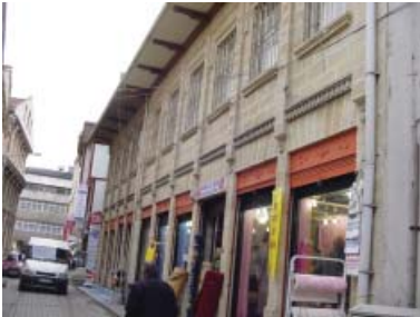
Resim 21. Dükkan 10, pilastırlar cephede süsleme elemanı olarak kullanılmıştır.

İplikçiler Yolu üzerinde bulunan iki katlı kârgir yapının giriş katı giyim ve ev eşyası satışı yapılan bir dükkandır. Üst katı depo olarak kullanılmaktadır. Zemin kattaki düz kemerli açıklık kesme taş sütunlar ile belirlenmekte, bu sütunlar üst katta pilastıra dönüşmektedir. Pilastırlar arasında dikdörtgen pencereler yer almaktadır. Üst kattaki pencere açıklıkları taş denizlikli ve taş sövelidirler. Pencereler arasında bulunan