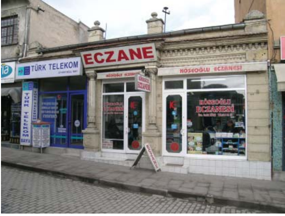
Resim 26. Tek katlı dükkan yapılarından K-Dükkan 3'ün sokak cephesi