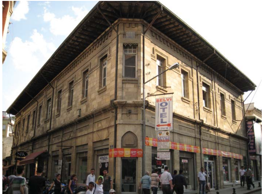
Resim 11. Köşe yapısı olan Dükkan 1'in genel görünüşü.

Belediye Caddesi ile Banka Yolu'nun kesiştiği köşede yer alan yapı, Dükkan 1 gibi iki katlı, kârgir bir bina olup, yine alt katı dükkan, üst katı ofis olarak düzenlenmiştir. Günümüzde alt katta beyaz eşya satışı yapılmakta olup, üst kat ise kullanılmamaktadır. Dükkan 1'den farklı olarak girişi pahlanmış köşeden değil, cephe üzerindeki bir kapıdan sağlanmıştır. Üst kata ulaşımı sağlayan ikinci kapı, dairesel kemerli, kemer üzengi seviyesinde süslemeli taştan yapılmış düz atkı bulunan dekoratif bir kapıdır. Alt katta cephe düzeni Dükkan 1 ile aynıdır. İki yapının aynı usta ya da mimarın elinde çıktığı düşünülebilir. Ancak, üst katta cephe düzeni farklılaşır. Buradaki pencereler dairesel kemerlidir. İki kat arasında ve üst kat pencerelerinin denizlik seviyesinden geçen silmeler ve saçak kornişleri cephenin diğer dekoratif öğeleridir. Ayrıca üst kat pencerelerinin