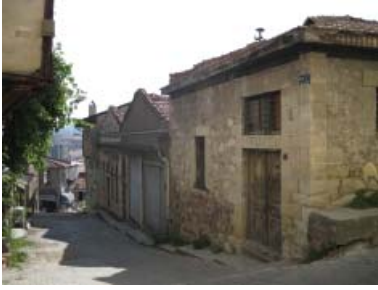
Resim 36. Üçgen alınlıklı, bodrum penceresi dairesel formda bir yapı