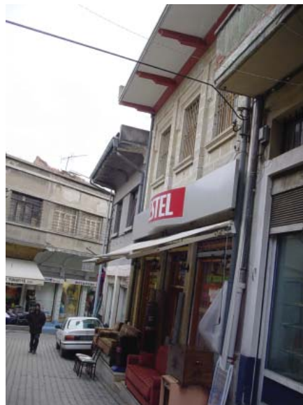
Resim 30. K-Dükkan 7, genel görünüş.