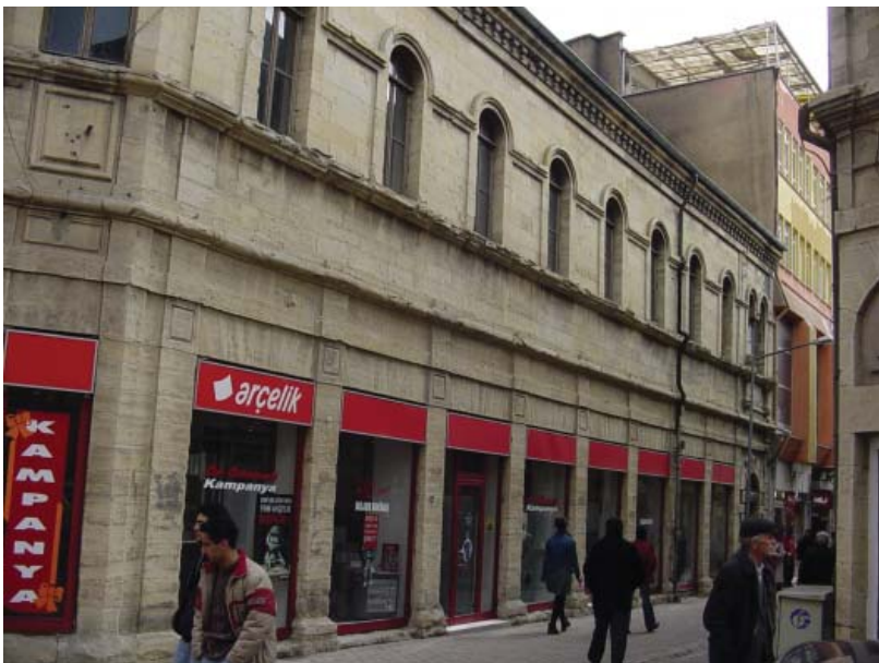
Resim 13. Belediye Caddesi üzerinde bir başka anıtsal yapı, Dükkan 3'ün görünüşü.