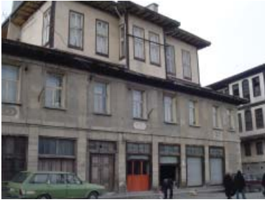
Resim 37. Mağaza 1, genel görünüş.

işçilikli değildir. Yapı köşeleri, kapı ve pencere söveleri kesme taş bloklarla vurgulanırken, aralarda moloz taş kullanımı görülmektedir (Resim 32, 33). Mağazalarda dairesel bodrum ya da zemin kat pencerelerine rastlanmakta, bunlar yine taş çerçevelerle vurgulanmaktadır (Resim 34). Pencerelelerde ve kapılarda metal şebekeler ve metal kepenkler görülmektedir (Resim 35). Yapıların tümü ahşap bir saçak ve çatıyla sonlanmaktadır. Genellikle son kat silmesinden sonra başlayan çatı, kimi örneklerde sağır bir üçgen alınlığı takip etmektedir (Resim 36).