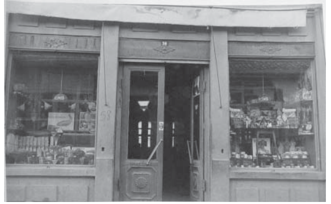
Resim 3. Dükkan 3, doğu cephesinden detay.