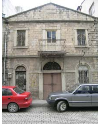
Resim 45. Mağaza 9, özgünlüğünü kısmen korumaktadır.