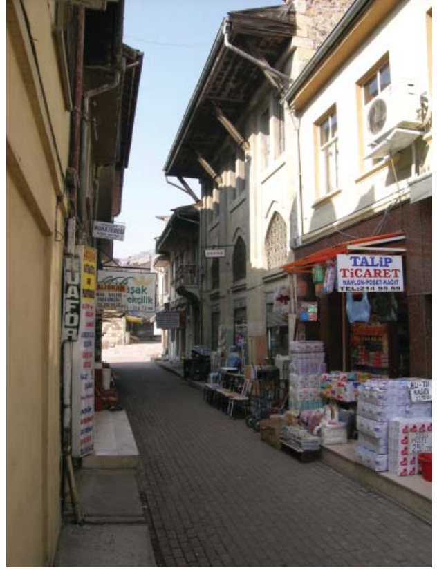
Resim 23. Dükkan 12, geniş saçığı ahşap payandalarla taşınmakta.

pilastırlar bir süsleme elemanı ile giriş kattaki açıklıkların üst kotunda son bulur. Pilastırlar arasında kat kornişini hizasında yalın bir silme, kesme diş motifleri ile cepheyi süslemektedir. Saçak korniş üzerinde yer alan geniş saçak sonradan betonarmeye dönüştürülmüş olmalıdır.