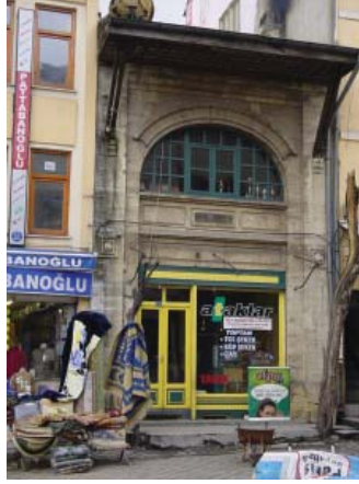
Resim 28. K-Dükkan 5, son katı geç dönemde eklenmiş, zemin kat cephesi ise özgünlüğünü kaybetmiştir.