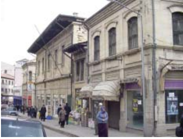
Resim 14. Köşe yapısı olan Dükkan 4 ve Belediye Caddesi üzerindeki diğer yapılar.

Belediye Caddesi üzerinde yer alan 3 katlı yapı, Kastamonu ticari merkezindeki en görkemli yapılardan biridir. Belediye Caddesi'ne açılan dar sokağa da cephesi vardır. Ofis binası olarak inşa edildiği bilinen yapı, bir dönem banka şubesi olarak kullanılmıştır. Günümüzde giriş katı, tekstil satışı yapan bir dükkan, üst katlar ise dükkana ait depo olarak kullanılmaktadır. Yapıya her iki cephesinden de, benzer özellik ve boyutlardaki kemerli iki kapıyla giriş sağlanmıştır. Cephede zemin katta daha bir çok yapıda yaygın olarak görüldüğü gibi, geniş açıklıklı camekanlar bulunmakta, üst katta ise kemerli pencereler yer almaktadır. İkinci ve üçüncü kat cephelerinde bir tek - bir çift pencereden oluşan ritmik bir düzen uygulanmıştır. Cephede çok zengin ince yonu taş işçiliği gözlenmektedir. Tek pencereler basık kemerli ve daha yalın, çift pencereler tepelikli ve daha yoğun dekorasyonludur. Pencere aralarında ve yapının köşesinde kesme taş plastırlar bulunmaktadır. Kat aralarında yalın profilli taş kornişler bulunmaktadır. Saçak korniş ise, kentte gördüğümüz diğer örneklerle nazaran oldukça zengin silme hatlarına sahiptir.