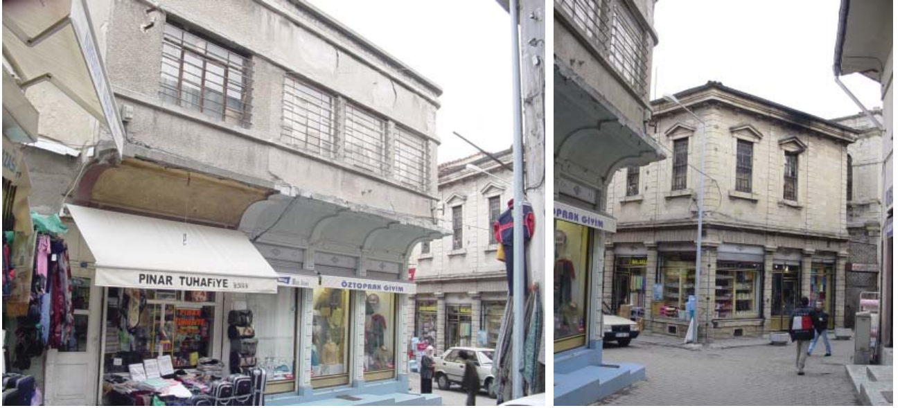
Resim 17. İplikçiler Yolu ve Kendir Hanı Yolu kesişiminde bulunan Dükkan 7, bir dönem müdahalesi ile kısmen betonarmeye dönüştürülmüştür.