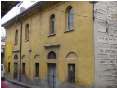
Resim 42. Köşe yapısı olan Mağaza 6'nın giriş cephesi.

Kömürpazarı Sokağı'nda yer alan kârgir yapı, bodrum ve giriş kattan ibarettir. Yapının üzerinde 1317H / 1899M tarihi yer almaktadır. Depo olarak kullanılan yapının, üçgen alınlıkla sonlanan ana cephenin merkezinde basık kemerli tepe pencere giriş kapısı yer almakta, bu kapının iki yanında da dairesel kemerli ikişer pencere bulunmaktadır. Pencere ve kapı söveleri kesme taş olup, kapı ve pencere kanatları metal ve demir şebekelidir. Pencere denizlik ve kemer üzenği kotlarında birbirlerine birer silmeyle dekoratif olarak birleştirilmişlerdir. Pencere üzenği kotlarındaki silme, cephe boyunca devam etmektedir. Kemerlerin kilit taşları belirginleştirilmiştir. Bodrum kat ile zemin kat hizasında yalın bir silme kullanılmıştır. Saçak korniş ise profillidir. Cephenin geneli, diğer mağazalardan farklı olarak ince yonudur. Üçgen alınlıkta moloz taş kullanılması ve saçak kornişinin üzerinde parapeti andıran bir bant bulunması, bu alınlığın sonradan eklendiğini düşündürmektedir. Kapının tepe penceresinin üzerinde yazıt yer almaktadır. Bodrum kata açılan eliptik pencere, giriş kapısının doğusunda yer almaktadır.