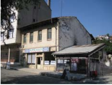
Resim 31. Üst katı yeniden yapılmış K-Dükkan 8.

pencere ile cephenin orta aksında kemerli tepe pencereyi giriş kapısı vardır. Pencere denizlikleri cephe boyunca devam ettirilmiş ve kemerlerin üzenği seviyeleri de geniş bir silme bandı ile sürekli hale getirilmiştir. Kilit taşları ve üzenği taşları yüzeyden ileri çekilerek belirginleştirilmiştir. Birinci kat cephe düzeni zemin kat düzenini tekrarlamakta, giriş kattaki kapı açıklığı, bu katta aynı boyutlarda bir pencere açıklığı olarak yer almaktadır. Giriş katı ile birinci kat arasında kat korniş, saçak kotunda da saçak korniş bulunmaktadır. Pencere söveleri ve kornişler dışında cephe sıvalıdır. Çatıdaki cihannüma, cephe aksında yer alan tek kemerli penceresiyle, alt katlardaki pencerelerle oran ve silme açısından benzerlik gösterir. Yapının, komşu yapılarla birleştiği yerlerde pilastırlar vardır. Benzer pilastırlar cihannümada da kullanılmış, ayrıca cihannümanın saçak bitişi yine profilli bir taş kornişle yapılmıştır.