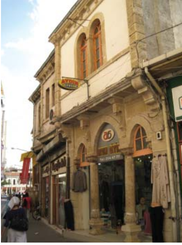
Resim 24. K-Dükkan 1, dar cephesi ile daha büyük boyutlu dükkanlara bitişik olarak konumlanmıştır.