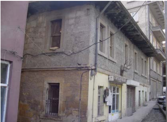
Resim 39. Köşe yapısı olan Mağaza 3'ün üç cepheden de girişi bulunmaktadır.