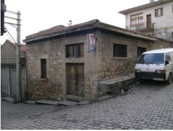
Resim 43. Mağaza 7 tek katlı ticaret yapılarına bir başka örnektir.