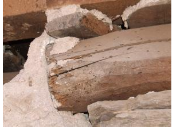
Şekil 13 - Yakından bakıldığında ahşap elemanlardaki bozulmalar oldukça net biçimde görülmektedir. Sol taraftaki fotoğraftaki elemanın kesit boyutlarındaki küçülme de rahatlıkla gözlemlenebilmektedir.