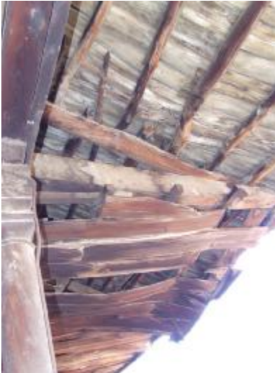
Şekil 9 - Ahşap Yapı Elemanlarında meydana geldiği gözlemlenen su ve nem etkisi

Genel olarak geleneksel konutların ahşap elemanlarla desteklenmesi ya da ahşap karkas olarak inşa edilmesi nedeniyle rüzgar ve deprem yüklerine dayanımlarının oldukça iyi olduğu söylenebilmektedir. Bu özellikleri incelenen yörelerdeki geleneksel konutların günümüze kadar ulaşmasında en önemli etkenlerden birisidir. Ancak bazı ahşap elemanların, kullanılan malzeme ya da eleman kesitlerinin basit işçiliği ve ek olarak da bakımsızlığın etkisiyle yatay yükler karşısında bozulmaya uğradıkları da gözlemlenmektedir (Şekil 10).