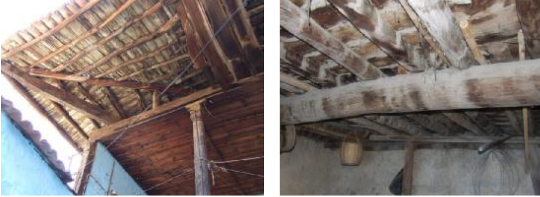
Şekil 6. Resimlerde görüldüğü gibi çoğu zaman kullanılan ahşap elemanlar basitçe işlenmekte ve bazen de yuvarlak kesitli olarak kullanılmaktadır.

Çatı konstrüksiyonu ise basitçe döşemede kullanılan sistemin eğimli olarak tekrarlanması olarak tanımlanabilir. Genellikle, çatı kırma çatıdır ve dört yöne eğimlidir. Çatı kaplaması olarak kullanılan kiremit örtüsüne uygun eğimi sağlamak için genellikle oturtma çatı konstrüksiyonu kullanılır. Çoğu zaman ahşap çatı konstrüksiyonunda kullanılan elemanların doğada bulunduğu biçimi ile yapıda kullanıldığı gözlemlenmiştir. Ahşap dikmeler yaklaşık 1,5-2,5 m aralıklarla, taşıyıcı duvar olmadığında, ahşap kirişler üzerine yerleştirilirler. Ahşap mertekler, aynı ahşap döşemede olduğu gibi, ortalama 50 - 60cm aralıklarla kiremit örtünün altında yerlerini alır. Çoğu örnekte tavan kaplaması da ahşaptır ve bu kaplama döşeme kirişlerine benzer biçimde tavan kirişleri tarafından taşınır.