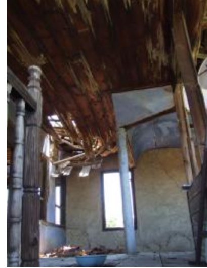
Şekil 12. Çürüyen ve taşıyıcılık özelliğini yitiren döşeme elemanları