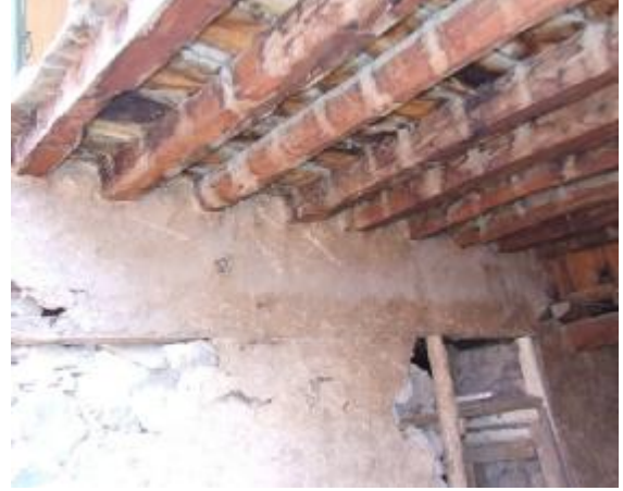
Şekil 16 – Döşeme Kirişlerinin Görünümü

Öte yandan bir diğer önemli etken ise, bozulan elemanları yenilemek ya da ihtiyaç değişikliklerine cevap verebilmek amacıyla konutlara yapılan yanlış müdahalelerdir. Ahşap malzemenin niteliklerinin yeterince bilinmemesi ve yapım sisteminin kendine özgü özellikleri olduğunun bilinçli / bilinçsiz göz ardı edilmesi sonucunda ortaya çıkan hatalı onarımlar nedeniyle bir yandan yapı tarihi ve estetik değerini yitirmekte, hatta zaman zaman yapının/elemanın taşıyıcılık işlevi de zarar görmektedir (Şekil 17).