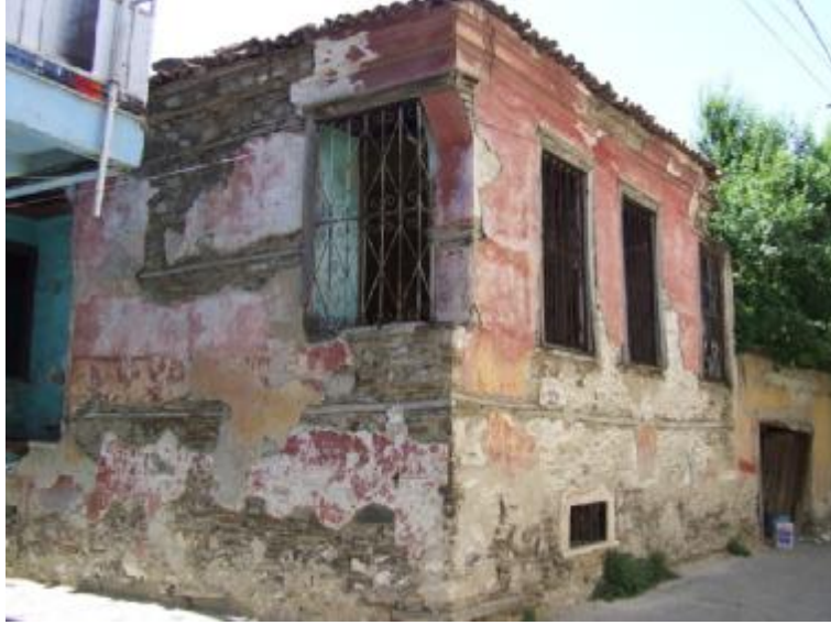
Şekil 3 – Kula’da küçük bir kargir yapı örneği. Tüm dış duvarlar moloz taş örgüsü ve yaklaşık 50 cm. yapının bir bodrum katı mevcut. Sıvanın döküldüğü yerlerde ise ahşap hatılları görmek mümkün. Köşedeki birleşim detayı hatılların üst üste bindirilmesiyle oluşturulmuş.