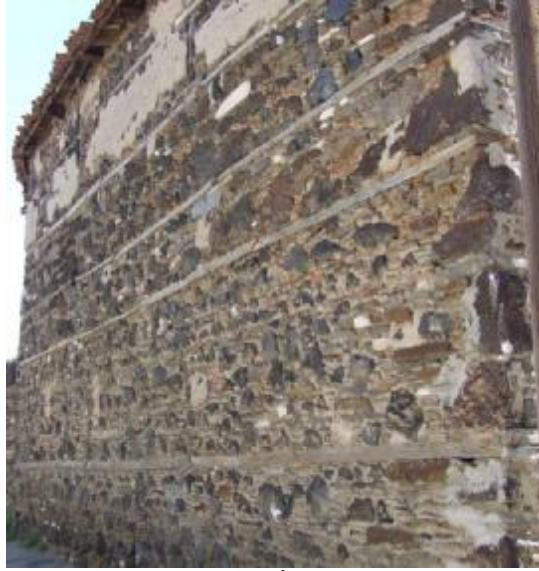
Şekil 2 - Kargir Duvar İçindeki Ahşap hatıllar

Yığma kargir yapıların günümüzdeki inşası açısından bakıldığında, 2007 yılında yürürlüğe konan Deprem Bölgelerinde Yapılacak Binalar Hakkında Yönetmeliğin 5. Bölümünde yığma binalar için depreme dayanıklı tasarım kurallarının anlatıldığı görülmektedir. Ancak bu yönetmelikte inşa edilecek yığma kargir yapılar için ahşap hatıl ya da döşeme kullanımı söz konusu değildir. Yalnızca kerpiç malzemenin kullanıldığı yığma kargir yapılar için ahşap hatıl kullanımı tariflenmektedir. Yönetmeliğe göre, kerpiç yığma duvarlarda ahşap hatıl yapıldığı durumlarda, 100 mm× 100 mm kesitindeki iki adet kadron, dış yüzleri duvar iç ve dış yüzeyleri ile çakışacak aralıkta konulacaktır. Bu kadronlar boylamasına doğrultuda 500 mm'de bir 50 mm× 100 mm kesitinde dikine kadronlarla çivili olarak birleştirilecek ve araları taş kırıntıları ile doldurulacaktır. Kerpiç duvarlı binalarda kapı üst ve pencere üst ve altlarına ahşap lento yapılabilir. Ahşap lentolar ikişer adet 100 mm×100 mm kesitinde ahşap kadronla yapılacaktır. Ahşap lentoların duvarlara oturan kısımlarının her birinin uzunluğu 200 mm'den az olmayacaktır (Bayındırlık ve İskan Bakanlığı, 2006). Yönetmelikle tariflenen kerpiç yapılardaki yatay hatılların düzenlenmesi ile ilgili ilkeler, gerçekte geleneksel konutlardaki sistemle benzerlik göstermektedir (Şekil 2 ve 3). Geleneksel konutlarda zarar görmüş ya da güçlendirilmesi gereken örneklerde bu ilkeler doğrultusunda önlemler almak doğru olacaktır.