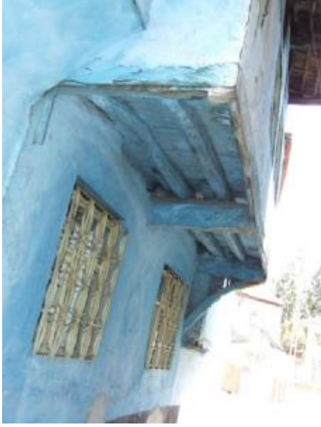
Şekil 7. Ahşap çıkma örneği