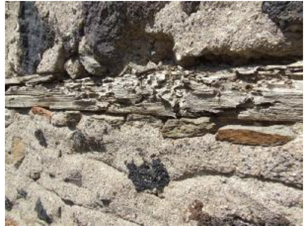
Şekil 17 - Bu örnekte ise basit bir bahçe duvarı görülmektedir. Yakından bakıldığında ahşap hatıllardaki bozulmalar ve yer yer duvarda oluşan çökmeler görülmektedir. Duvarda bozulmaların olduğu yerlerde ise büyük ihtimalle ev sahibinin kendisi tarafından uygulanan çözüm ise yıkık bölümün tuğla ile doldurulması olmuştur.