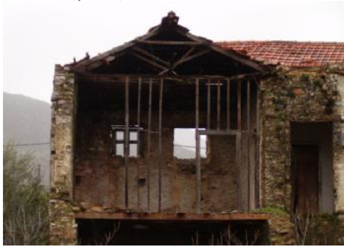
Şekil 5 - Kargir yapıda ahşap döşeme kirişleri, ahşap çatı ve ahşap lentolar

Geleneksel konutlarda, kat döşemeleri ve çatı daha önce de belirtildiği gibi ahşap malzeme kullanılarak inşa edilen önemli yapı elemanlarıdır. Döşeme ve çatı, yağma kargir yapılarda, yatayda bağlayıcı olarak görev üstlenmektedirler. Kargir duvarlar üzerine bazen doğrudan, bazı örneklerde ise ahşap yastıklar aracılığıyla oturtulan ahşap kirişli döşemeler tek doğrultuda çalışmaktadırlar (Şekil 5).