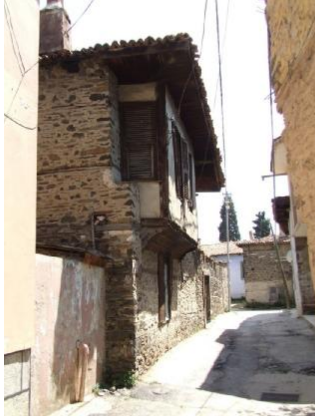
Şekil 1 – Kargir Duvarları taş malzeme ile inşa edilmiş Geleneksel Türk Konutu Örneği – Ahşap Hatıllar, ahşap çıkma ve çatı rahatlıkla gözlemlenmektedir. (Kula)