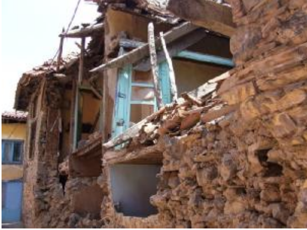
Şekil 15 - Resimde iki katlı ve moloz taştan imal edilmiş ve terk edilmiş bir örnek görülmektedir. Yapının döşemeleri ve çoğu yıkılmış olan çatısı da ahşaptır.