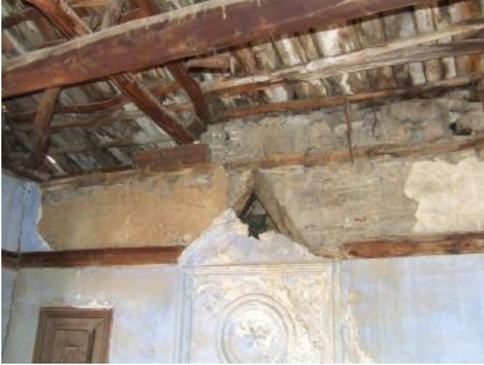
Şekil 11. Ahşap elemanlarda mantar etkisiyle görülen renk değişimleri

Bakteri ve mantar etkisi sonucu oluştuğu düşünülen ve yaygın olarak görülen bozulmalar elemanlardaki renk değişimi ve çürümedir (Şekil 11 ve 12). Öte yandan, incelenen bazı yapılarda, ahşap elemanlarda çeşitli böceklere ait deliklere ve elemanlarda kesit kaybına rastlanmıştır (Şekil 13).