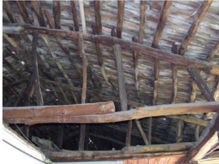
Şekil - 10 Çatı konstrüksiyonunda basit işçilik ve düzensiz eleman kesitlerinin de etkisiyle oluşan deformasyonlar