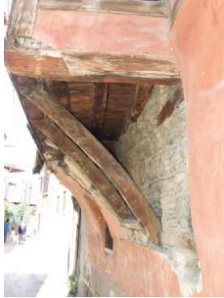
Şekil 8. Çıkmayı destekleyen diyagonal elemanlar