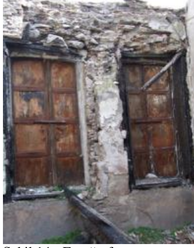
Şekil 14 - Fotoğrafta yapının yangın etkisi ile zarar gören ahşap lentoları ve dolayısıyla da yıkılmak üzere olan kargir duvarı görülmektedir.

hasarlar oluşmakta, kargir duvarları bir arada tutan ahşap elemanların taşıyıcılığını kaybettiği durumlarda ise, kargir duvarlarında yıkıldığı gözlemlenmektedir (Şekil 14).