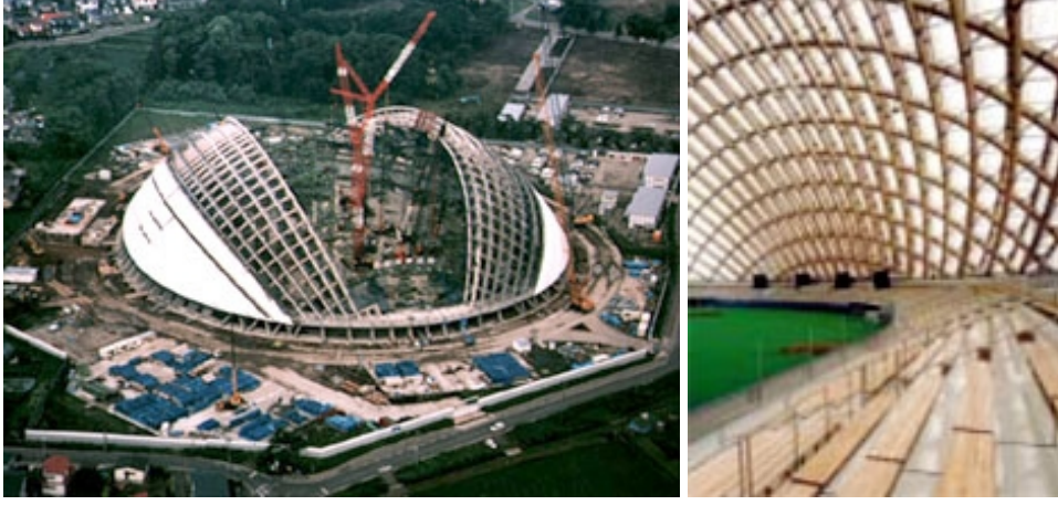
Fotoğraf 11. Odate Jukai Dome Park, Toyo Ito

beri bilinen bir malzeme olmakla beraber mimarlıkta büyük konferans salonları, oditoryumlarda, eğrisel formlara uygunluğu nedeniyle 20.yy.'ın sonuna doğru geliştirilmiş ve kullanılır olmuştur.