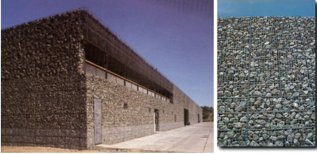
Fotoğraf 6. Dominus Şaraphanesi ( http://www.kfog.com/Blog/Blog/Main.asp )

Bunun yanı sıra tekrar kullanılabilir, dönüştürülebilir ve doğada ayrıştırılabilen malzeme arayışları sonucunda yeni malzemeler ve yapım sistemleri üretilmektedir. Bu anlamda günümüzde bir çok yapı kimyasalı, kaplama malzemesi ya da strüktürel malzemeler geliştirilmektedir.