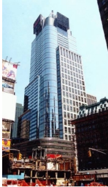
Fotoğraf 1. Conde Nast Ofis Binası

40 katlı Swiss-Re Binası (Londra, 1997-2004) da minimum kaynak kullanarak maksimum etki yaratmak için Norman Foster tarafından tasarlanmıştır. İki cam kabuk içine gizlenmiş üçgenel gridleme sisteminin oluşturduğu çelik bir strüktür ve kolonların bölmediği esnek ofis mekanlarından oluşmaktadır. Katları kesen helezonik atriumuyla dairesel plan, havalandırma yükünü azaltarak enerji kullanımını en aza indirmek için tasarlanmıştır. Aerodinamik formu,