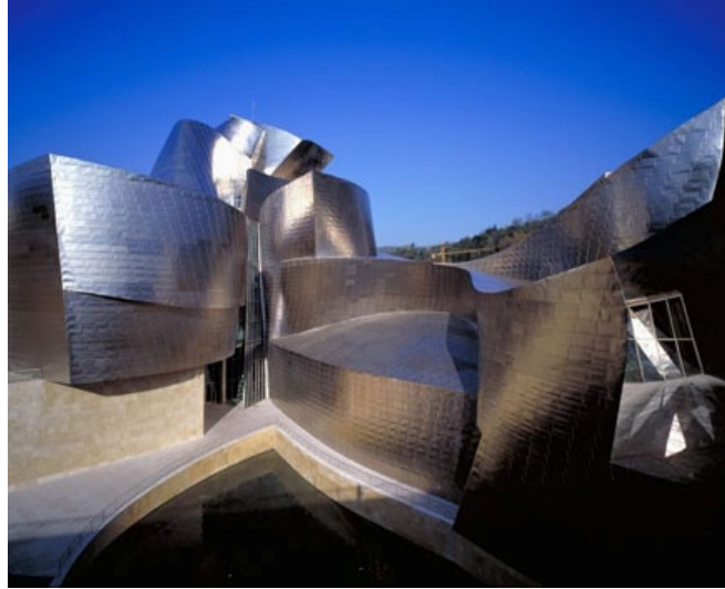
Fotoğraf 3. Bilbao Guggenheim Projesi

Frank O. Gehry farklı ve kendine özgü bir dil yaratmanın yolunu Fransa kökenli Dassault Systems tarafından Mirage savaş jetleri için geliştirilen CATIA adlı maket verilerini doğrudan imalata aktaran yazılımı mimari tasarım sürecine taşıyarak bulmuştur. Üç boyutlu elektronik modelleme ile tasarımı uygulamaya kolaylıkla dönüştürülebilen ve inşaat aşamasına yönelik uygulama projelerinin çizimlerinin atlanmasını sağlayan yazılım ilk olarak Bilbao'daki Guggenheim Müzesinde kullanılmıştır. Püskürtme beton üzerine 21.000 adet birbirinden farklı boyut ve eğrisel yüzeylerde parçadan oluşan titanyum kaplama, maketteki verilerin CATIA ile aktarılmasıyla yönlendirilen laserler tarafından kesilerek hazırlanmıştır (Utkuğ, 2002).