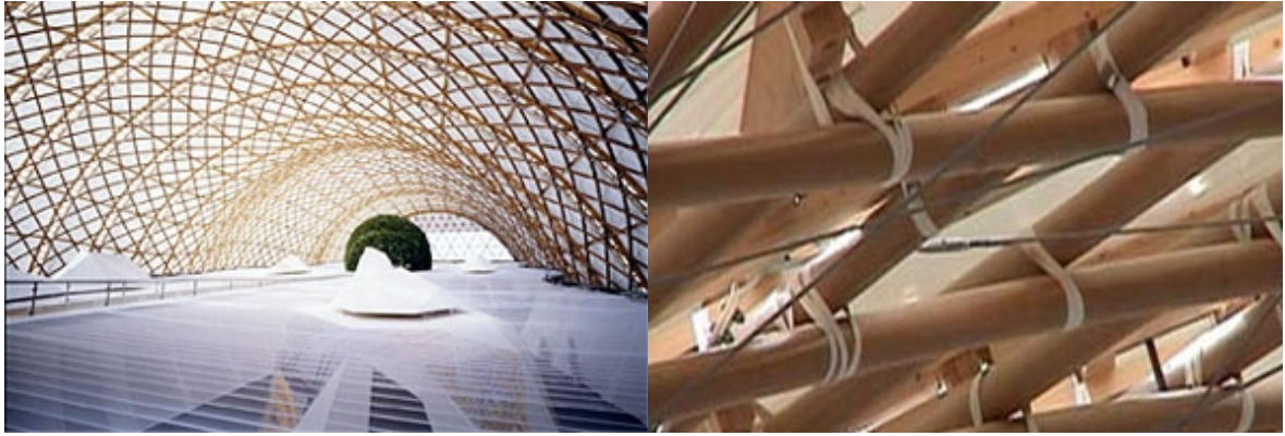
Fotoğraf 12. Odate Jukai Dome Park, Toyo Ito

Her yerde kolayca bulunabilen, tüketilip geri dönüşüm olanağı olan kullanılmış kağıtların, tutkalla, sarmal olarak kat kat yapıştırılması ve çeşitli işlemler ile suya dayanıklı boru biçimindeki kağıt kütükler haline getirilmesi sonucu üretilen geri dönüşümlü kağıt , Shigeru Ban'ın adı ile anılmaktadır. Expo 2000 Hannover Japonya Pavyonunda işlenmiş kağıt kütüklerin tel yardımıyla bağlanması ve üzerinin membranla örtülmesi sonucu strüktürel taşıyıcılığa da olan bir kabuk üretilmiştir.