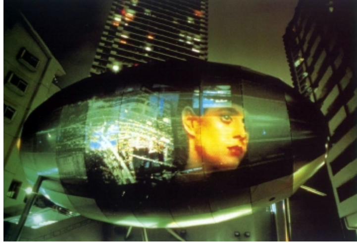
Fotoğraf 13. Toyo İto, Egg of the Winds, Tokyo, 1991

tasarlanan binalar, yani dijital imaj giydirilmiş cepheler bu kavramı ifadelendirebilir. Film, televizyon, video ve bilgisayar ekranları, ışık, hareket ve bilgiye karşı bir duyarlılık gösteren postmodern toplumda elektronik medyanın güncel strüktürlerle ve mimarlıkla işbirliği, bina kabuğunun bir dönüşümü ile sonuçlanabilmekte ve kabuk gerçek bir projeksiyon ekranına dönüşebilmektedir (Dilekçi, 2000). Bu tür çalışmalar mimari tasarımın destekleyici bir parçası olarak kullanılabilirler gibi, bilinen anlamda reklamlar olarak da karşımıza çıkabilmektedirler. Bu örneklerde yapı, üzerindeki görsel kavrayışla kazanılan izlenimlerin, üst üste gelen katmanların veya yansımaları projeksiyon ekranlarının oluşturduğu yüzey organizasyonlarının ifadesini yüklenmektedir.