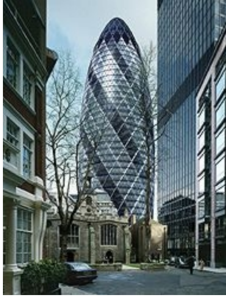
Fotoğraf 2. Swiss-Re Ofis Binası, ( www.benkoltd.com/bentley/projeler1.html )

strüktür üzerindeki rüzgar yükünü azaltmakta, mekanik soğutma ve havalandırma sisteminin yıl içinde toplam % 40'lık bir kısmını üstlenerek enerji tüketimini ve karbondioksit emilimini azaltmakta ve ofis mekanlarına doğal vantilasyon sağlamaktadır. Form planda dikdörtgen bir forma göre daha az yer kaplamasının yanı sıra, yukarıya doğru küçülen kesiti ile yansımaları azaltmakta, gün ışığının özellikle zemin katlarda daha rahat iç mekana girmesini sağlamaktadır. Yapının etrafında oluşan rüzgar tırbülansı ise yapının doğal havalandırması için kullanılmaktadır.