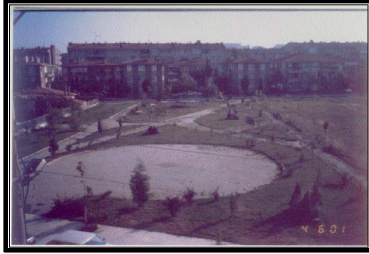
Şekil 3. Yeni yerleşim bölgesinde mahalle parkına bir örnek