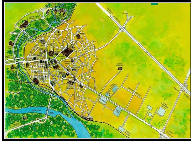
Şekil 1. Edirne'nin Haritası

Edirne, Balkan yarımadasının güneydoğu bölümünü oluşturan Trakya Bölgesinde Tunca ve Arda çaylarının Meriç nehrine karıştıkları yerde yarım daire şeklinde bir kavis içinde yer almaktadır (Anonim, 1967).