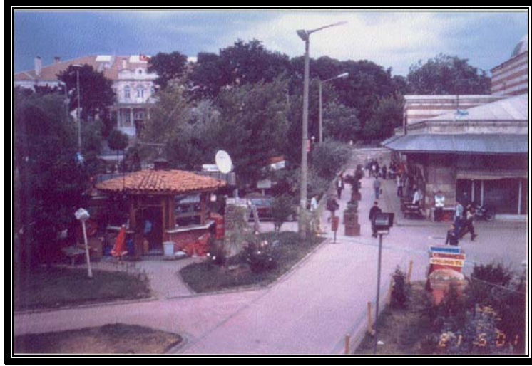
Şekil 4. Yaya yolundan bir görünüm