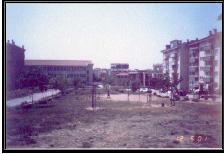
Şekil 2. Çocuk oyun alanı