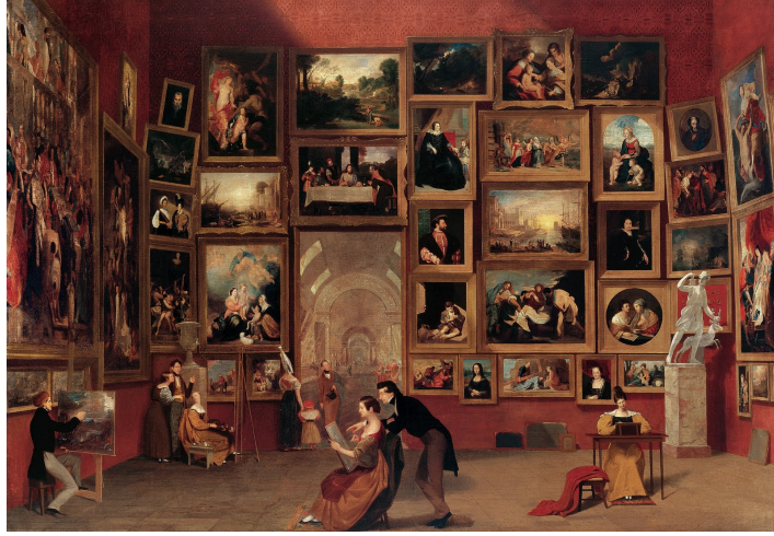
Foto 1: Samuel F.B. Morse “Louvre’da Sergi Salonu” 1832-1833

“British Museum’un 19. yüzyıl fotoğrafları, Viktorya döneminin kalabalık ve karanlık iç mekanlara olan eğiliminin, sergilere nasıl yansıdığını gösteriyor. 1870’ler de bile Greko-Romen galerileri düzenli bir sergi görünümüne yerine, aşırı kalabalık ve iyi sınıflandırılmamış bir depo izlenimi yaratıyordu.” 9