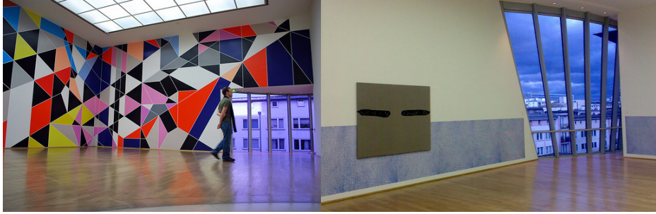
Foto 5: Frankfurt Modern Sanat Müzesi Foto 6: Frankfurt Modern Sanat Müzesi

“Biçim kaygısıyla elde edilmiş kesişen geometriler ve dağınık formlar, yatık galeri duvarları” 18 görsel algıya yeni bir bakış açısı getirirken bu tasarım kendi biçimsel özellikleri ile izleyiciyi, yapıt, mekan ilişkisinin başka bir boyutuna taşır. (Foto. 5,6)