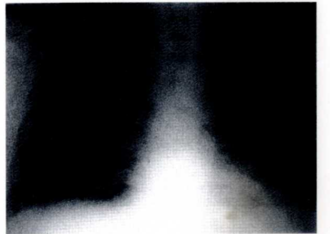
Şekil 2. Tedavi sonrası düzelen hastanın akciğer grafisi.

Tüberkülozun klinik tablosu silik ve tipik kaviter pnömoni, miliyer hastalık veya multiorgan tutulumu gibi değişik şekillerde olabilir (1,4). Olgumuzda klinik görünüm kaviter pnömoni şeklinde idi. Pulmoner infiltrasyonu olan ya da kültür negatif plevral effüzyonu olan her renal transplant alıcısında pulmoner tüberküloz akla gelmelidir. Enfeksiyonlar, endemik bölgede yaşama, malnutrisyon, aktif tüberkülozlu hasta ile yakın temas öyküsü, steroidlerle rekürren rejeksiyon tedavisi, greftte görülen fonksiyon bozuklukları ve yandaş hastalık bulunması tüberküloz görülmesi için risk faktörleridir. PPD (Tüberkülin deri testi) 'nin tanısız değeri sınırlıdır. Tanı için so-